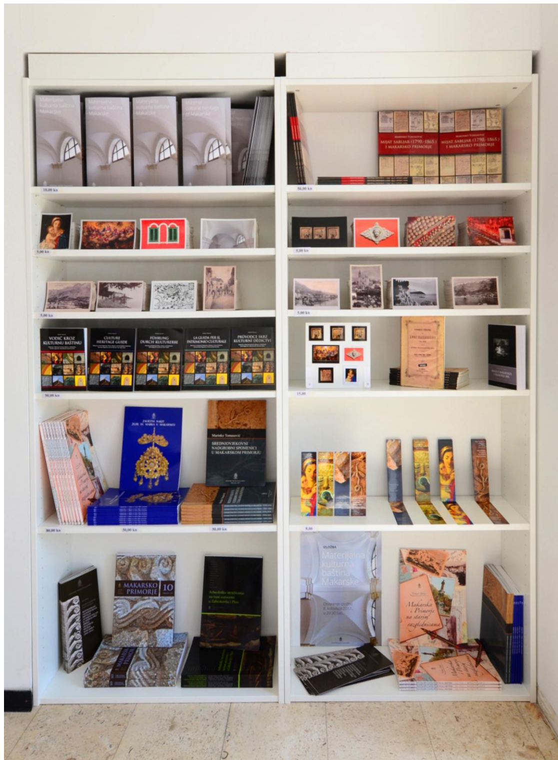
Slika 2. Tiskana izdanja Gradskog muzeja, razglednice i preostali sadržaji iz muzejske ponude u niši-suvenernici u prizemlju palače Tonoli - Ivičević