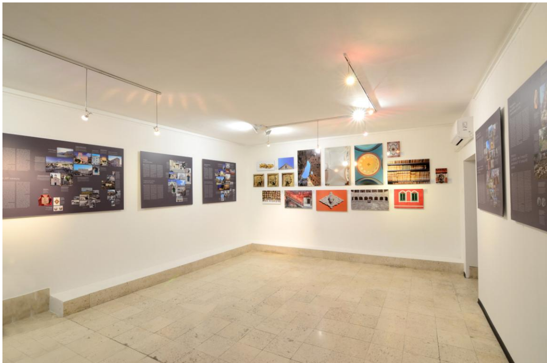
Slika 1. Izložbeni panoi i autorske fotografije u novouređenom prizemlju palače Tonoli - Ivičević