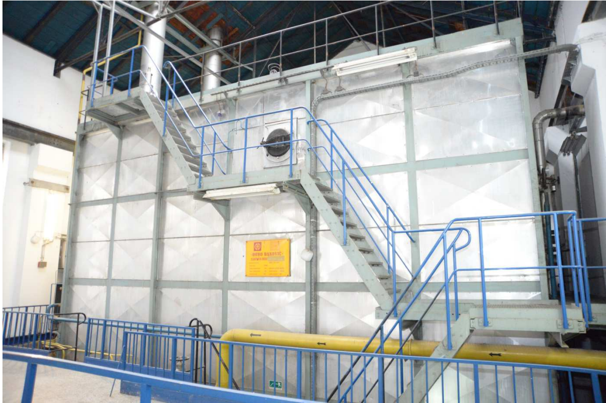
Vrelvodni kotao toplinske snage 58 MW