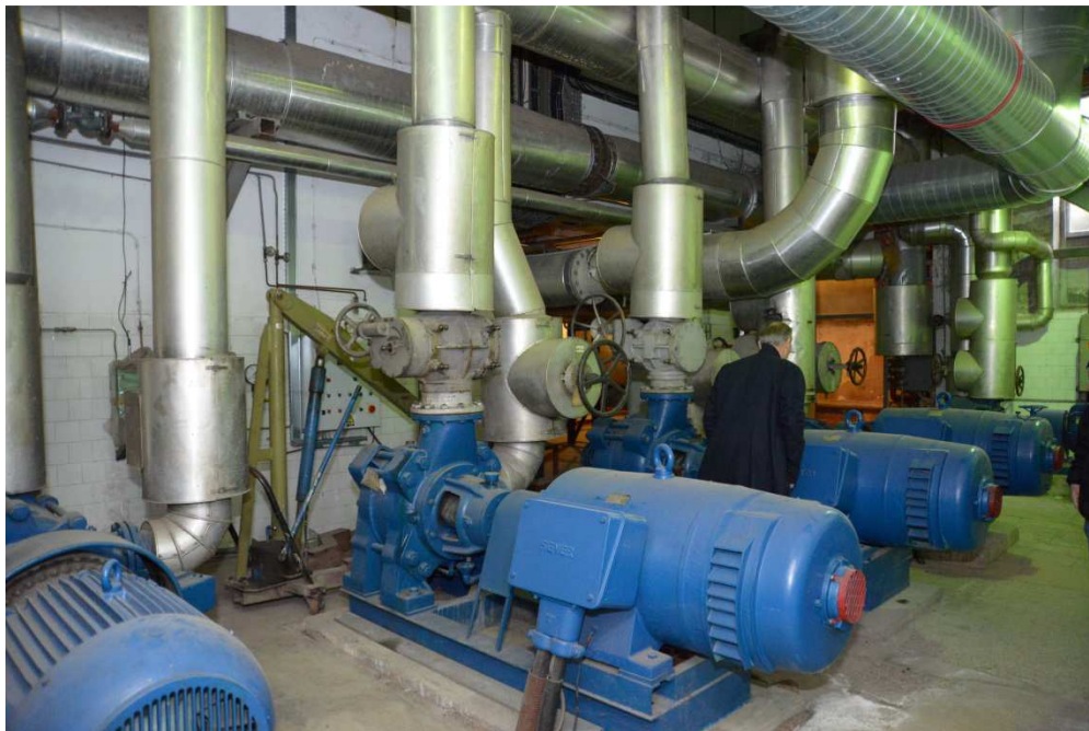
Pumpna stanica s tri pumpe