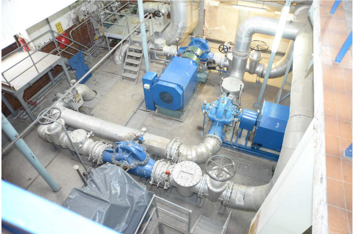
Vrelovodna toplinska stanica