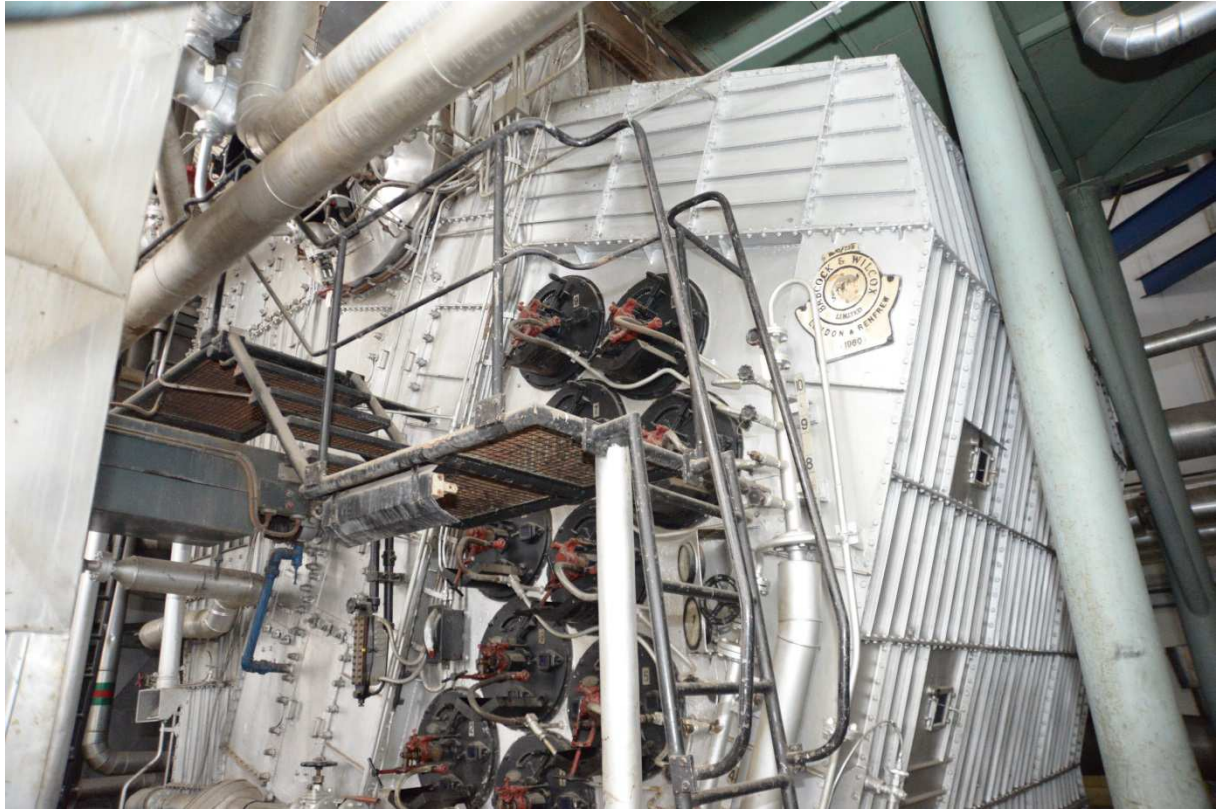
Parni kotao Babcock-Wilcox