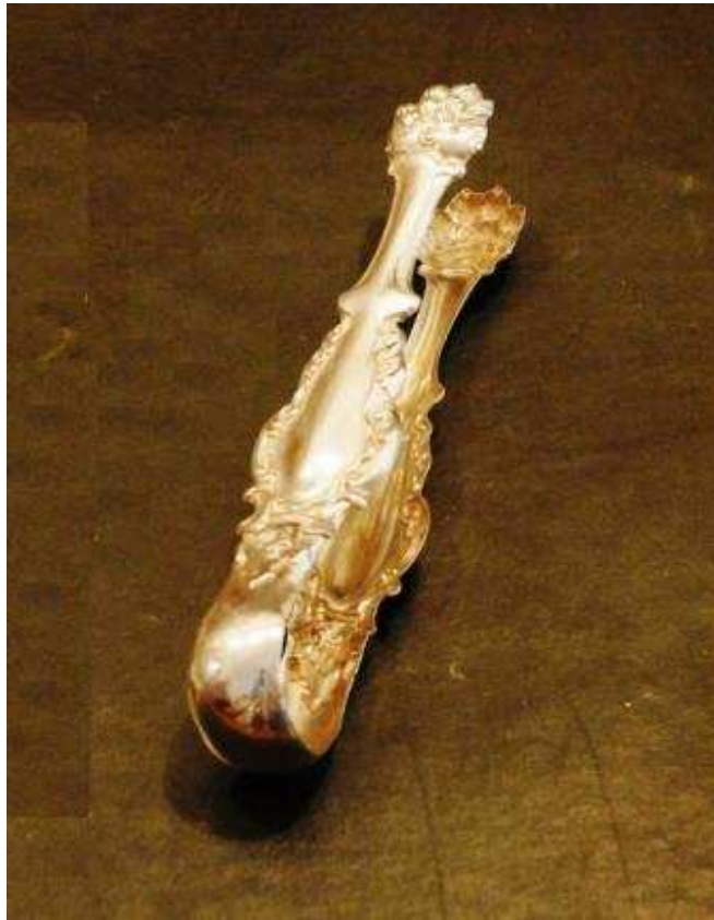
Hvataljka za šećer, 19. st.