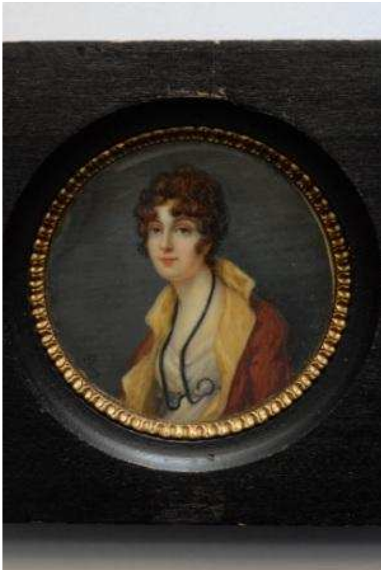
Portret duch. De Bolluno, Clery, poč. 19. st., minijatura