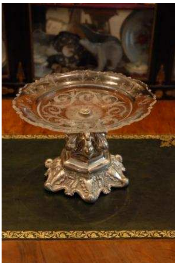
Podnos, Beč, oko 1880.