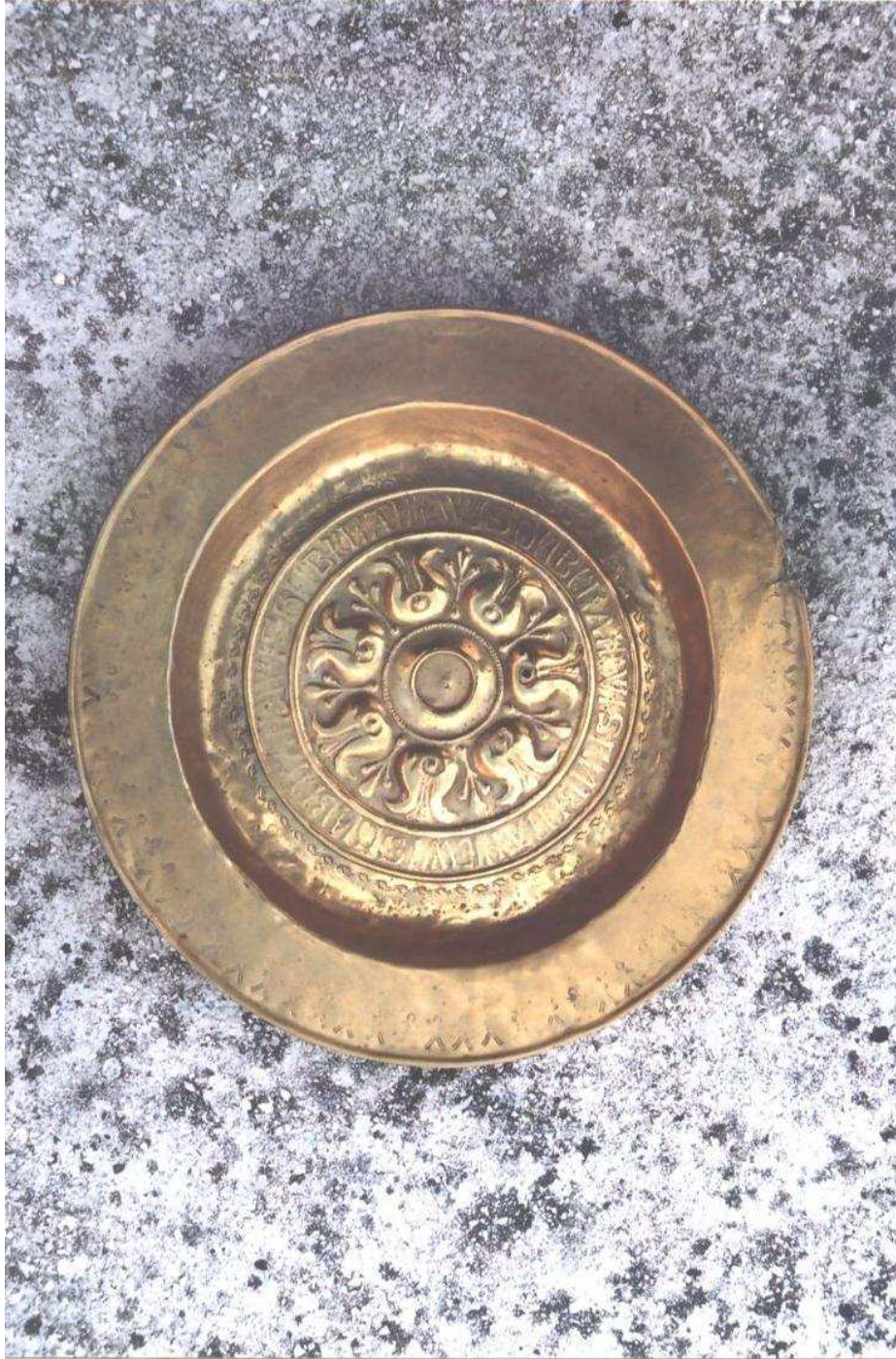
Tanjur, sjev. Europa ili Njemačka, kraj 15. – poč. 16. st.