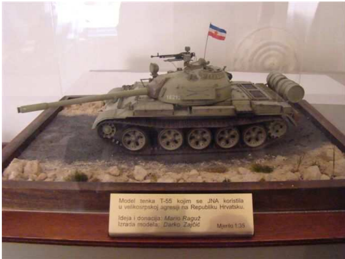
MSP – darovanje – Model tenka T-55 kojim se tzv. JNA koristila u agresiji na RH