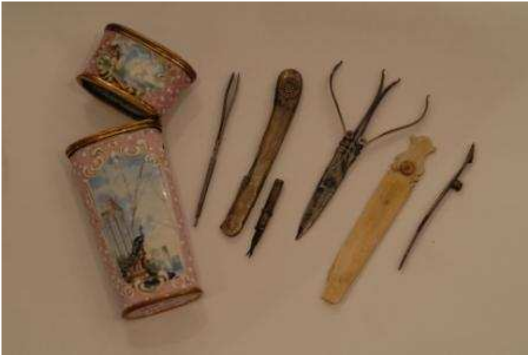
Etui za manikuru, 18. st.