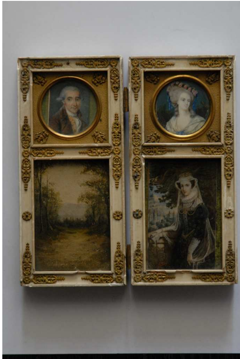
Minijature, portreti muškarca i žene, 18. st.