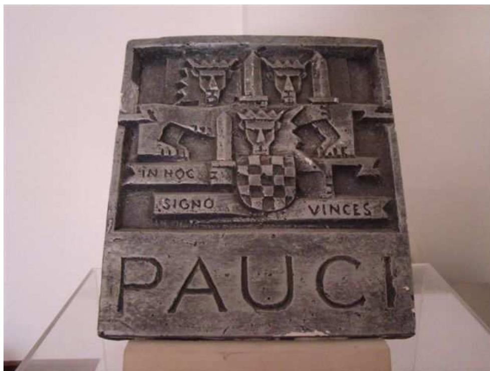
MSP – darovanje – Gipsana oznaka 4. gardijske brigade HV – “Pauci”