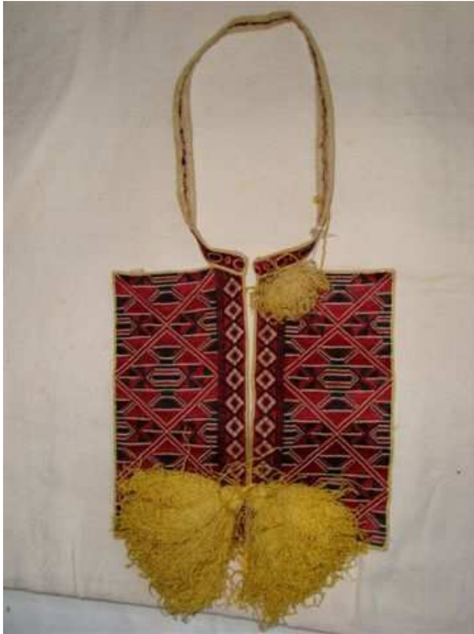
Etnografski muzej – Kupnja – Prsni vez sa ženske konavoske košulje “kadifače”, poč. 20. st.