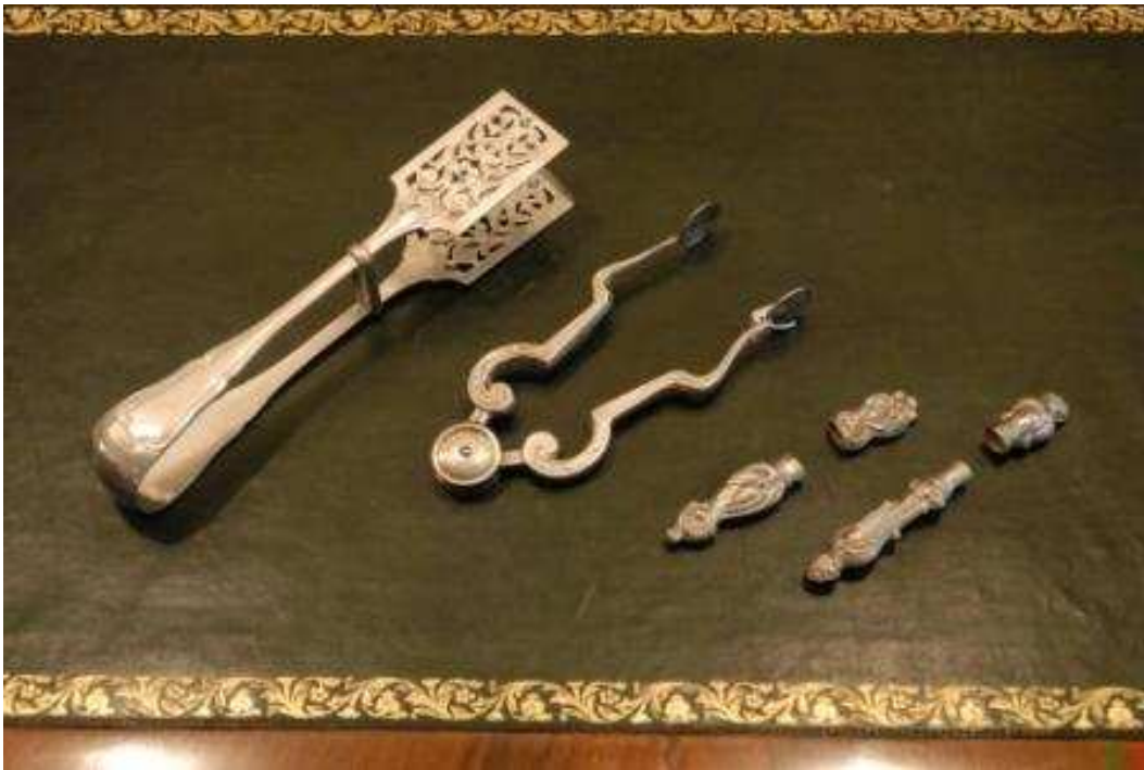
Hvataljka za kolač, Beč, 18. st.; hvataljka za šećer, 19. st.; spremnice za igle, 19. st.