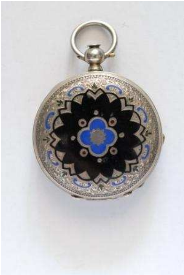
Ženski džepni sat, Vacheron, Geneva, 19. st., srebro, emajl