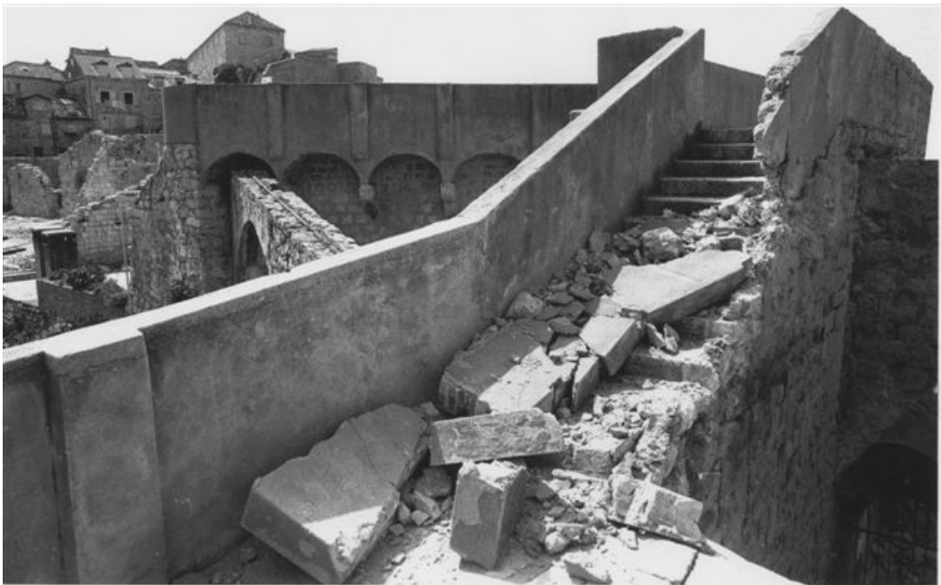
MSP – darovanje – Fotografija oštećenih gradskih zidina u srpsko-crnogorskom napadu, 6. prosinca 1991.