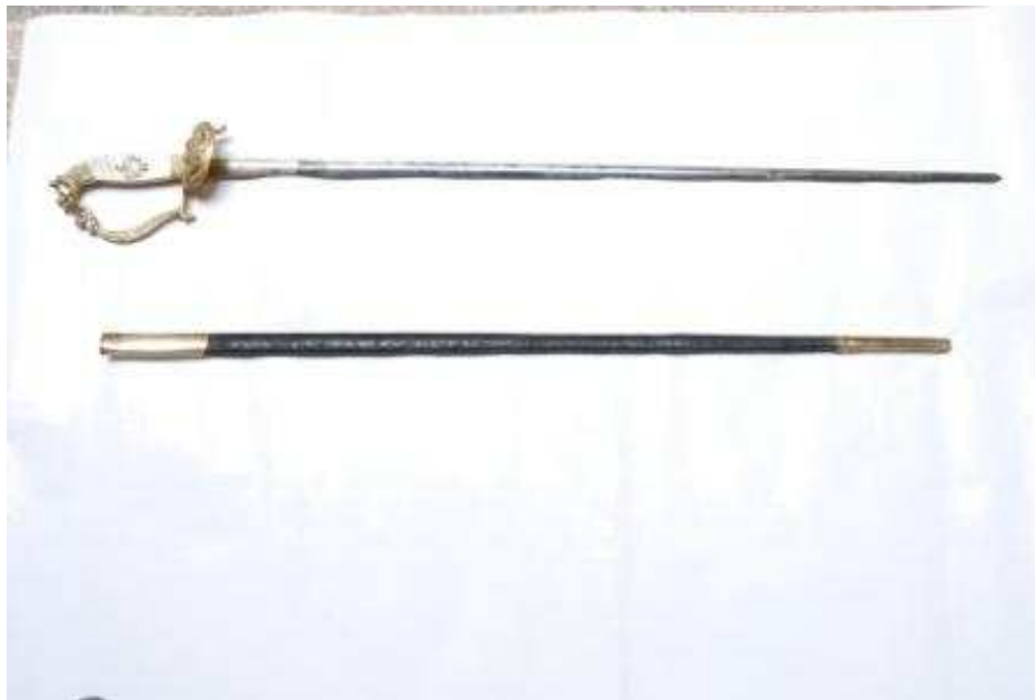
Austrijski paradni činovnički mač iz vremena Franje I. (1808.- 1835.)