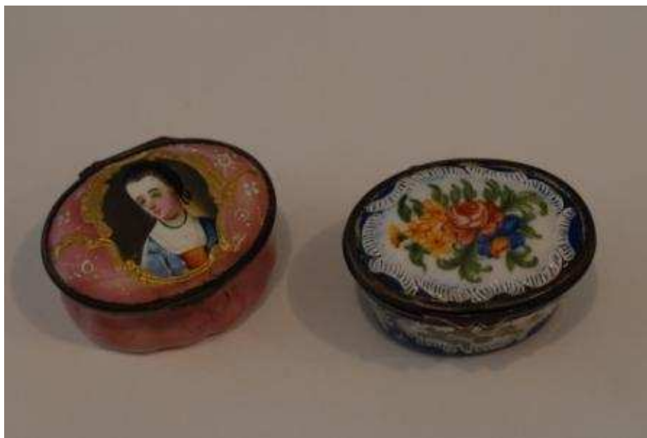
Burmutice, 18. st.