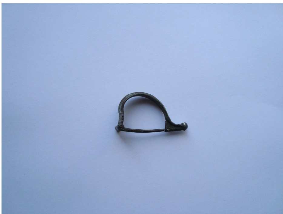
Pomorski muzej – darovanje – rimska fibula