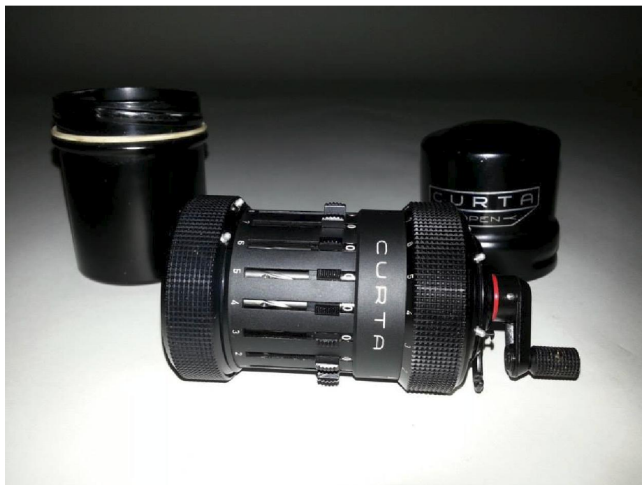
Mehanički kalkulator Curta I