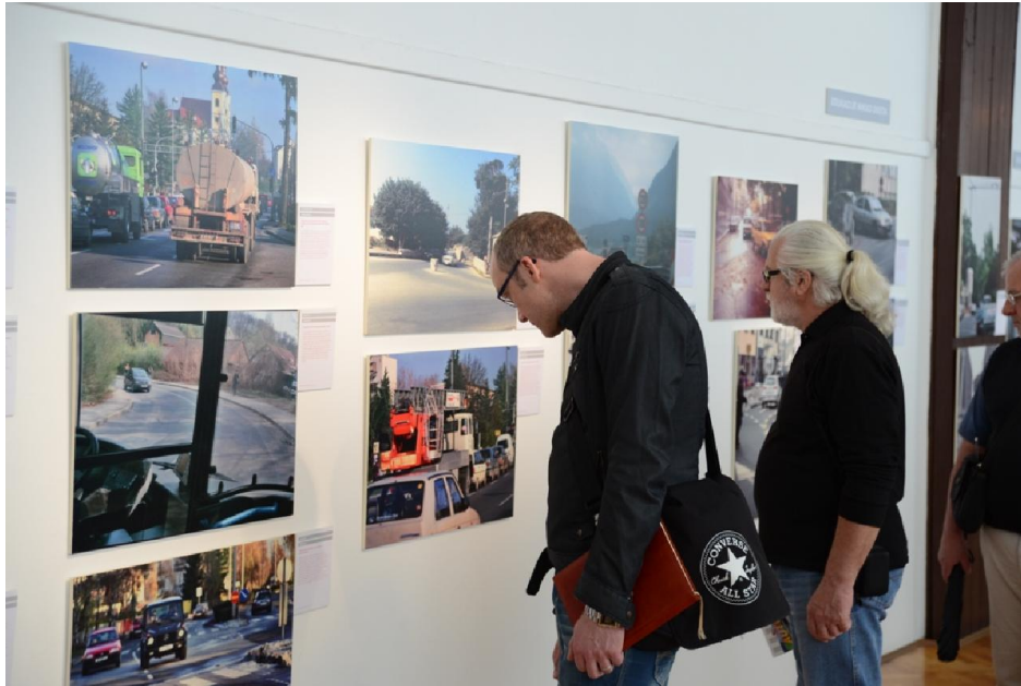
Izložba Život s automobilom (1972. - 2012.)

Tijekom četrdesetogodišnjeg rada stvorio je bogatu dokumentaciju od više tisuća negativa tematski podijeljenih na promet u zemlji i svijetu, razvoj auto servisne djelatnosti te tiskarstva u bivšoj državi.