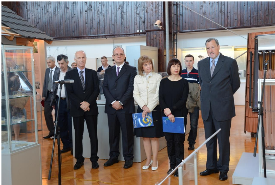
Svečano otvorenje odjela i infocentra Obnovljivi izvori i energetska učinkovitost