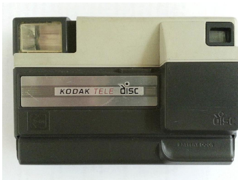
Fotoaparat Kodak Tele disc

- fotoaparat / Kodak, Tele disc , Vladimir Trnovski, Zagreb, inv. br. TM 8032