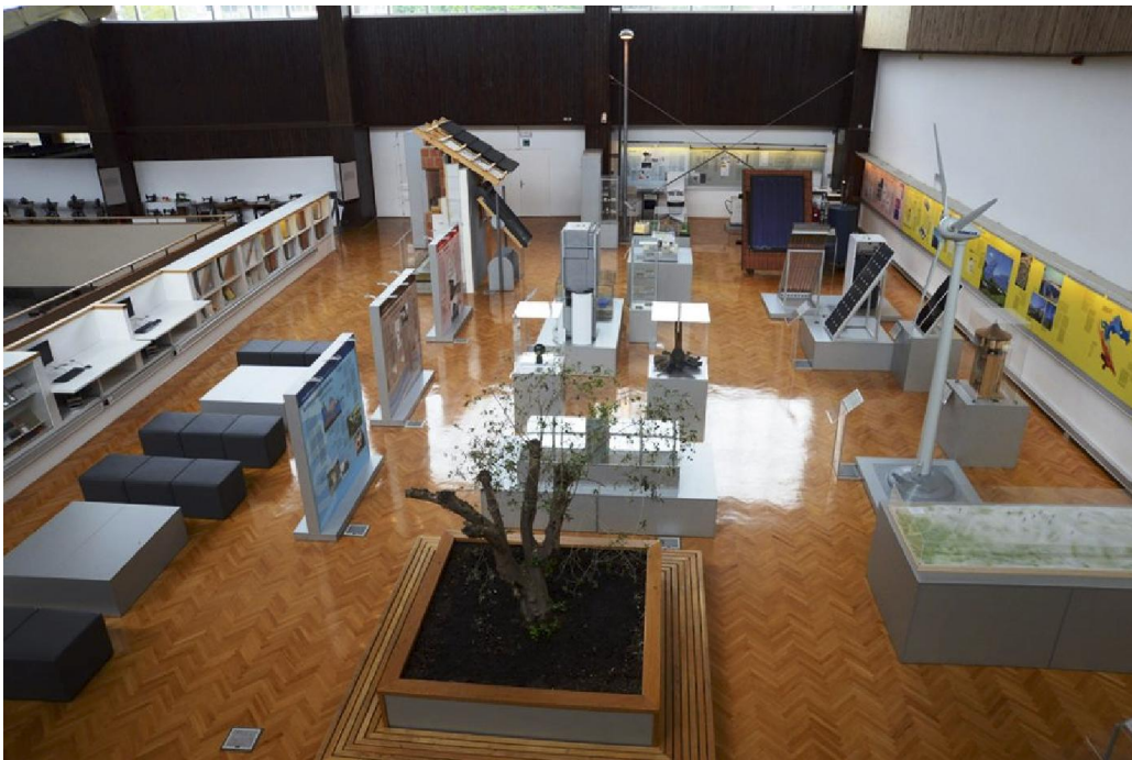
Stalni postav Odjela i infocentra Obnovljivi izvori i energetska učinkovitost

Kraći opis: Prostor je podijeljen na dva dijela, knjižnični i radionički dio te izložbeni prostor. Izložbeni dio odjela sadrži devet cjelina. Pet je cjelina o obnovljivim izvorima energije: biomasi i biogorivima, vjetroelektranama, sunčanim toplovodnim sustavima i sunčanim elektranama, dizalicama topline povezanim s tlom i hidroelektranama. Druga četiri segmenta odnose se na energetska učinkovitost u zgradarstvu, kućanskim uređajima i rasvjeti te na hibridna električna vozila. Prošlost sa sadašnjošću povezuju: vodeničko kolo, funkcionalni