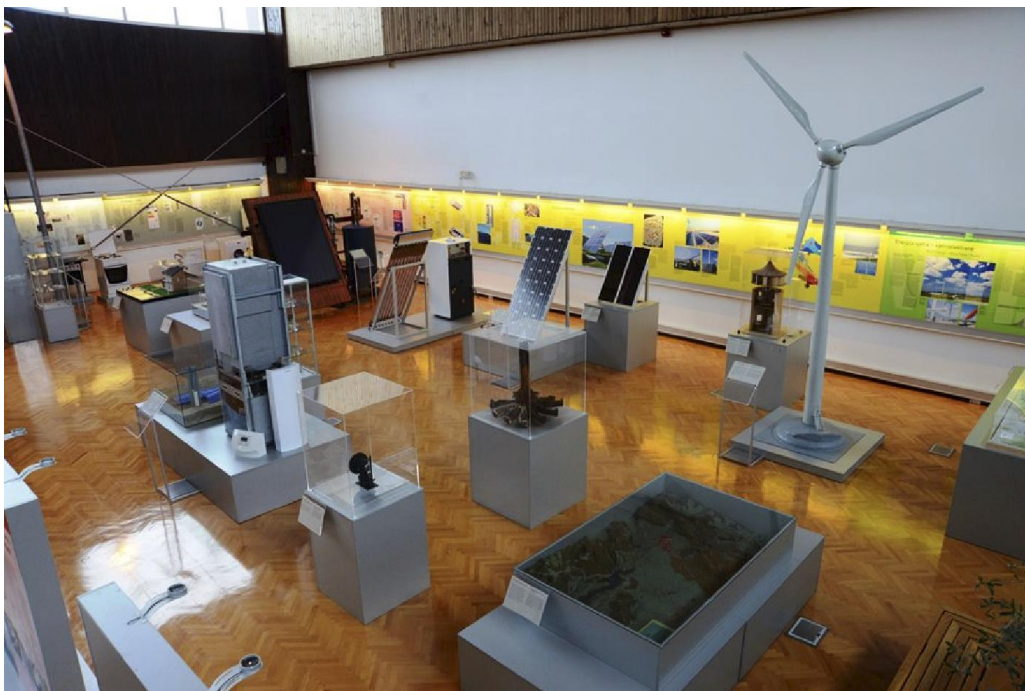
Stalni postav Odjela i infocentra Obnovljivi izvori i energetska učinkovitost

U izložbenoj hali Tehničkog muzeja, na površini 400 m 2 , 14. svibnja 2013. otvoren je stalni postav Odjel i infocentar „Obnovljivi izvori i energetska učinkovitost“ . Postav je ostvaren u suradnji s dvama partnerima: REGEA-om i EIHP-om, brojnim donatorima i sponzorima te istaknutim znanstvenicima i stručnjacima.