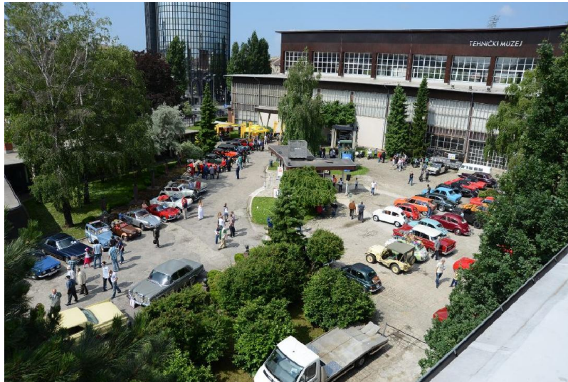
28. oldtimer rally

Organizacija i realizacija: Miljenko Paunović, Marijo Zrna