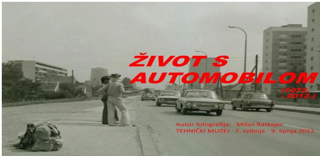
Pozivnica za izložbu Život s automobilom (1972.-2012.)