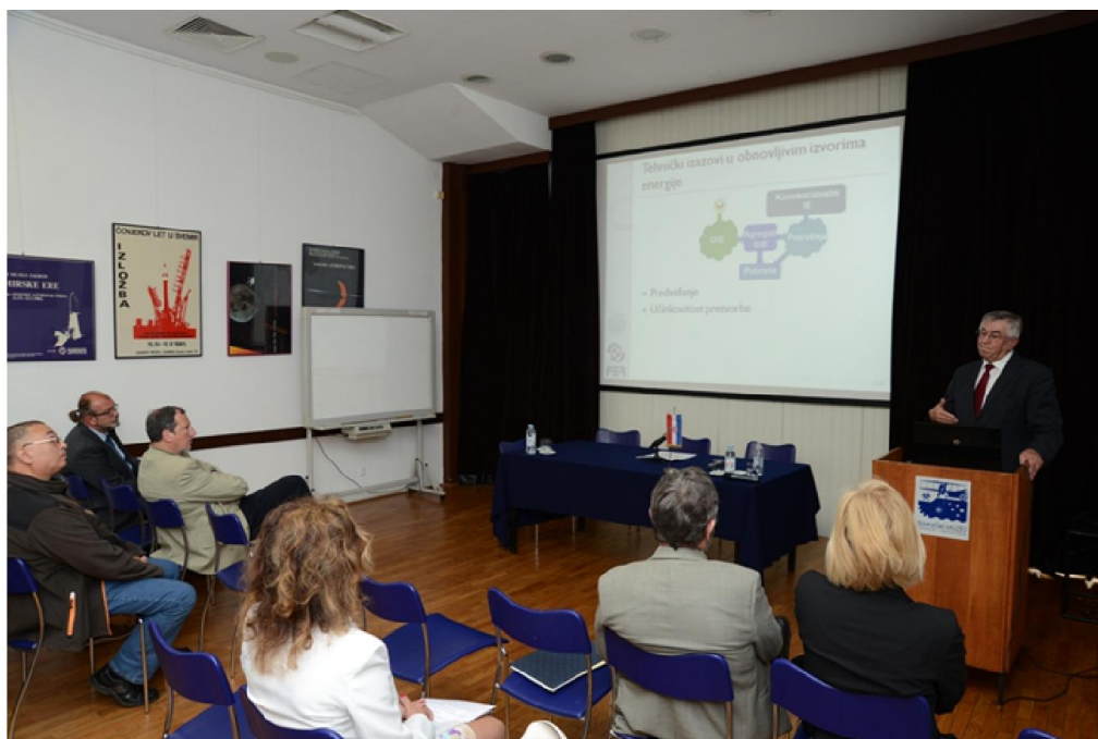
Tribina Energetska suverenost Hrvatske