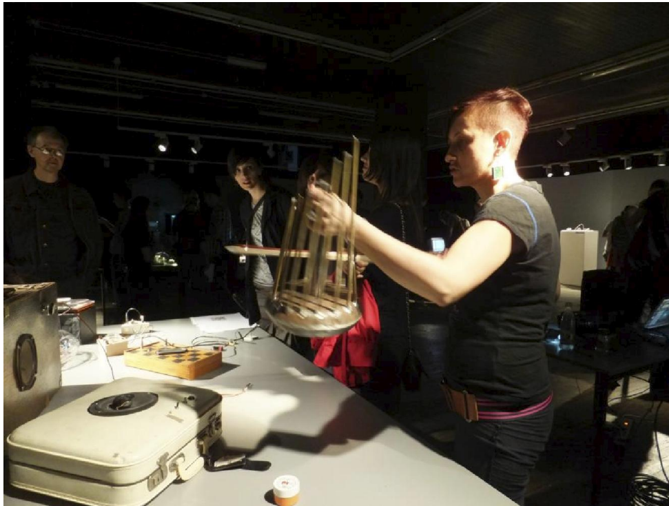
Interaktivna eksperimentalno-umjetnička izložba SoundART/BIOArt

Povezujući na izložbi zvuk i biologiju kroz elektroničke uređaje, članovi Media laba prezentiraju svoje audioinstrumente i gadžete (oscilatore, sintesajzere, zvučne kutije, teremine, filtre), instalacije pogonjene Arduino mikrokontrolerom i miniračunalom Raspberry Pi, akustičnim glazbenim instrumentima, upotrebom vintage i retro tehnologija, programskim jezicima, circuit bendingom.