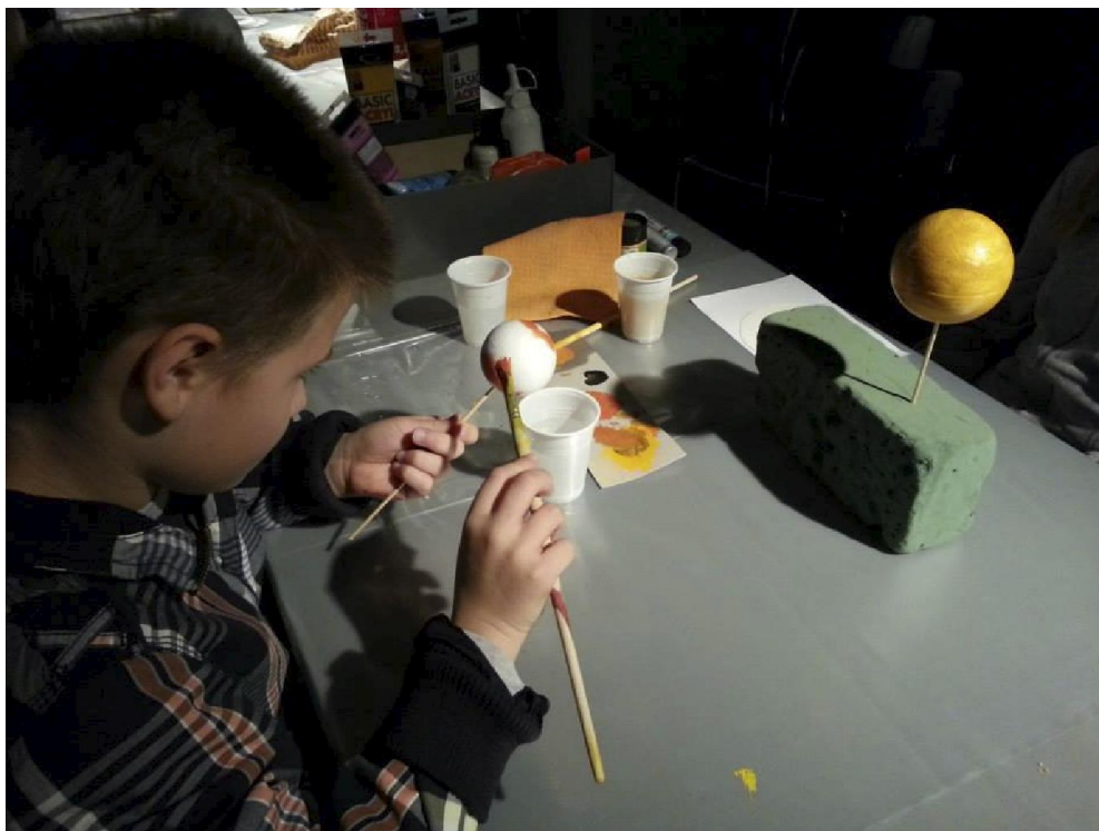
Radionica u sklopu izložbe-akcije Sunčev sustav

Na radionicama se učilo kako izraditi origami ždralove od papira u spomen na žrtve eksplozija atomskih bombi u Japanu i u znak želje za mir u svijetu.