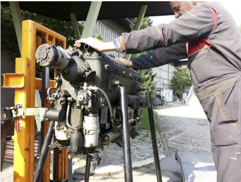
Restauracija-konzervacija avionskog motora Walter Minor 6/III

U prvoj fazi radova za kompletan „overhul“ motora obavljeno je kompletno rastavljanje motora, uklanjanje konzervansa na svim pozicijama, identifikacija dijelova pomoću epigrafskih oznaka, naručivanje i nabava potrebnih dijelova, identifikacija materijala te sanacija oštećenja i zamjena neispravnih dijelova. Motor je sklopljen, podmazan i pripremljen za pokretanje, čime je završena prva faza radova. Značaj ove restauracije je višestruk: omogućuje lakše praćenje stanja i pravilno preventivno i korektivno održavanje kako je i propisao proizvođač te omogućuje ostvarenje demonstracijske funkcije, što će biti ostvareno u drugoj fazi.