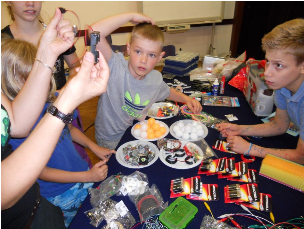
Blink! Blink! - kreativna radionica elektronike za djecu