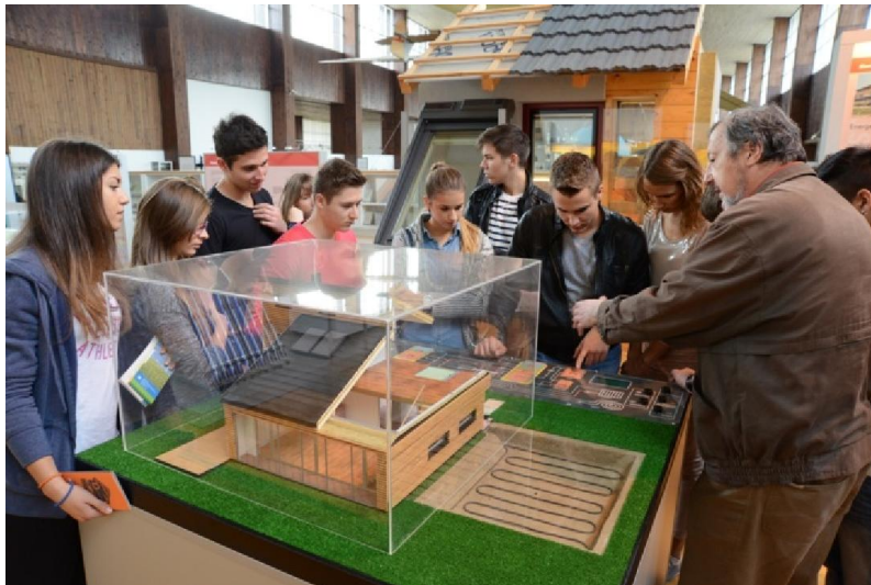
Metodska jedinica u Odjelu Obnovljivi izvori i energetska učinkovitost

Tijekom 2013. u stalnom postavu Muzeja su ostvarena 4263 stručna vođenja posjetitelja te 32 methodske jedinice.