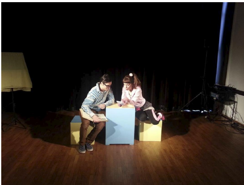
Premijera predstave Tko je to izumio