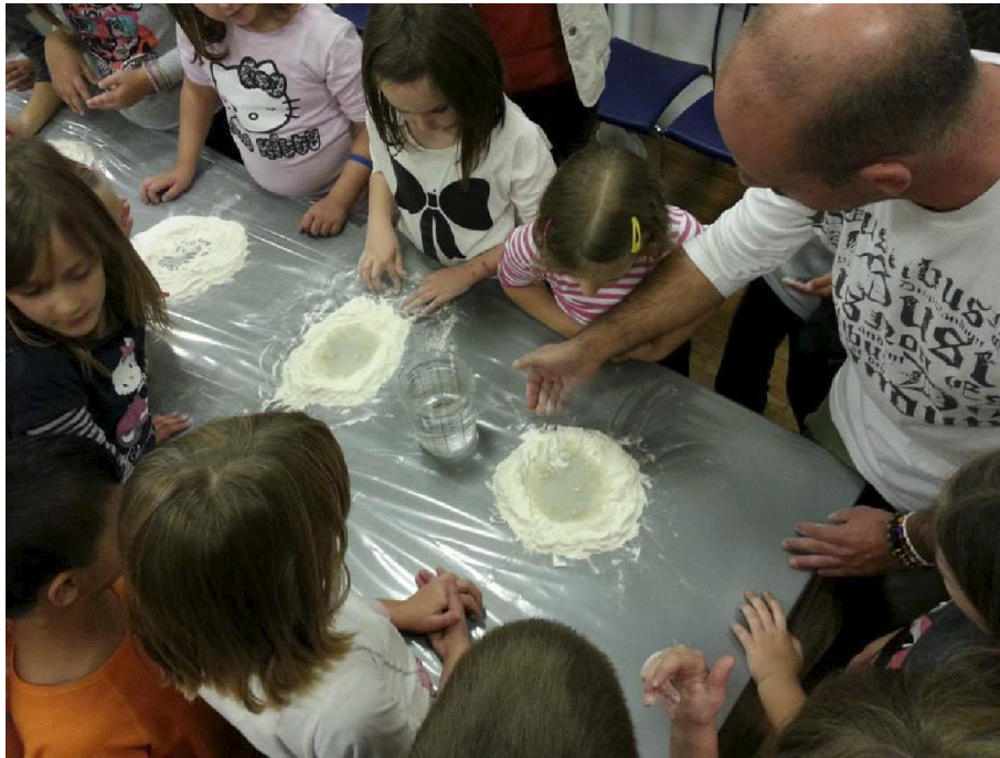
Edukativna akcija Dani kruha