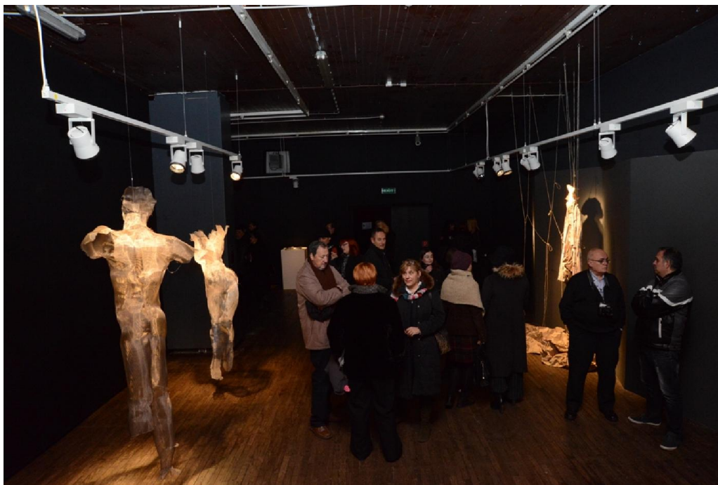
Otvorenje izložbe Potpis