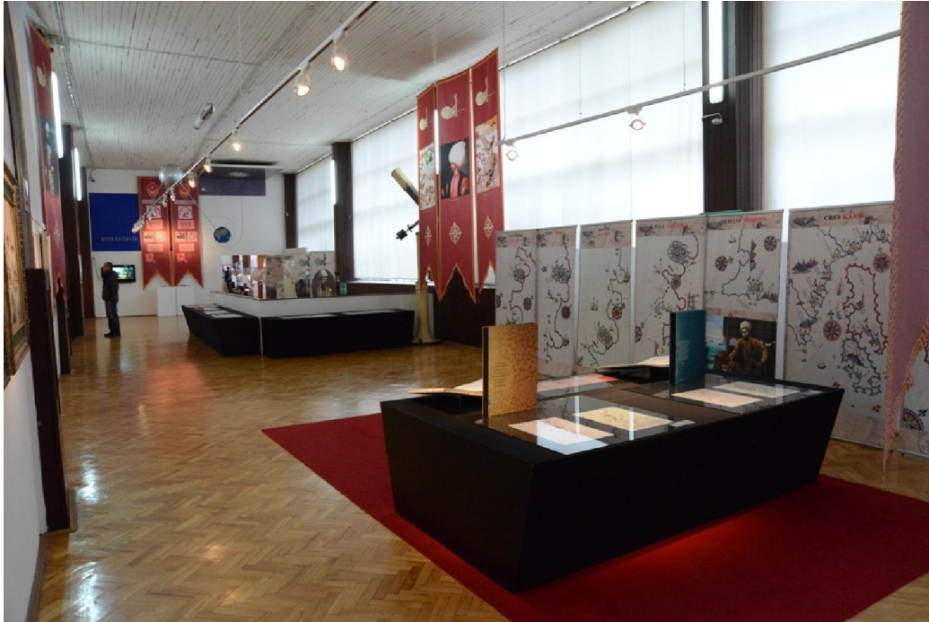
Izložba Piri Reis - kartograf Sulejmana Veličanstvenog