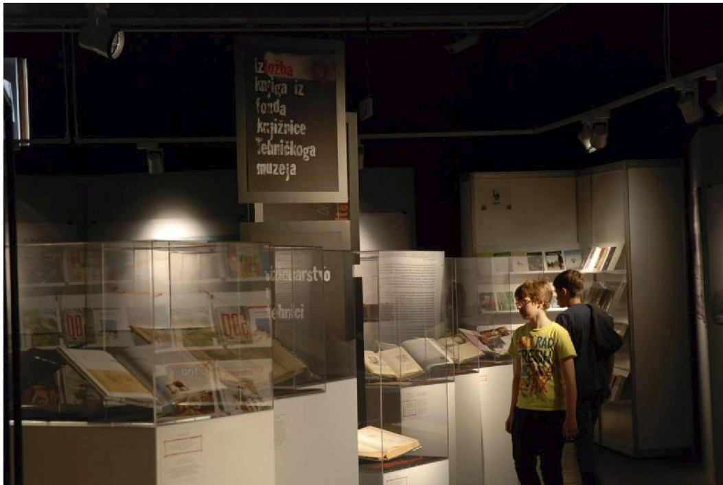
Izložba Vizionarstvo u tehnici - izložba knjiga iz fonda knjižnice Tehničkoga muzeja