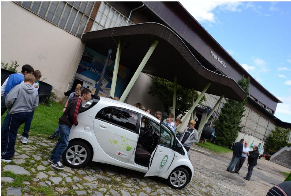
Europski tjedan mobilnosti