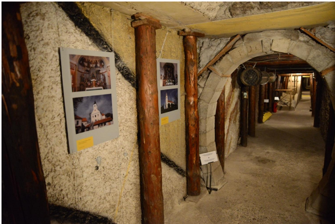
Izložba Pod zaštitom Svete Barbare - 50 godina Rudnika Tehničkog muzeja – Jame Barbare

Opis: Rudnik u Tehničkom muzeju – Jama Barbara iznimno je vrijedan muzejski postav, vjerni prikaz rudarskoga horizonta za eksploataciju ugljena, željezne rude, boksita te ruda olova, cinka i srebra. Rudarska jama ukupne duljine od više od tristo metara, s najvećom dubinom od šest metara, posjetiteljima pruža vjeran i upečatljiv doživljaj pravoga rudnika. Jedna od značajki muzejskog rudnika jest da su u njemu u prirodnoj veličini prikazane sve vrste podgrada koje se upotrebljavaju u rudarstvu, i to u punoj raznolikosti materijala (drvo, metal, opeka, armirani beton itd.) i oblika. Godine 2013. Jama Barbara obilježila je svoj pedeseti rođendan. Radovi na izradi Rudnika počeli su 1961., a 1963. primio je svoje prve posjetitelje.