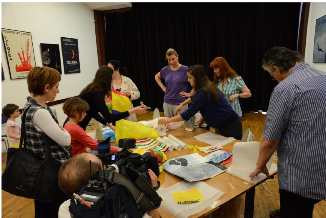
Radionica recikliranja plastičnih vrećica Mašta reciklira svašta ...

Vrećice predstavljaju ozbiljan ekološki problem, čiju štetnost za okoliš najbolje prikazuje podatak da je za prirodnu razgradnju jedne vrećice potrebno mnogo godina, ovisno o uvjetima u kojima se razgrađuje. Kako bismo odbačenim vrećicama udahnuili novi život, na radionici se moglo naučiti kako ih možemo kreativno reciklirati pomoću pegle, igle i konca.