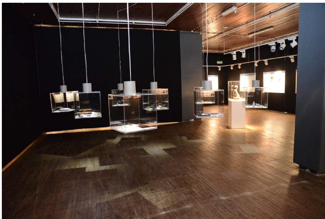
Izložba Atomska bomba - Hirošima i Nagasaki

Opis: Izložba govori o razornim posljedicama atomskih bombi bačenih na Hirošimu i Nagasaki 1945. godine. Izložba je ostvarena u suradnji s Memorijalnim muzejom mira u Hirošimi. Riječ je o putujućoj izložbi edukativnog karaktera čija je misija pronosjenje poruke mira i zagovor za uništenje nuklearnog naoružanja. Budući da su posljedice pada atomske bombe na gradove Hirošimu i Nagasaki i razmjeri razaranja bili strahoviti, izložba putem fotografija, teksta, grafikona i statističkih podataka, te predmeta iz svakodnevnog života iz te 1945. godine, odnosno trenutka eksplozije, sugestivno progovara o tome da se takvo što više nikada ne smije ponoviti. Fotografije prikazuju gradove Hirošimu i Nagasaki te njihove stanovnike nakon pada atomske bombe, opise bolesti i tegoba koje je atomska bomba uzrokovala, potresne crteže preživjelih, karte svijeta s podacima koje zemlje posjeduju nuklearno oružje, koje zemlje još uvijek vrše nuklearne pokuse, potresne osobne priče, prikaze gradova Hirošime i Nagasakija danas te opis borbe međunarodne inicijative „Gradonačelnici za mir“ za potpunim nuklearnim razoružanjem. Dvadeset predmeta iz svakodnevnog života iz 1945. g. (odjeća, obuća, osobni predmeti i dr.) popraćeno je tekstualnim pričama - iskazima vezanim za žrtve eksplozije.