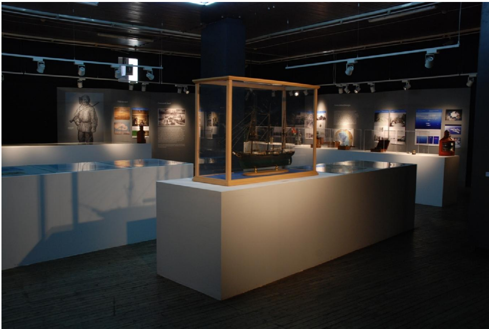
Izložba Hrvati u ledenom zagrljaju Arktika

Opis: Izložba je posvećena arktičkoj ekspediciji brodom „Admiral Tegetthoff“ (1872. - 1874.), kao i 140. obljetnici otkrića Zemlje Franje Josipa.