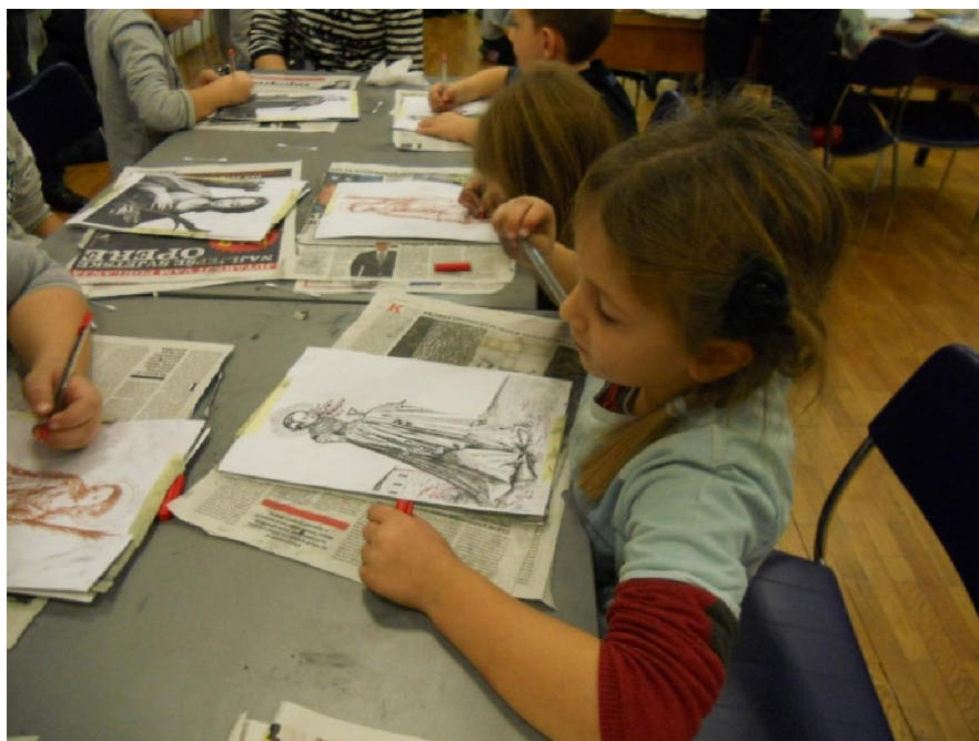
Radionice u sklopu izložbe Pod zaštitom Svete Barbare - 50 godina Rudnika Tehničkog muzeja – Jame Barbare

Prve dvije radionice bile su posvećene izradi lika rudarske zaštitnice Sv. Barbare na temelju umjetničkih prikaza kroz povijest, a na trećoj radionici polaznici (školskog uzrasta) izrađivali su rudarske podgrade od papira te potom ispitivali njihovu čvrstoću i nosivost.