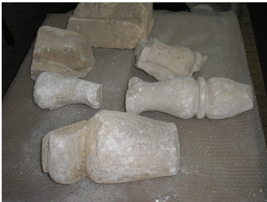
Slika 18. Čišćenje i zaštita kamenih dijelova balustrada