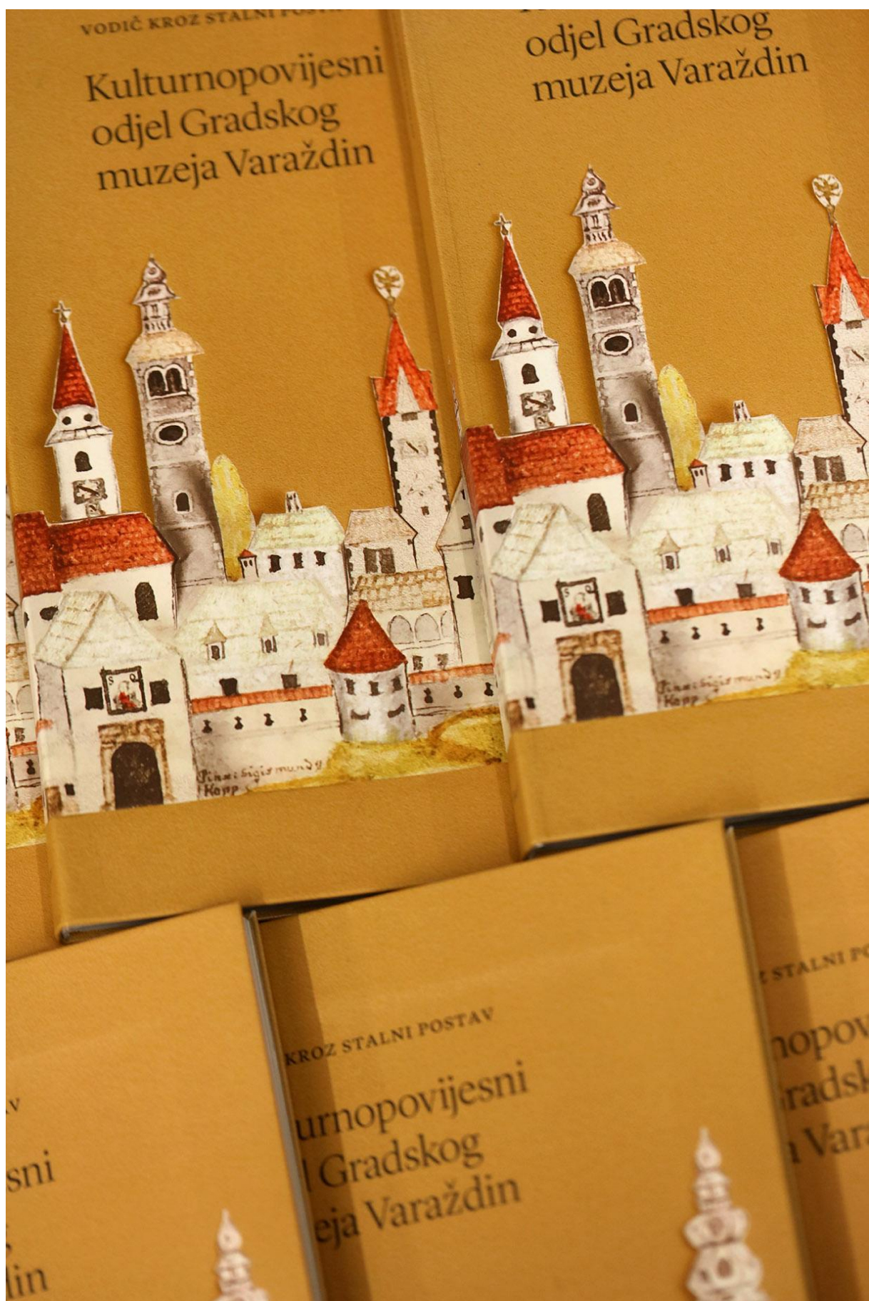
Slika 11. Vodič stalnim postavom Kulturnopovijesnog odjela objavljen u nakladi GMV-a