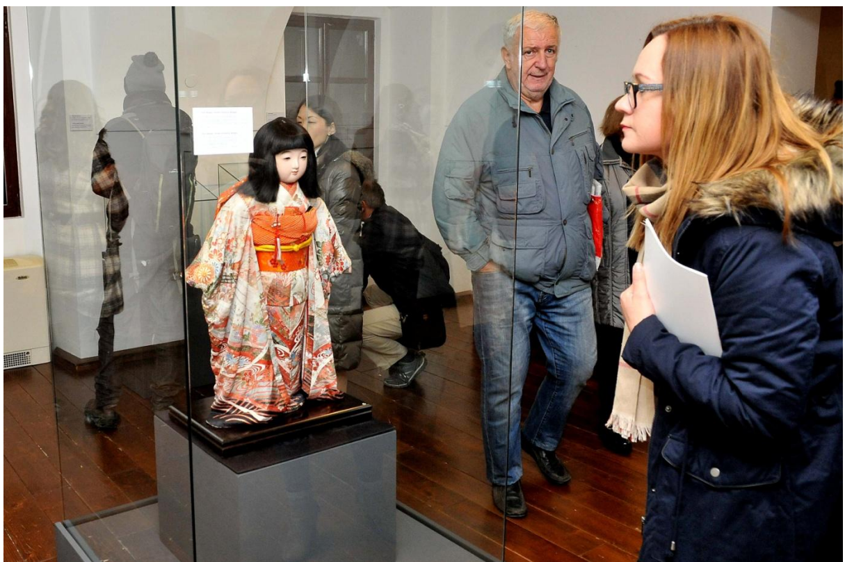
Slika 6. Izložba Lutke Japana , u suradnji s Japanskim veleposlanstvom u RH i Japan Foundationom