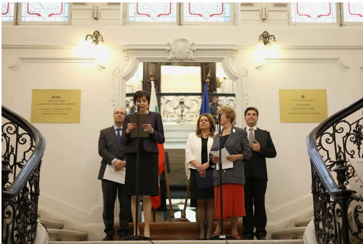
Slika 3. Otvorenje izložbe Veliki hrvatski majstori 20. i 21. stoljeća , iz fundusa GMV-a, Nacionalna galerija u Sofiji