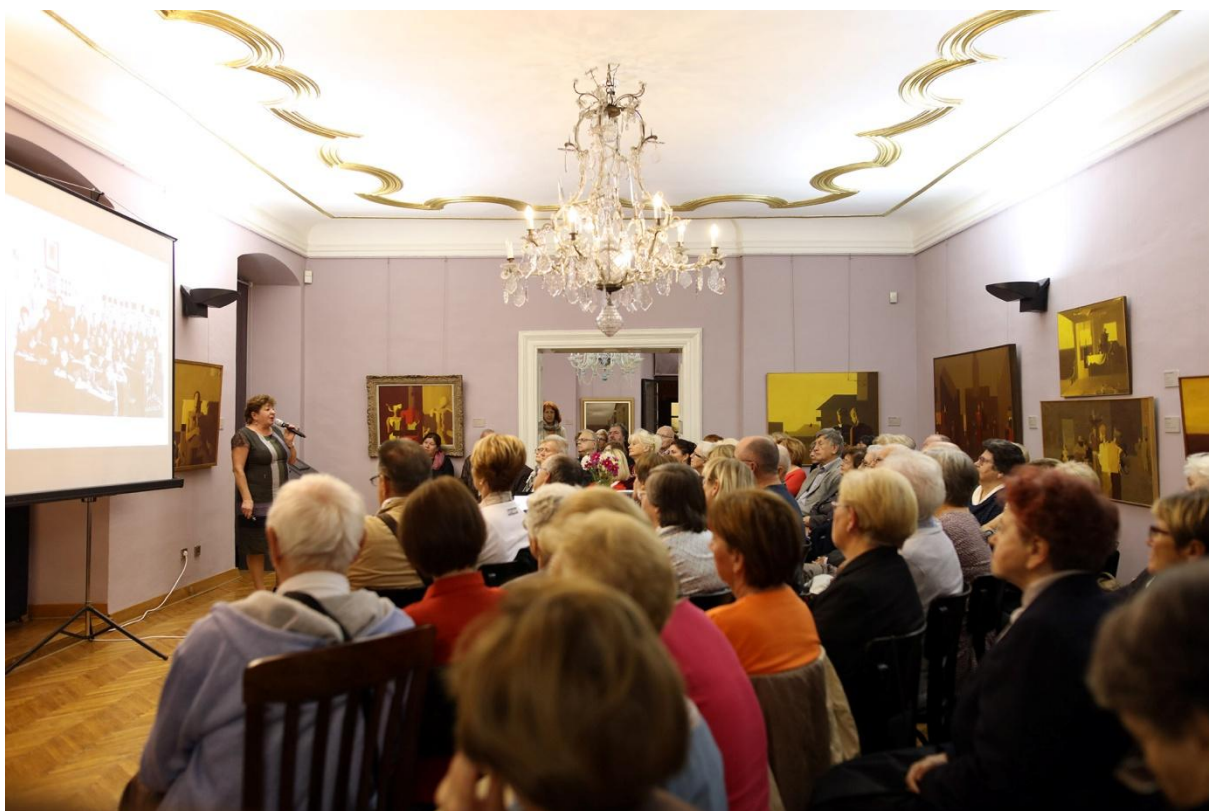
Slika 7. Predavanje uz izložbu Hommage á Miljenko Stančić