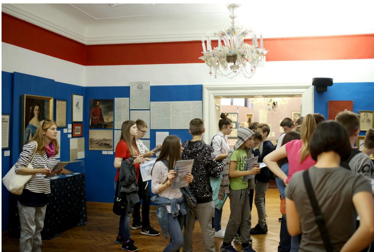
Slika 10. Jedna od edukacijskih radionica za učenike u sklopu programa MIS – Muzej i škola