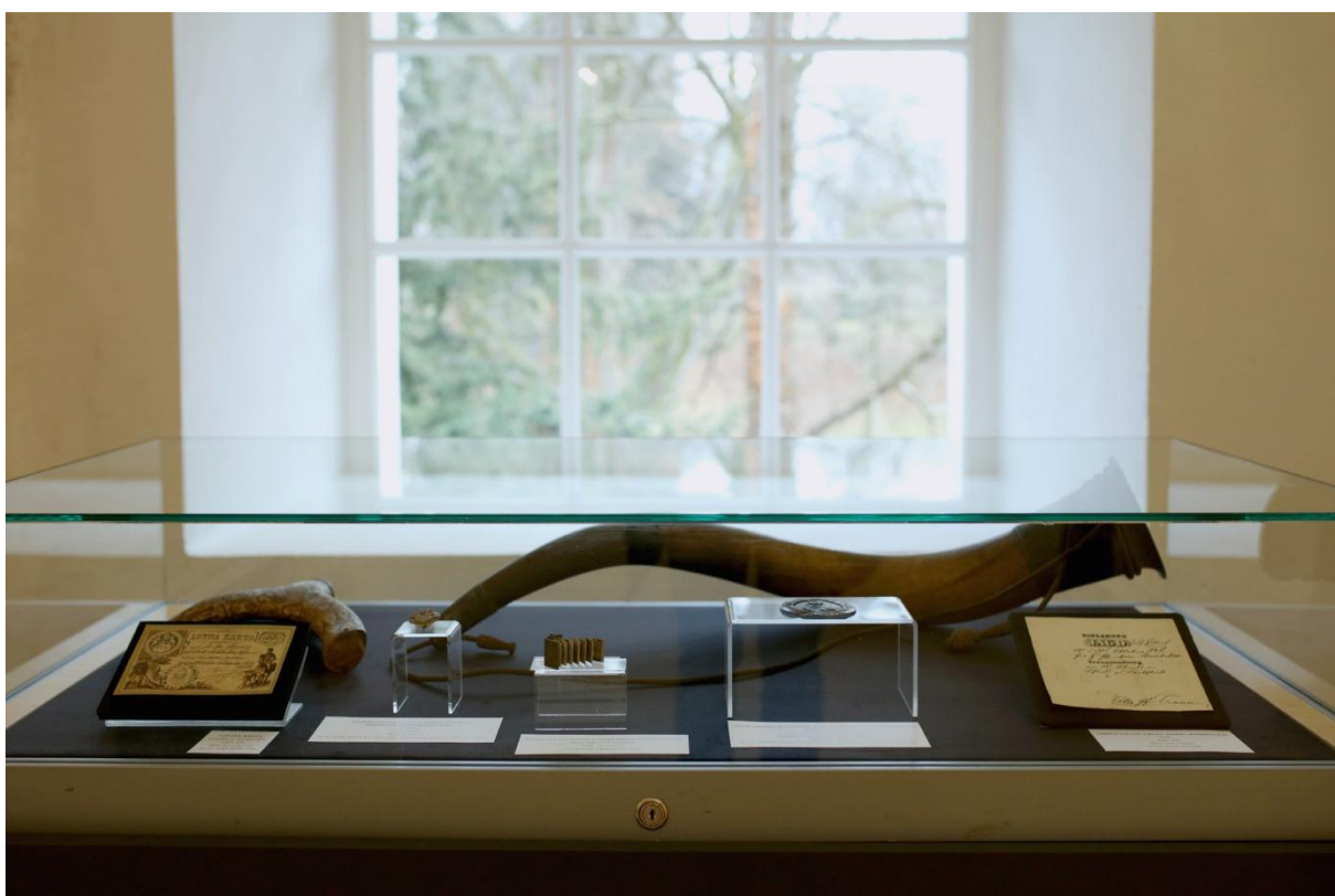
Slika 8. Izložba Lov i plemstvo na varaždinskom području , gostovanje GMV-a u Pokrajinskom muzeju Ptuj-Ormož