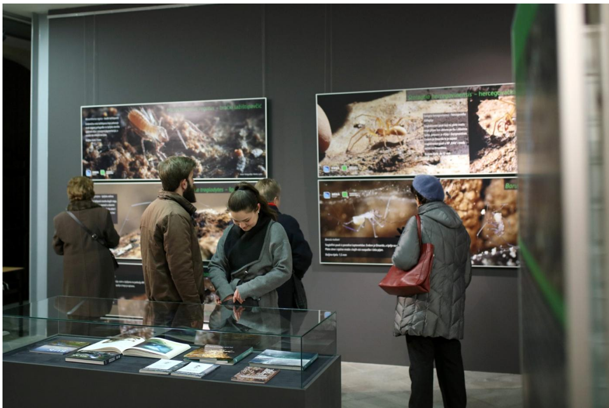
Slika 5. Izložba Podzemna fauna NP Krka