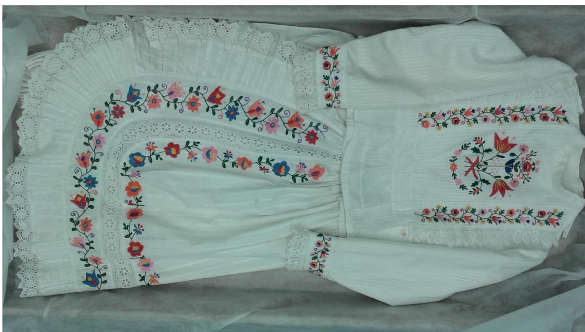
Slika 14. Narodna nošnja Vidovec GMV E 354, a) prije restauratorskog postupka, b) nakon restauratorskog postupka