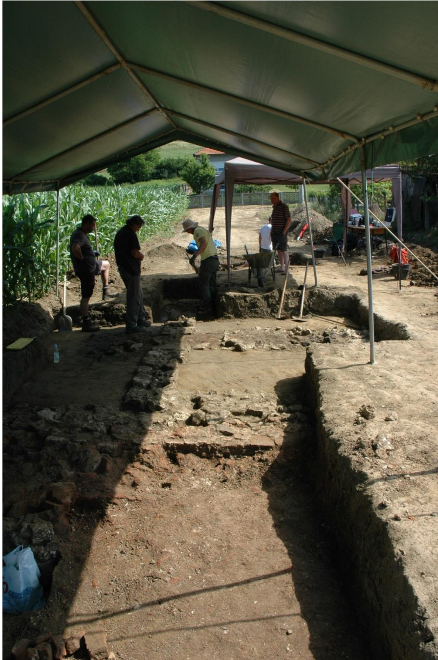
Slika 2. Probno arheološko istraživanje na antičkom lokalitetu Beletinec-Crkvišće