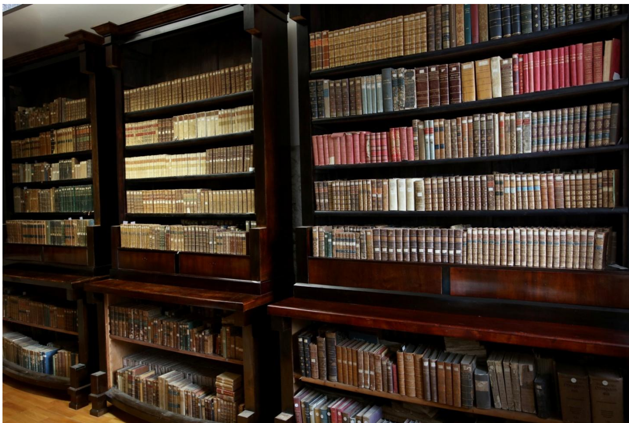
Slika 17. Dio obrađene knjižne građe iz fondusa GMV-a u sklopu EU projekta DETOX