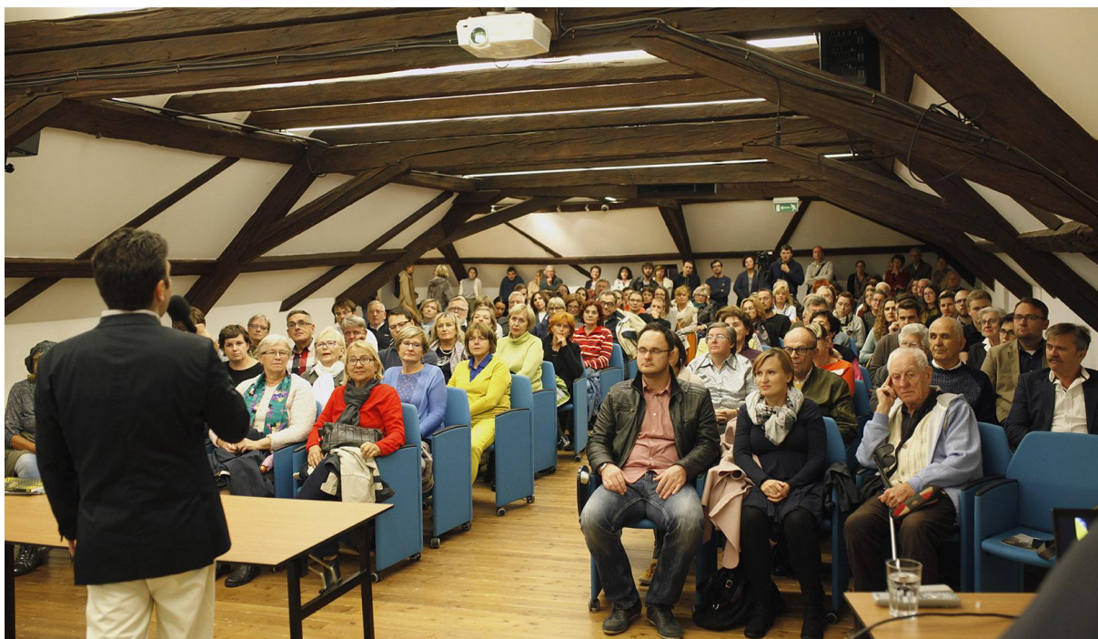
Slika 9. Jedna od 35 održanih Srijeda u Muzeju