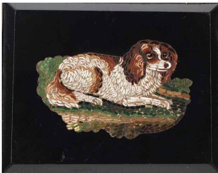
Slika 15. Broš GMV KPO 2108, a) zatečeno stanje, b) stanje tijekom konzervatorsko-restauratorskog postupka, c) stanje nakon konzervatorsko-restauratorskog postupka