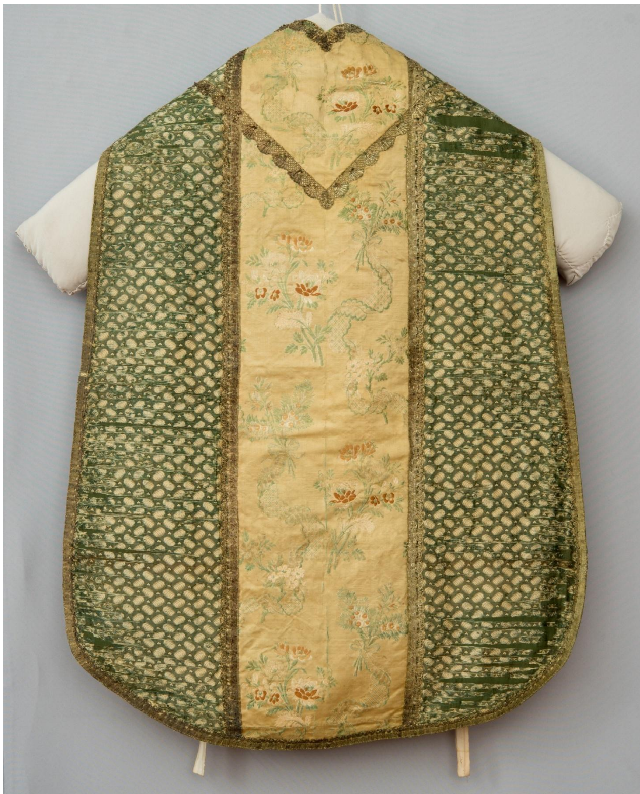
Slika 16. Kazula i velum GMV KPO 1418, GMV KPO 1418/1, restaurirano na Odjelu za tekstil, kožu i papir HRZ-a