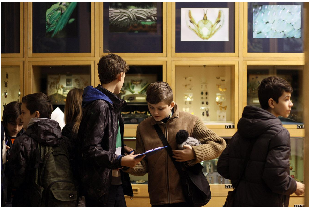
Slika 19. Stalni postav Entomološkog odjela Svijet kukaca , najposjećeniji program školskih grupa