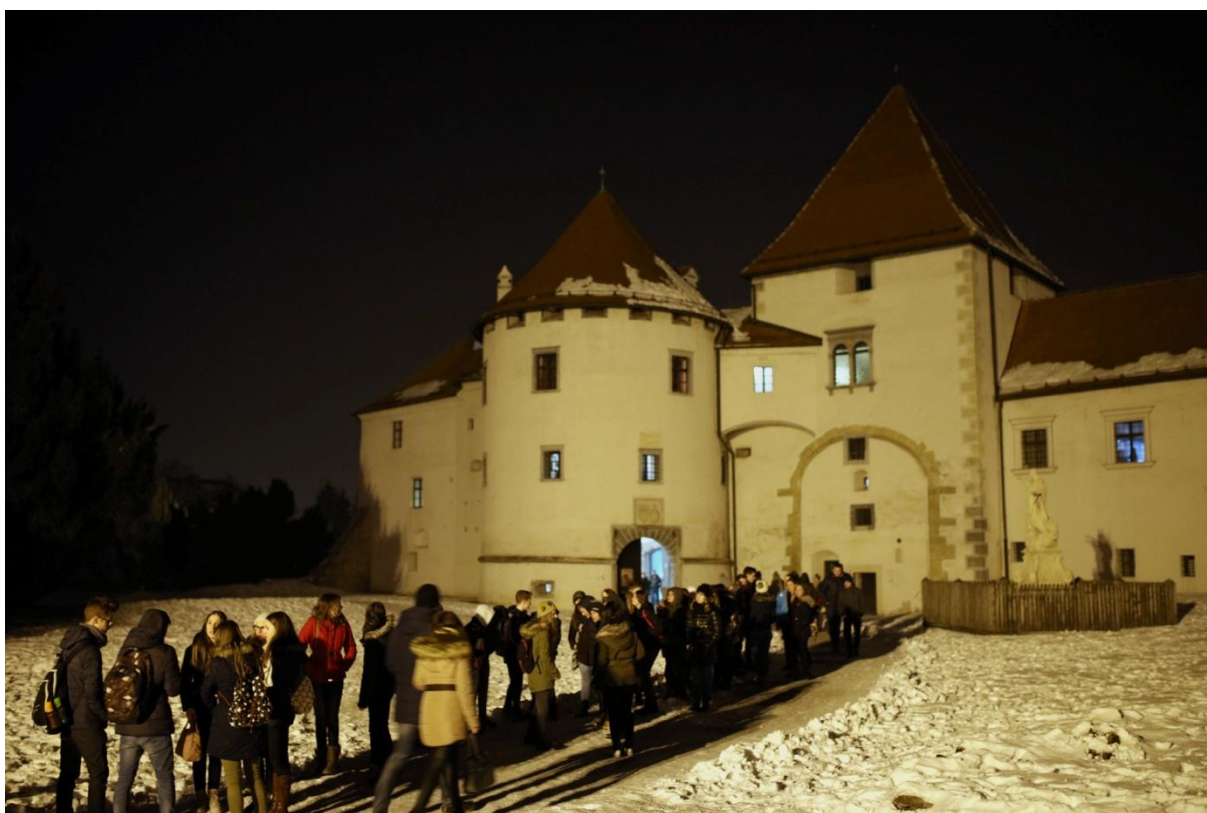
Slika 20. Izložbene postave GMV-a u Noći muzeja razgledalo je 4740 posjetitelja