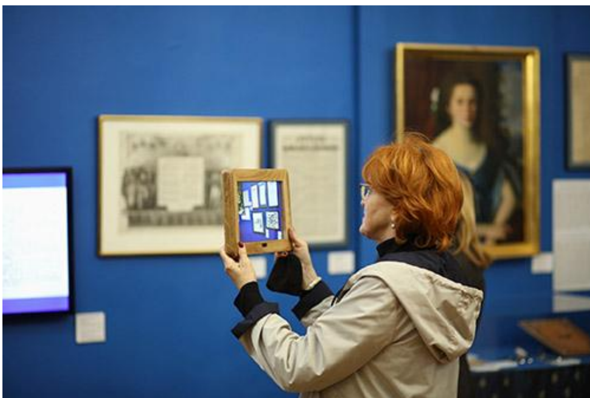
Slika 4. Primjena multimedije na izložbi Ivan Kukuljević Sakcinski – začetnik hrvatskog identiteta