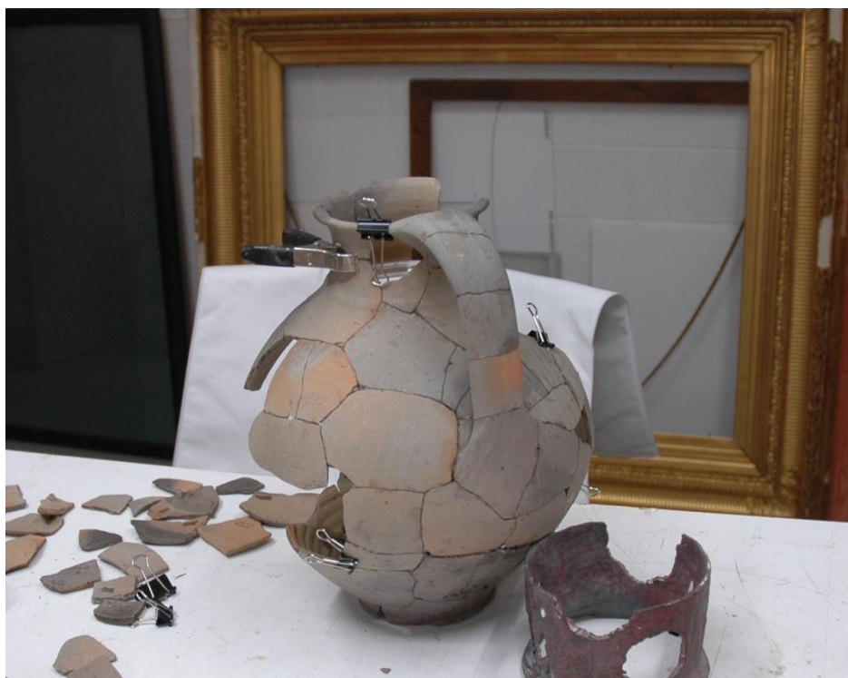
Slika 1. Antički vrč s lokaliteta Humščak u procesu restauracije GMV 89451