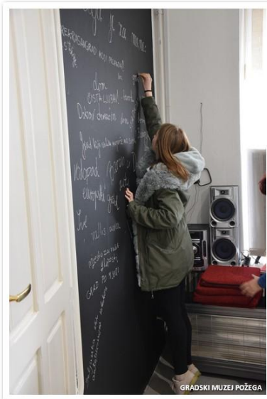
Slike 33., 34., 35. i 36. Radionica „790 godina-Požega u oku“