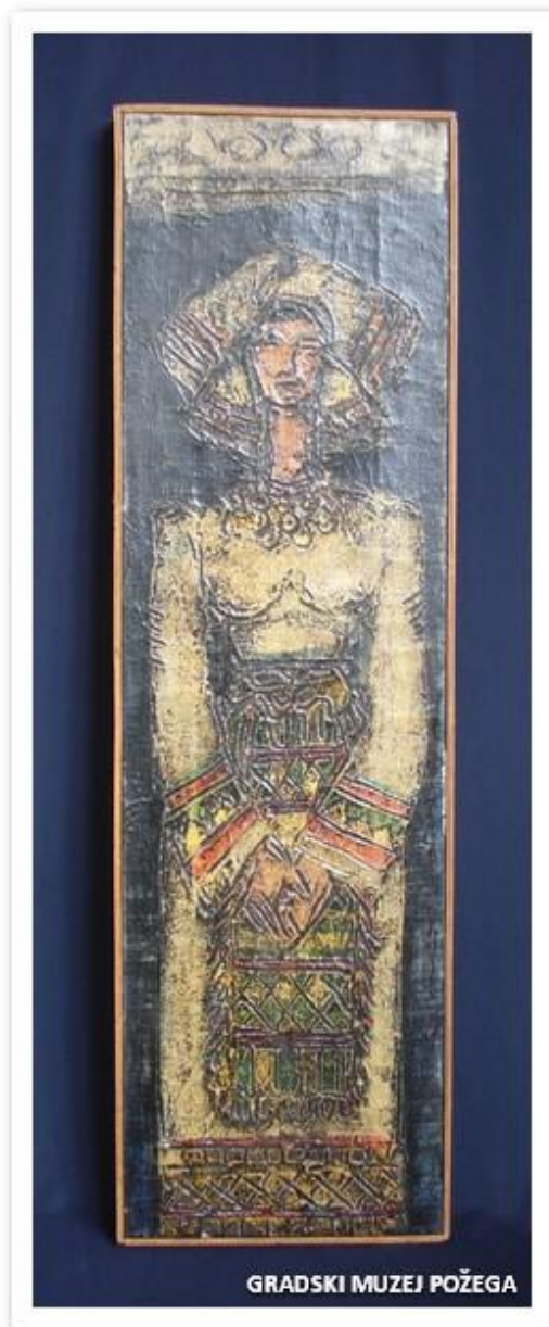
Slika 1. Žena u narodnoj nošnji, Jozo Janda, ulje, drvo, 70.g.20.st.