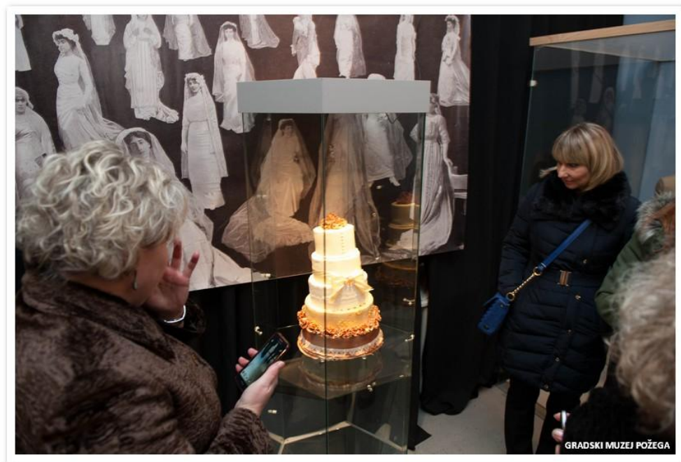
Slike 3.,4, i 5. Izložba „U dobru i zlu“