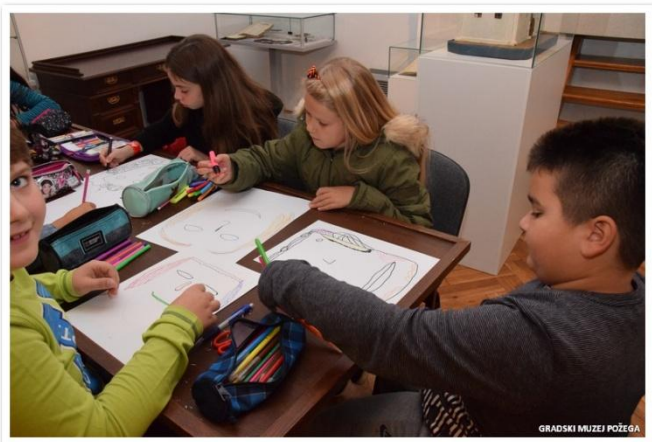
Slike 31. i 32. Radionica „Bertuch“