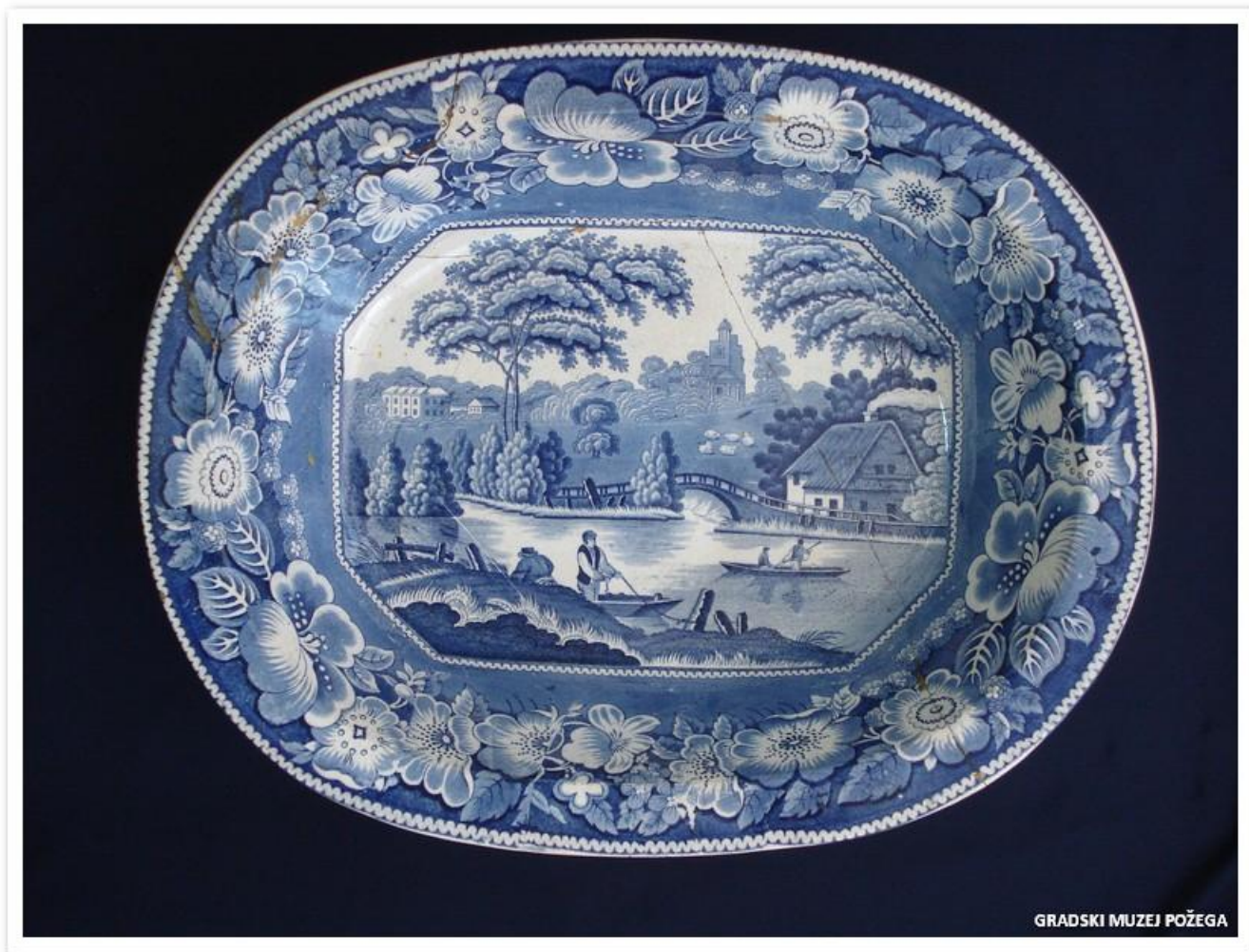
Slika 2. Plava keramika, Strafford, oko 1840.g. - dar iz obiteljske ostavštine