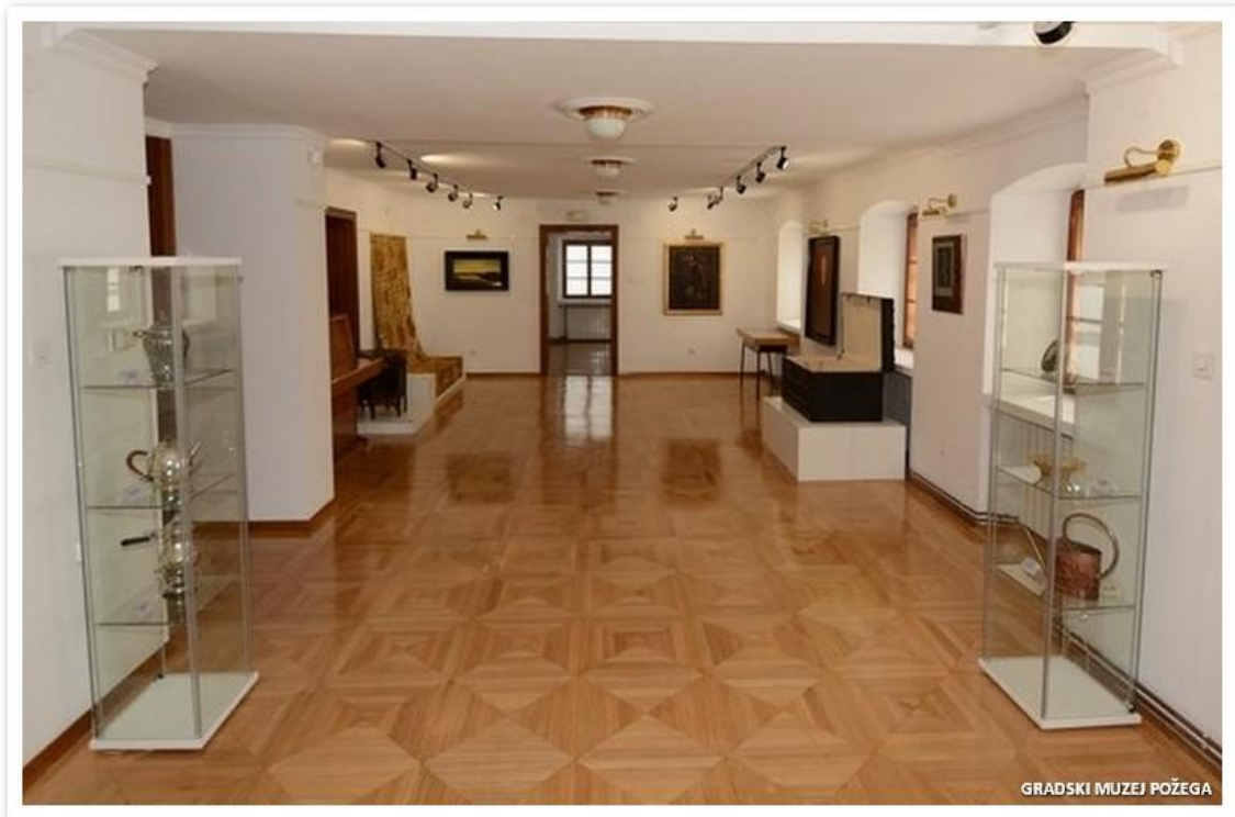
Slika 19. Izložba „Milka Trnina - muzejski predmeti kao memorija“