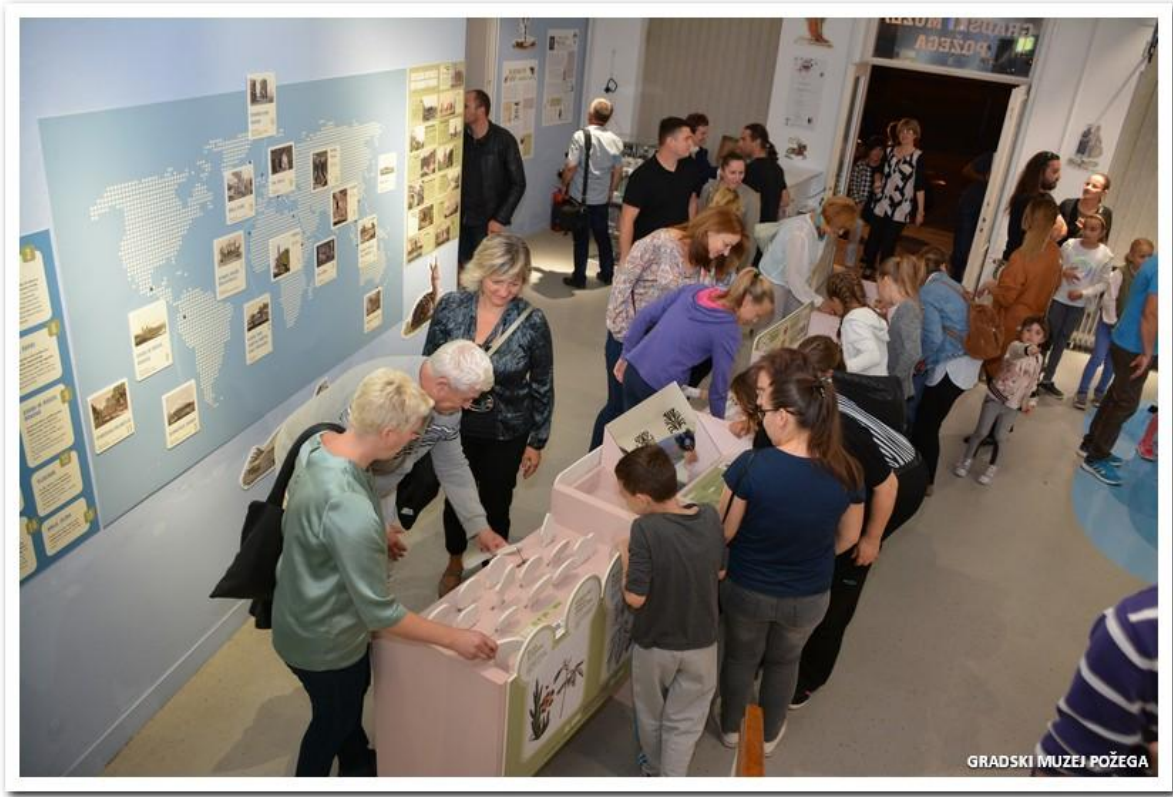
Slike 14.,15., 16., 17. i 18. Izložba „Bertuch“