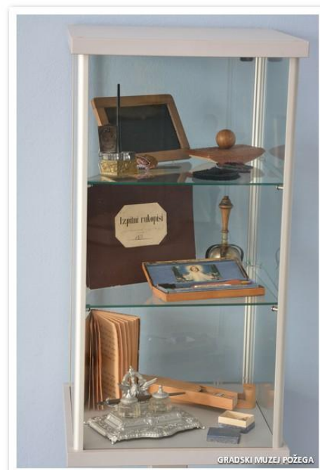
Slike 10.,11., 12., i 13. Izložba „Zvoooni!!!“