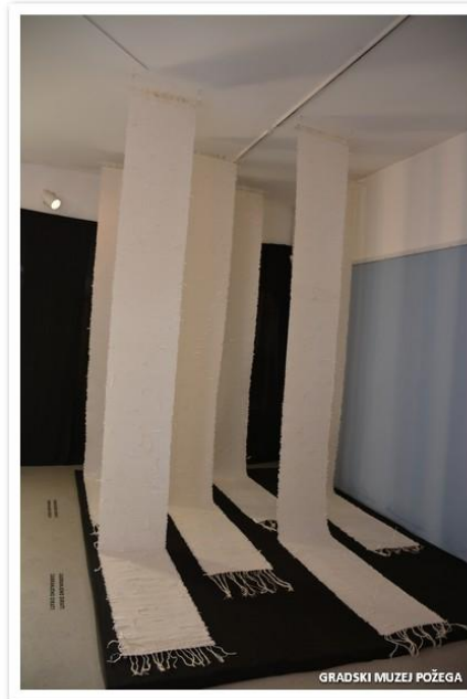
Slike 6.,7., 8., i 9. Izložba „Granice vidljivosti“