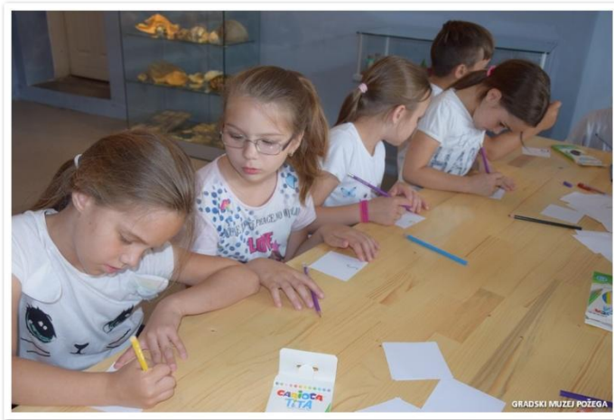
Slike 26., 27., 28., 29. i 30. Radionica „Zvoooni!!!“