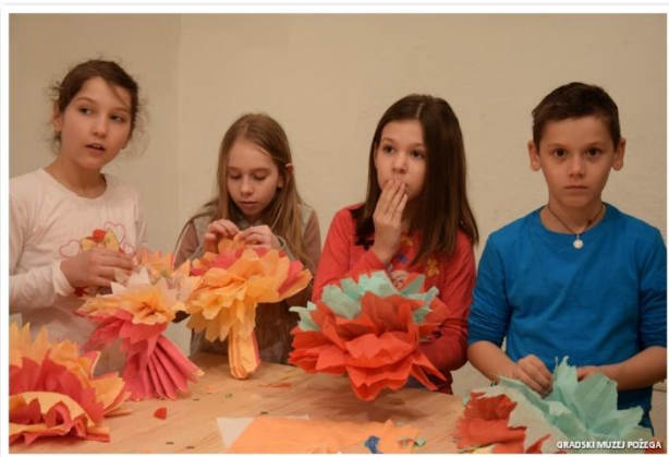
Slike 20., 21., 22. i 23. Radionica „U dobru i zlu“