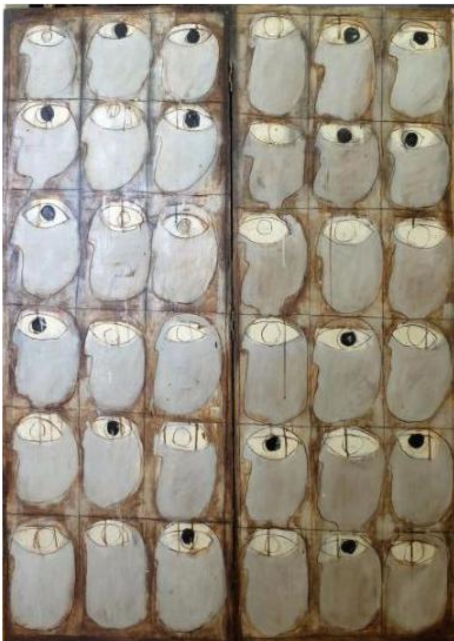
Slika 1. Slavko Kopač, PARAVAN S DVA KAPKA, 1965. ulje, vinil/šperploča; 161x60 cm; MG-8143