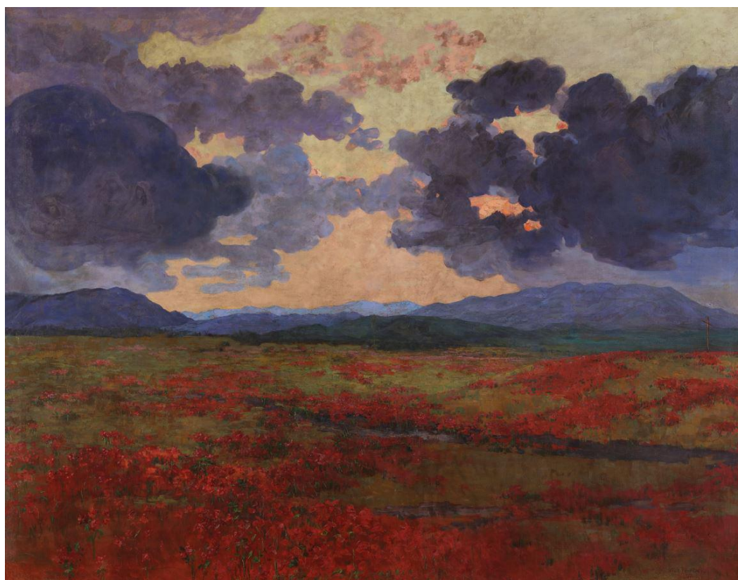
Slika 6. Slika Otona Ivekovića PEJZAŽ S MAKOVIMA, 1923., ulje/platno; 150x200 cm; MG-6784 nakon restauracije