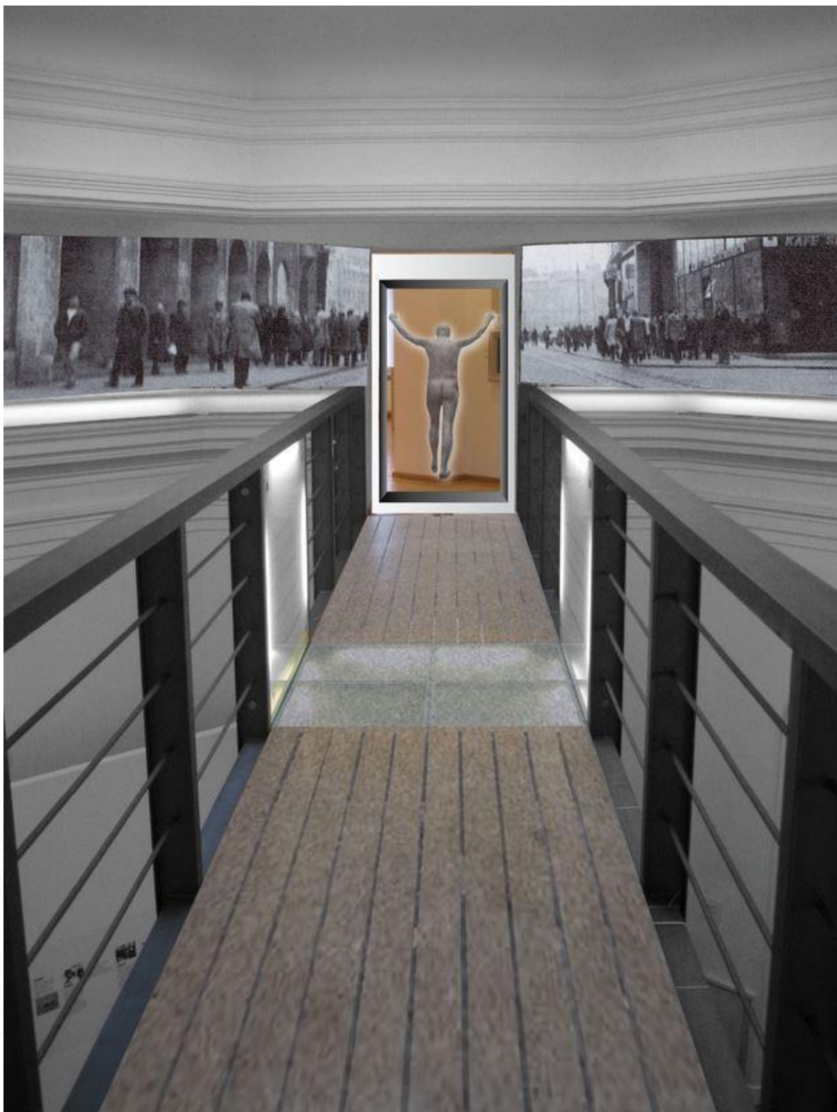
Slika 7. Ikonografija grada 2. – skica iz projekta postava izložbe, poglavlje RITAM ULICE s hologramom performansa Tomislava Gotovca „Zagreb, volim te“