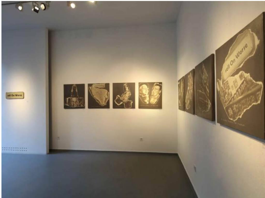
Slika 9. S postava izložbe Orsonov putokaz Željka Kipkea u Studiju MG „Josip Račić“