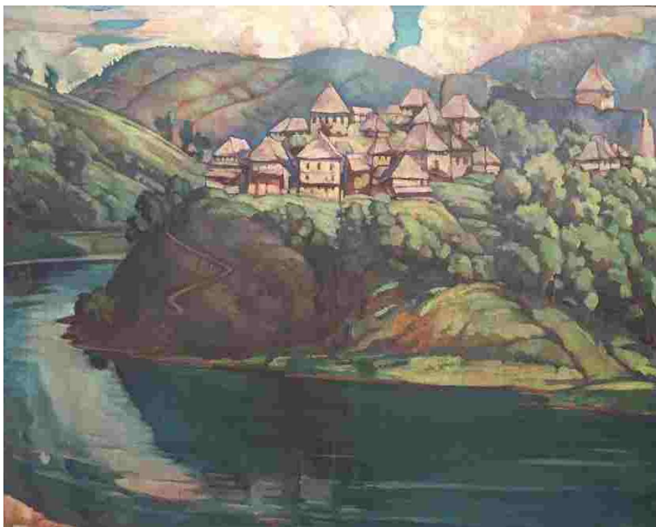
Slika 5. Vilko Šeferov, JAJCE, 1921. – 1925., ulje/platno; 88x109 cm; MG-8123