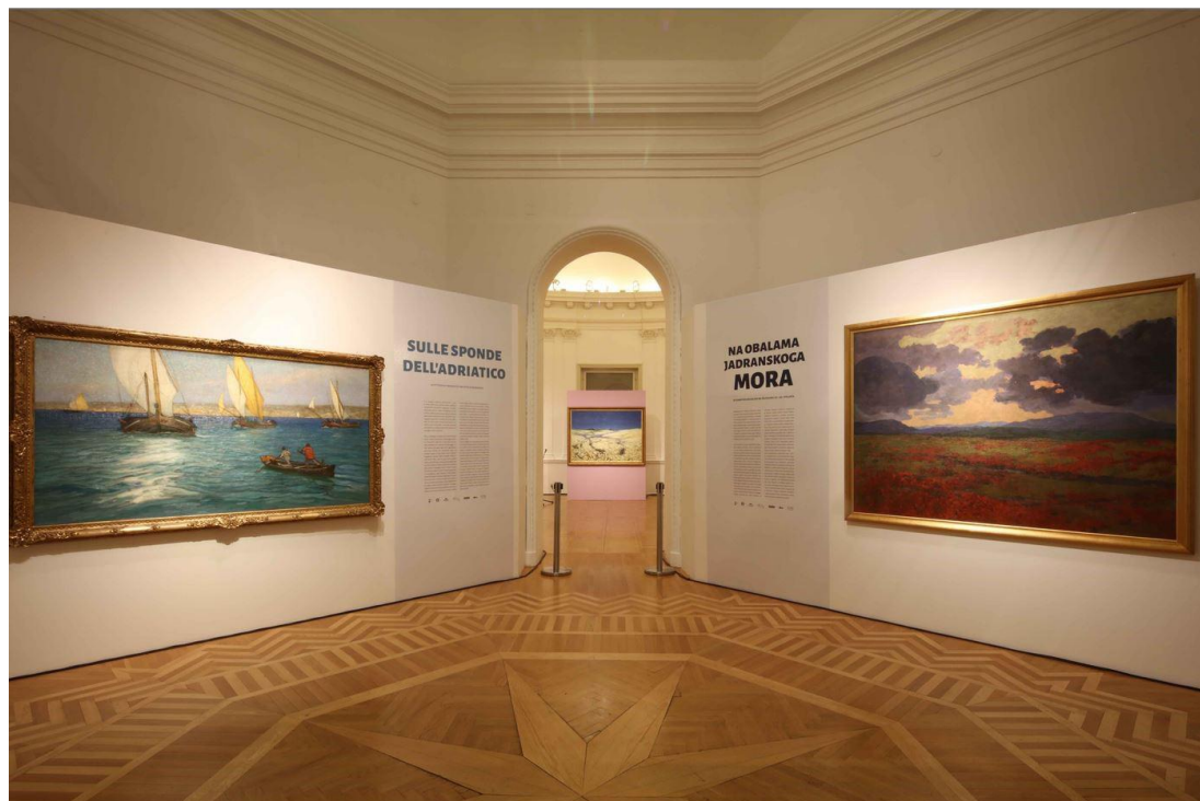
Slika 10. S postava izložbe Na obalama Jadranskoga mora u Modernoj galeriji