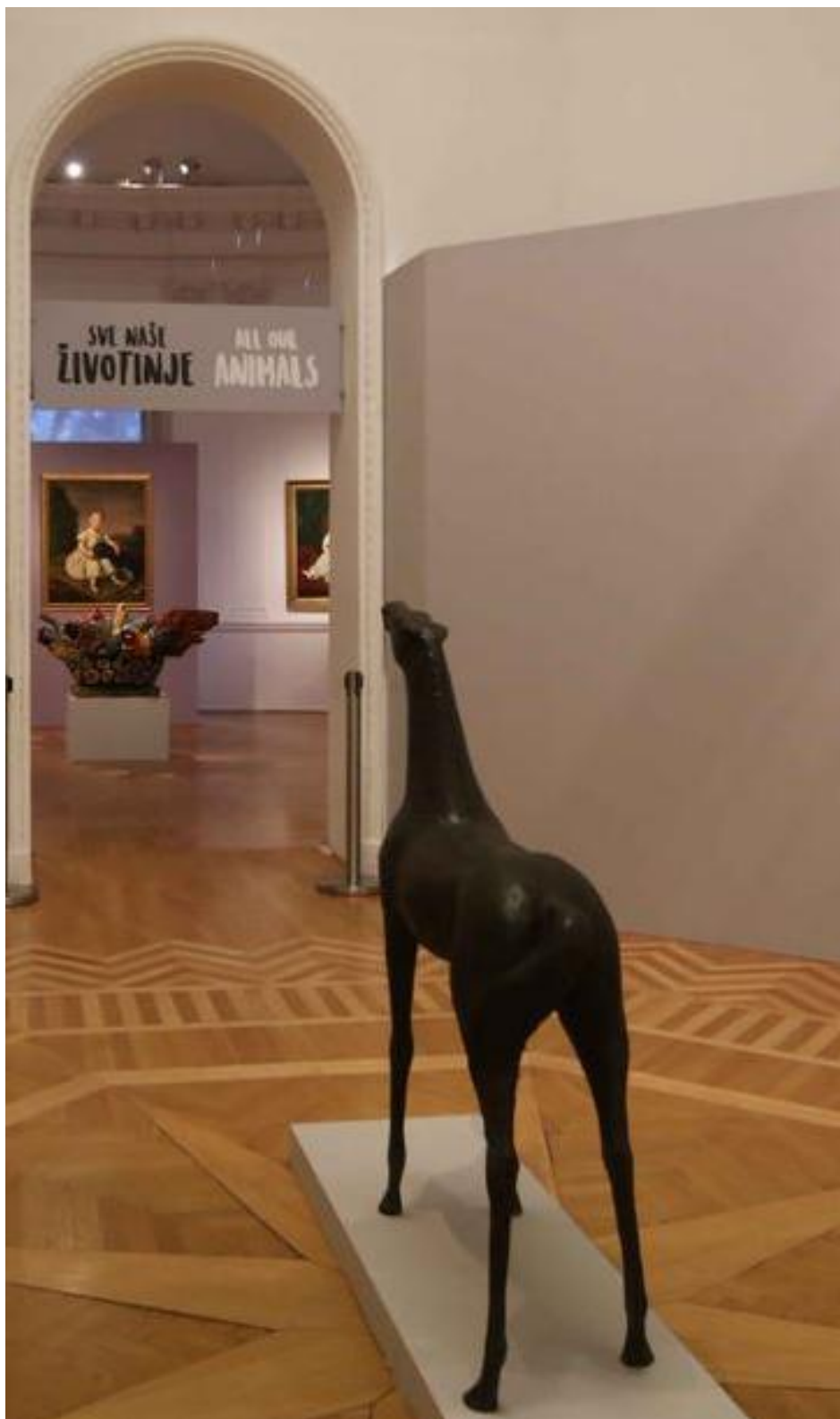
Slika 8. S postava izložbe Sve naše životinje u Modernoj galeriji