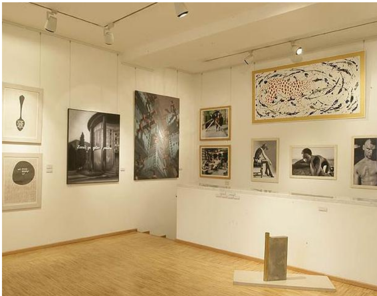
Slika 3. Slika Brace Dimitrijevića, LEOPARD, 1979. – 2004., ulje/platno; 104x216 cm; MG-8146 – u stalnom postavu Moderne galerije (gore desno).