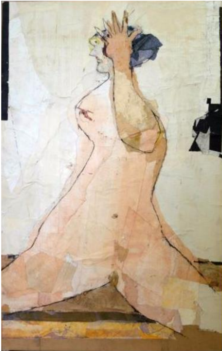
Slika 2. Slavko Kopač, ŽENA KOJA SE ČEŠLJA, 1986. kolaž/platno; 116x73 cm; MG-8144