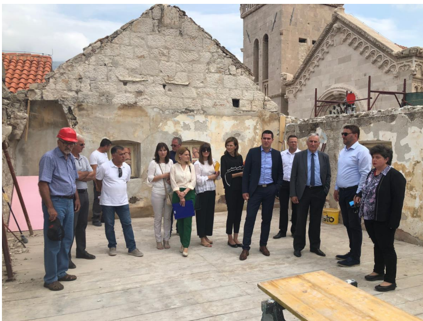
Gradski muzej Korčula, 18. 5. 2018.