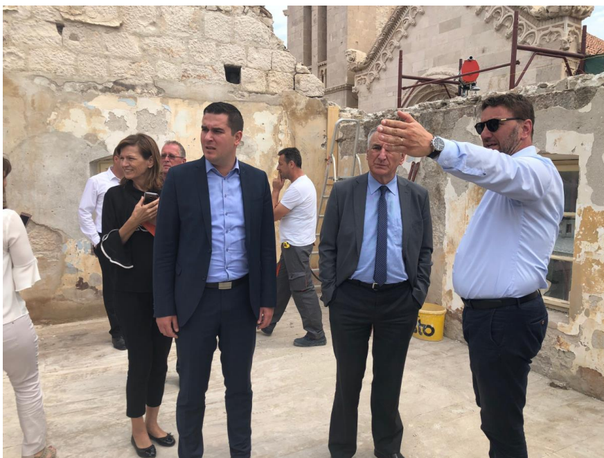
Gradski muzej Korčula, 18. 5. 2018.