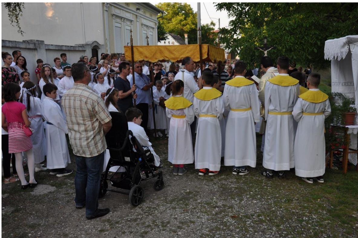
Slika 8. Rokovci, Tijelovo, 2019.