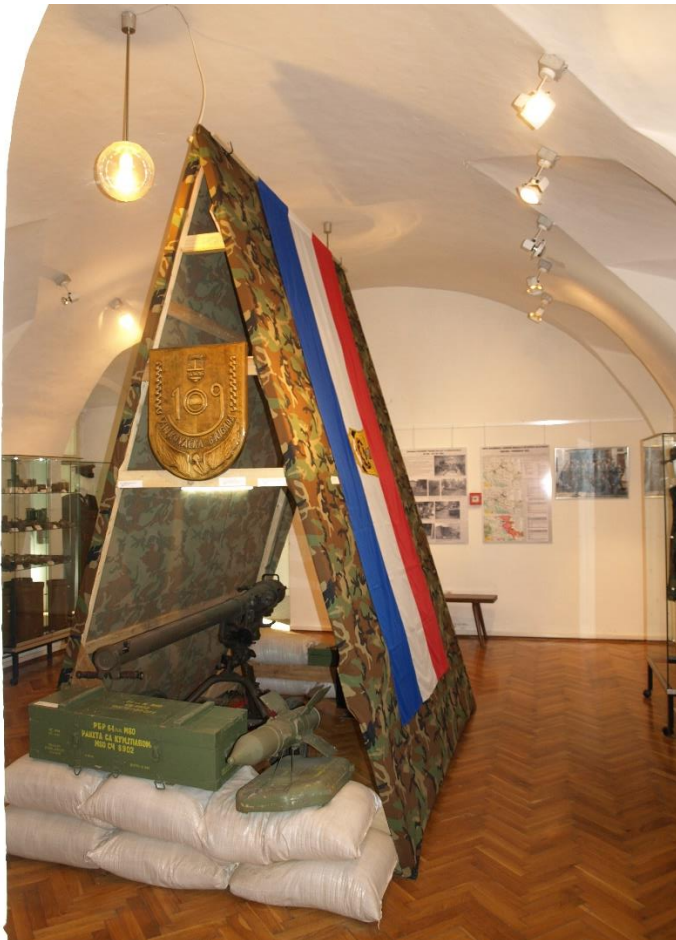
Slika 12. Detalj izložbe Vinkovci i okolica u Domovinskom ratu