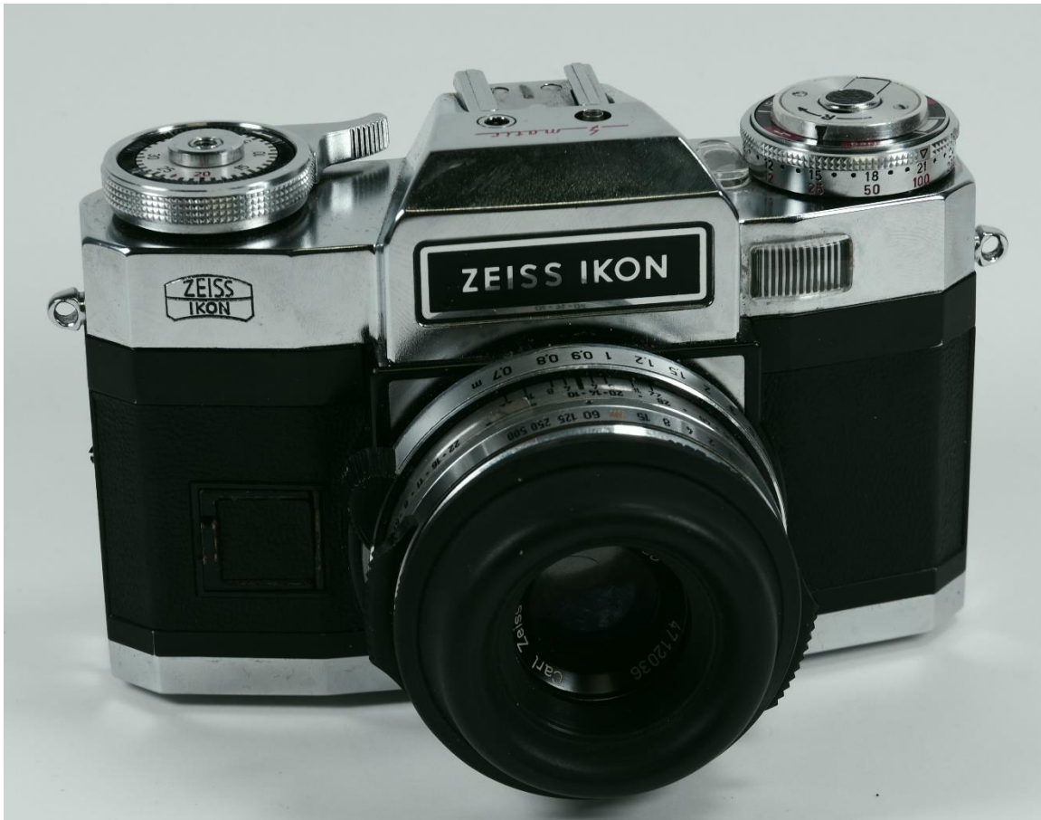
Slika 3. Jedan od darovanih predmeta, P2361b