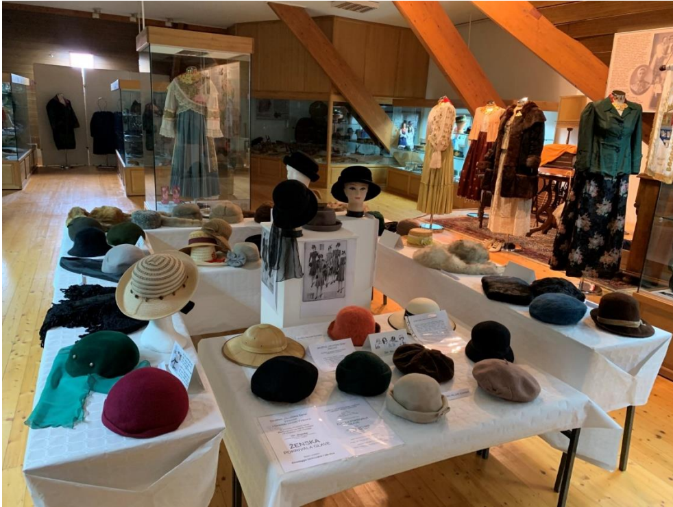
Slika 11. Ženska pokrivala glave 2019.