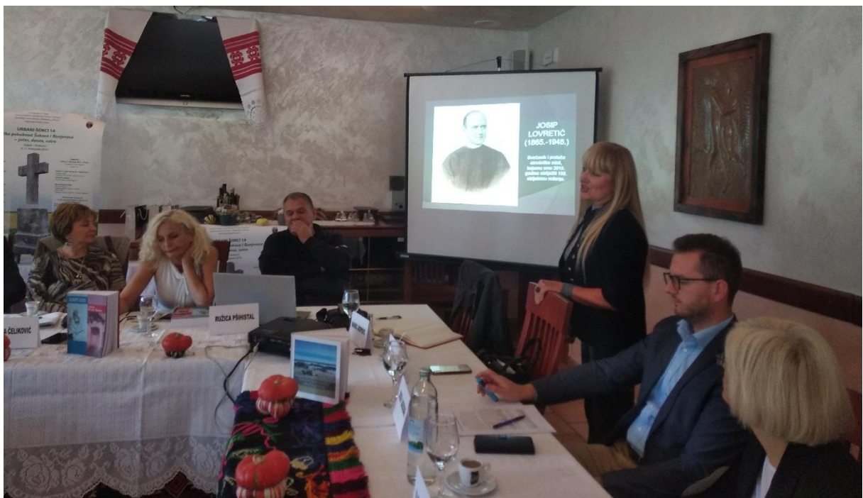
Slika 20. Urbani Šokci 14, 2019.