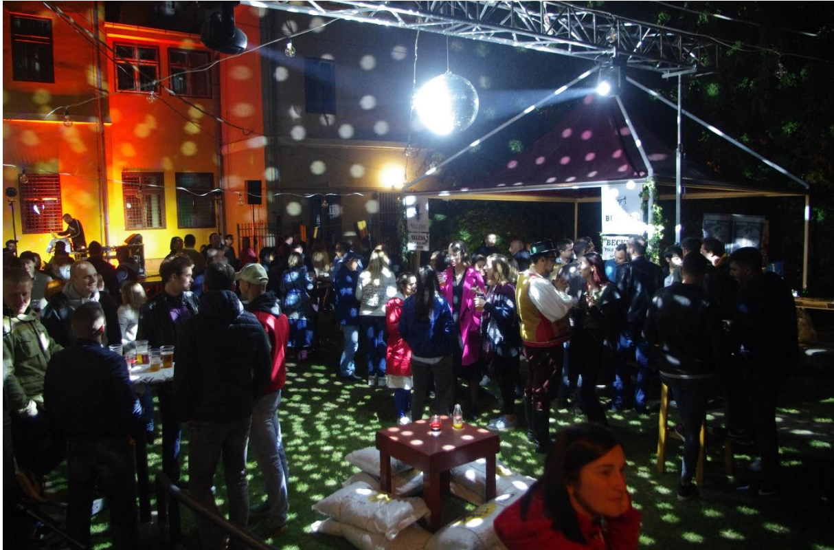
Slika 23. Valensiranje u Lapidariju Gradskog muzeja Vinkovci