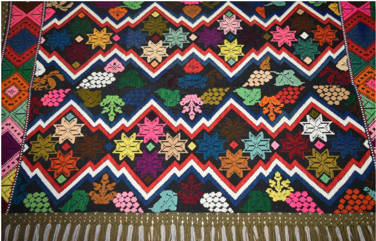
Slika 7. Konzervirano-restaurirani ponjavac, vuneni prekrivač E 1245