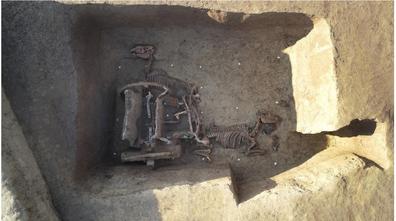
Slika 5. Rimska kola u Jankovcima