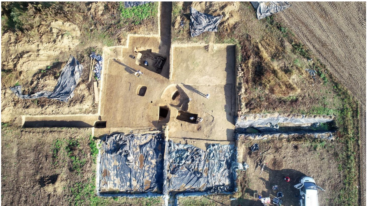
Slika 6. Zračna snimka rimskodobnog tumula u Jankovcima