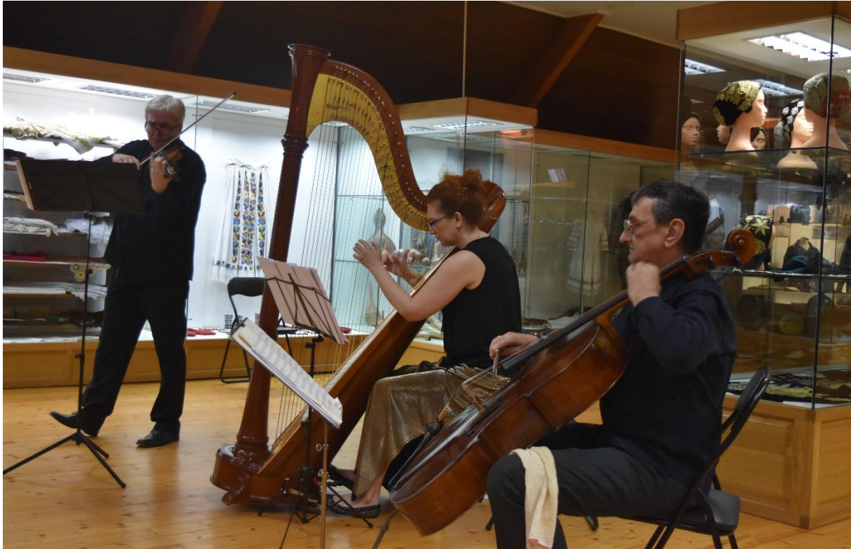
Slika 19. Koncert, CRISOSTOMO, 2019.