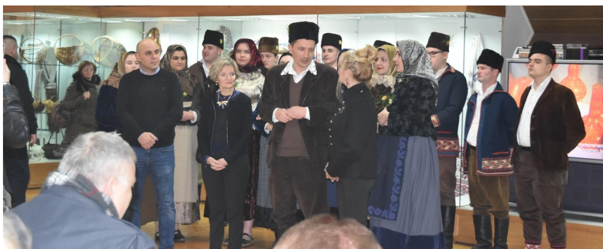
Slika 17. Noć muzeja 2019.