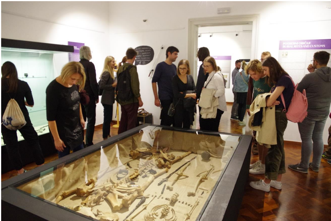
Slika 14. Otvorenje izložbe Avari i Slaveni u Arheološkom muzeju u Zagrebu