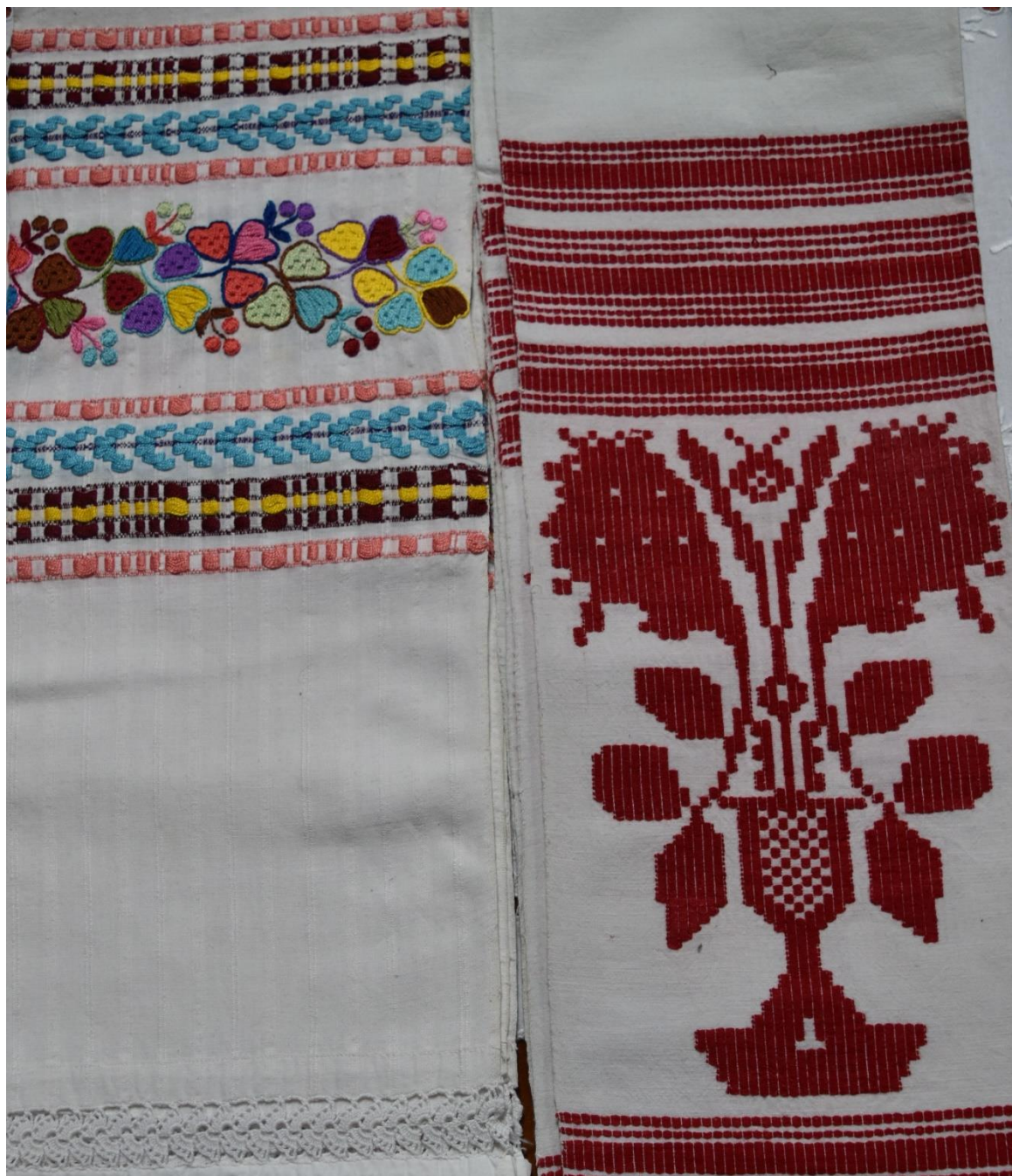
Slika 1. Otarci, darovani ručnici iz Slakovaca, 2019.