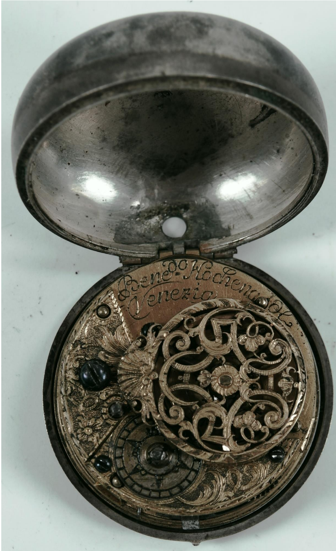
Slika 2. Jedan od novoinventiranih predmeta, P2392h