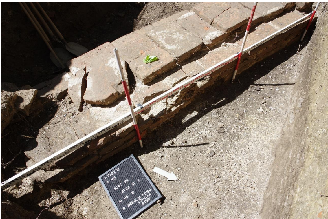
Slika 4. Rimska kanalizacija na Trgu bana Josipa Šokčevića u Vinkovcima