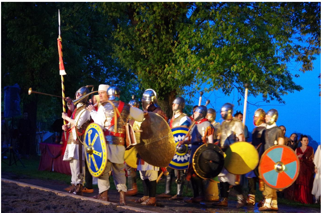
Slika 22. Rimski dani u Vinkovcima