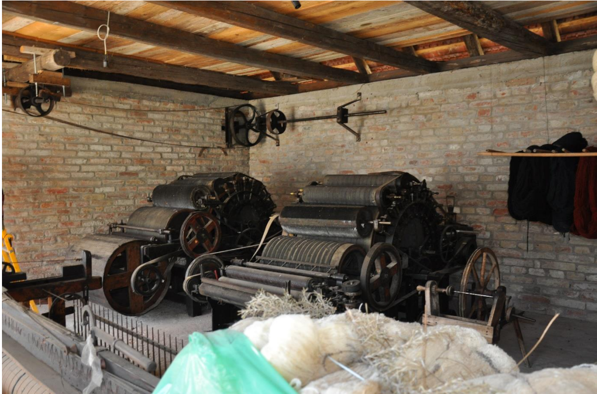
Slika 9. Tenja, Matea i Ivan Getoš, jedini izrađivači rekli... 2019., snimila Lj. Gligorević