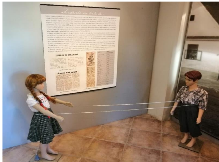
Detalj izložbe Djetinjstvo u Županji 60-ih , 2019.

Korisnici: građani Županje i okolice te svi ostali koje je zainteresirala tema djetinjstva u Županji