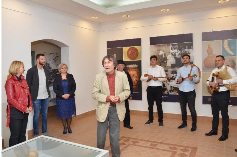
Otvorenje izložbe o šaranim tikvicama u Đakovu, 2019.

Korisnici: Učenici osnovnih i srednjih škola, članovi udruga u kulturi i šire.