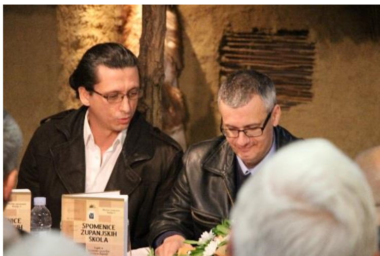
Promocija knjige Spomenice županjskih škola , 2019