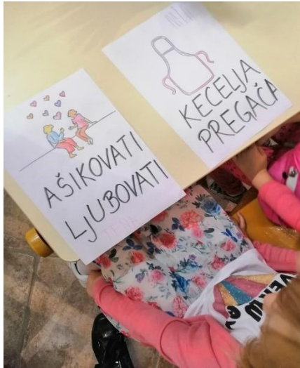
Radionica: Bogatstvo hrvatskog jezika , 2019.

Radionica: Bećarac , 30. listopada 2019. godine