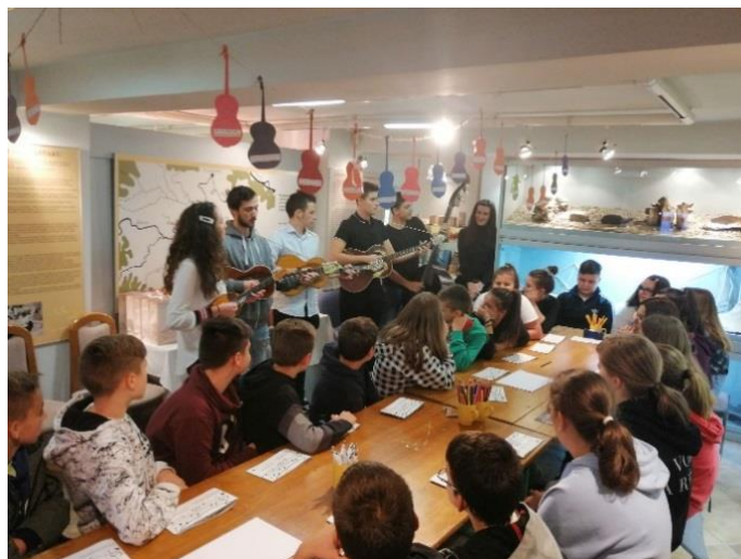
Radionica: Bećarac , Županja

http://www.glas-slavonije.hr/415049/4/Djaci-osmislili-becarce-o-Zupanji?fbclid=IwAR12ynUqiX7CLrtKYtp0NSNv0q75_xr-vyb3AZWpfeA4I64JZ8h2bjp3dTA