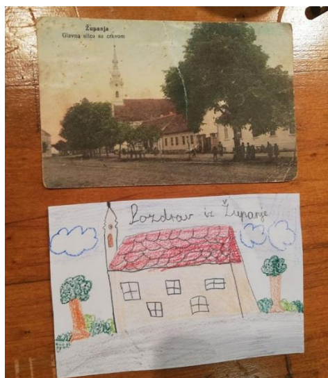
Detalj radova nastalih na radionici Pozdrav iz Županje , 2019.

Kratak opis: Cilj radionice bio je učenicima približiti umjetnost fotografije i razviti dodatnu ljubav i ponos prema gradu u kojem žive. Također, djeca su naučila da skupljanjem razglednica čuvaju svoj kulturno-povijesni identitet mjesta.