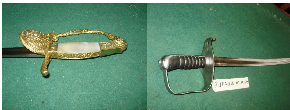
Lijevo, mač državnih činovnika M 1878 (ZMSG Županja); desno, sablja pješackog časnika M 1861 (ZMSG Županja)

U Povijesnom odjelu u 2019. godini restaurirana su dva predmeta; sablja pješackog časnika M1861., i paradni mač državnih činovnika M1878.