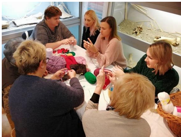
Radionica: Naučimo heklati , Županja

Kratak opis: Na radionici se učila vještina ručnog rada, heklanja i pletenja.