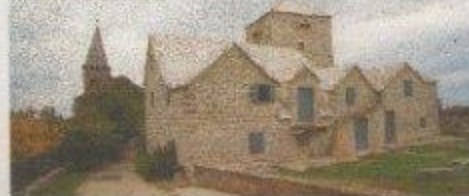
Muzej otoka Brača Škrip i Crkva svete Jelene

Ne bježao to priču ku noć, bježao to u nas on zadivi svoji u širina i antistikinji o njima, širina, strastvenim ljubiti kaplice, medovine Burva i ja, dok na Nviamu škripavac, u njegovoj maloj kuhinji kum Miško i mi Tuopompa i Ate pisco, koji je Avitjek od ilirskih plemena ko om pčelasko odbr svaki dan, da ilirskije bjaše pčim "re da njegov prethod stolju, Agron, "08