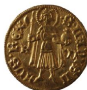
Slika 3. Pozivnica izložba Numizmatička povijest županjske Posavine

Hrvoje Tkalac, Zavičajni muzej Stjepan Gruber Županja i Miroslav Nađ, Arheološki muzej Zagreb