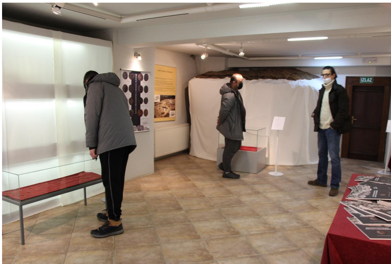
Slika 2. Izložba Numizmatička prošlost Županje