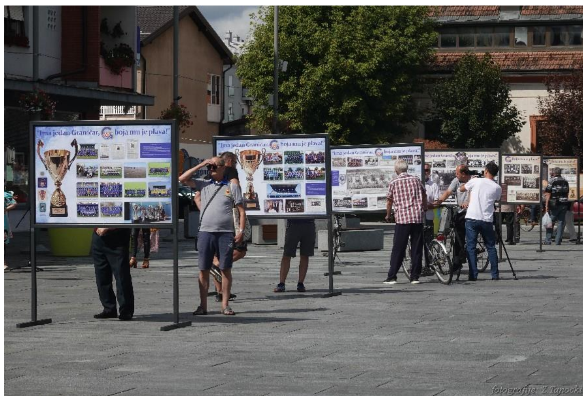
Slika 1. Izložba Ima jedan Graničar, boja mu je plava , Županja kolovoz 2020.