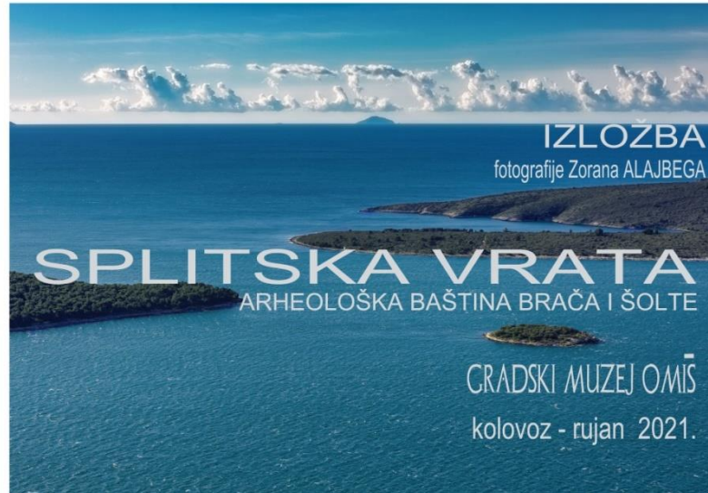
Plakat izložbe Splitska vrata. Arheološka baština Brača i Šolte

Jednoj izložbi Gradski muzej Omiš je bio suorganizator: