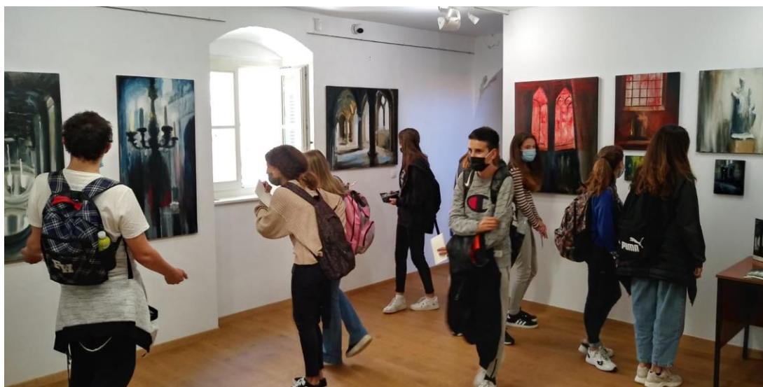
Posjetitelji na izložbi M. Baučića Katedrala