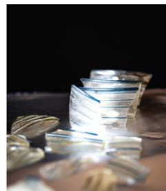
ULOMCI ČAŠA S APPLICIRANIM TAMNOPLAVIM NITIMA S MURANA (15. ST.)

Detalj s izložbe Utvrda Nutjak – prošlost, sadašnjost i budućnost