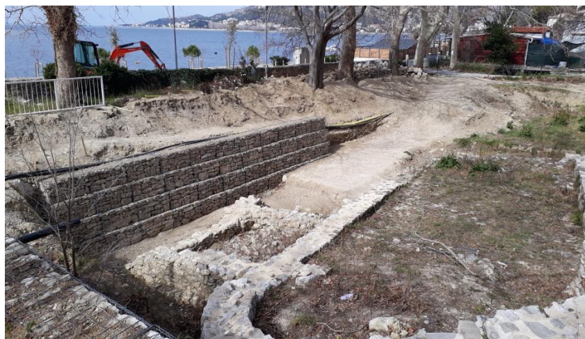
Brzet, JZ profil nakon provedenih istraživanja i postavljanja gabiona (ožujak 2022.)