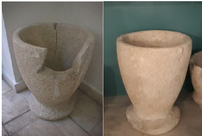
Kamena posuda prije i nakon restauracije

Antička kamena posuda iz stalnog postava (inv.ozn 24 A) restaurirana je u Restauratorsko-konzervatorskom odjelu Arheološkog muzeja u Splitu.