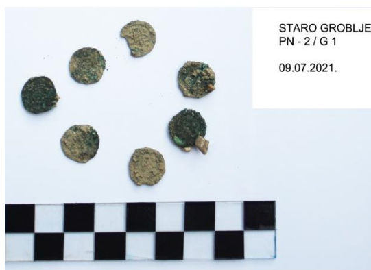
Staro groblje, novčići iz groba G-1