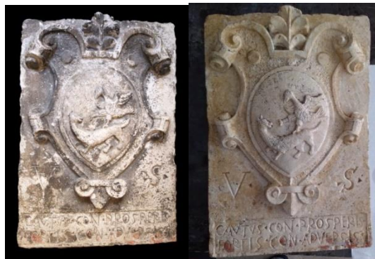
Grb Dražojević, prije i nakon konzervatorskih zahvata

- Grb obitelji Dražojević (Inv.ozn. 37 A) je predan na konzervatorsko-restauratorsku obradu na Umjetničku akademiju Sveučilišta u Splitu, Odsjek za konzervaciju-restauraciju.