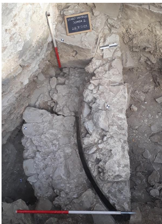
Staro groblje, temelj pronađene apside SI od Gospine crkve