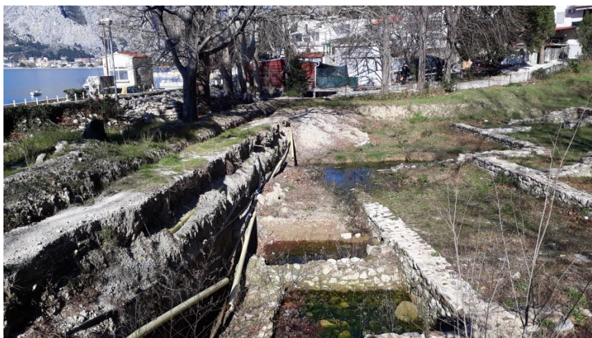
Brzet, jugozapadni profil prije izmještanja instalacija (veljača 2021.)

Od pokretnih nalaza prikupljeni su ulomci uporabne keramike (stolne, kuhinjske i amfora) te ulomci građevinske keramike (tegule, imbreksi i opeke) koji su pohranjeni u Gradskom muzeju Omiš.