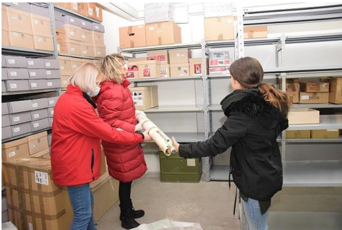
Slika 4. Selidba Povijesnog odjela