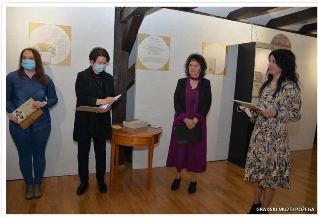
Slika 8. Izložba „Kruh nebeski – izložba molitvenika iz fundusa GMP-a