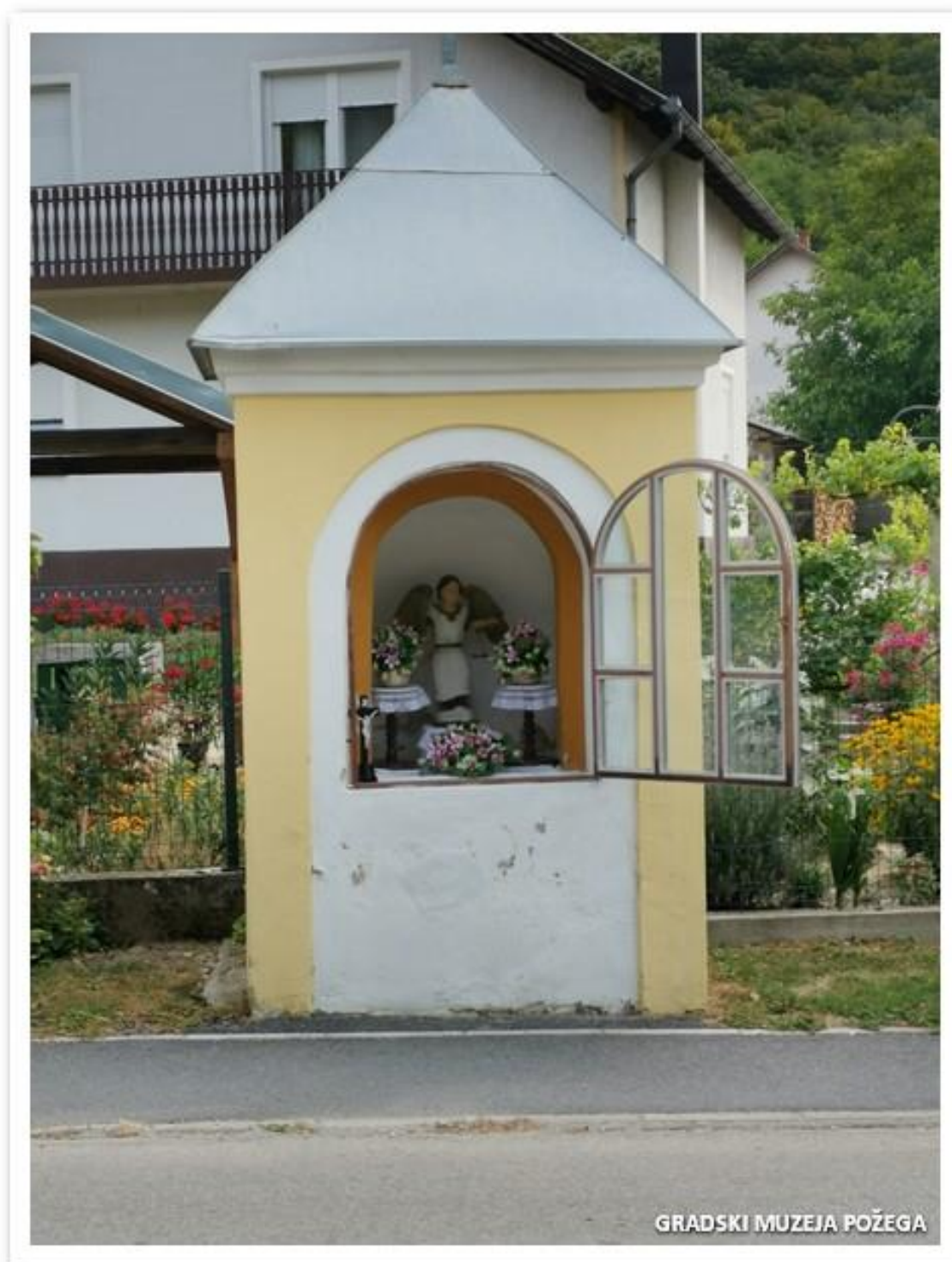
Slika 6. Teren Velika, fotografirala: Dubravka Matoković

- fotografije s terena (rekognosciranje građe, običaji, tekstil) – 2.252 snimaka