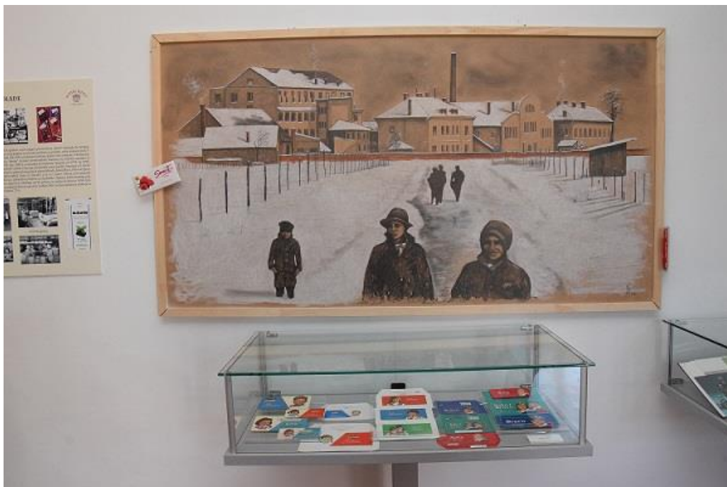
Slika 10. Izložba „Slatki život, 100 godina tvornice Zvečevo“