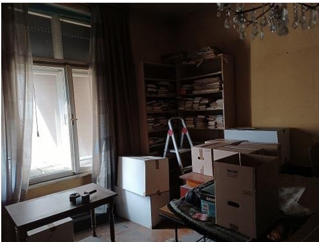
Slika 2. Selidba ostavštine Matka Peića

U rujnu 2021. godine za muzej je otkupljena ostavština Matka Peića. Povijesni odjel muzeja preuzeo je arhivsko gradivo koje je smješteno u oko 130 kutija, 5 kom namještaja i oko 80 osobnih predmeta. Cjelokupna ostavština vodi se kao Zbirka akademika Matka Peića u Povijesnom odjelu muzeja, a sastoji se od likovnih djela, knjiga te arhivskog gradiva.