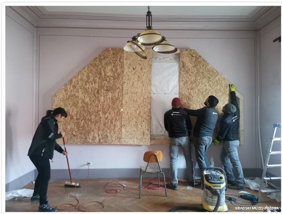
Slika 5. Zaštita freske Miroslava Kraljevića

- tvrtka „Kvinar“ zaštita metalnih vrata i vratnica na prozorima, skidanje skulpture Bezgrešnog začeca Blažene Djevice Marije uz pomoć djelatnika „Elektro teama“, te zaštita freske Miroslava Kraljevića i peći zbog radova na muzejskim zgradama.