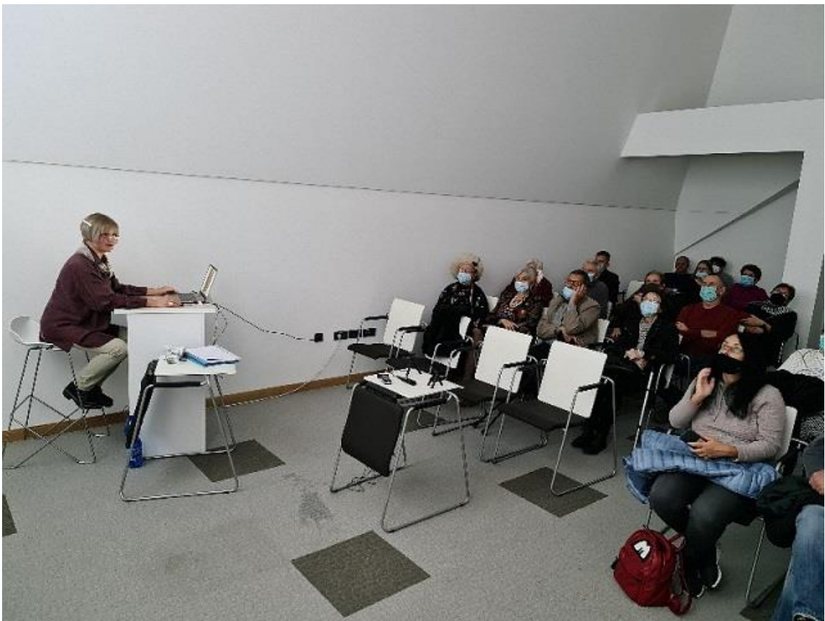
Slike 14. i 15. Predavanje Klub čitatelja