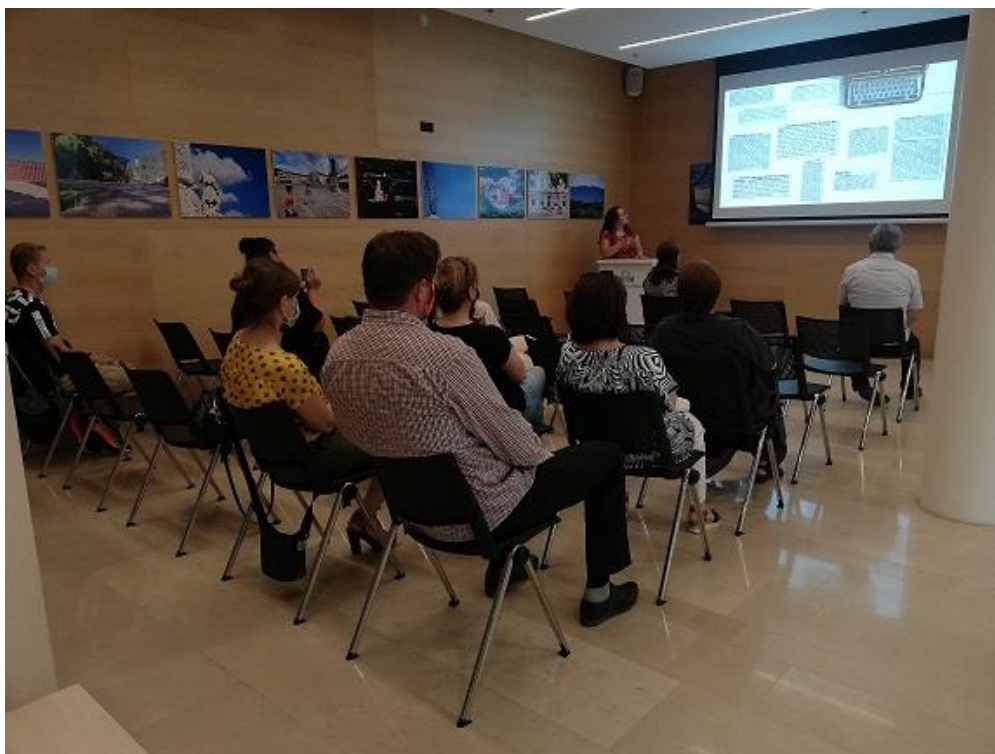
Slika 11. Predavljanje projekta digitalizacije „Glasnika županije požeške“