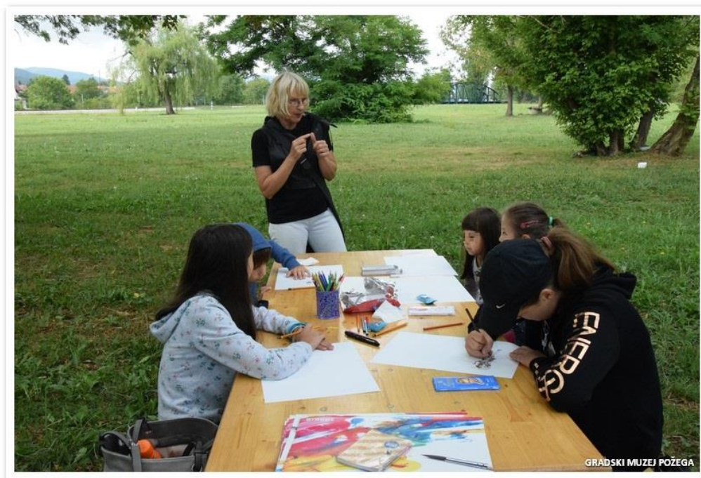
Slika 12. Radionica „Slatki život“