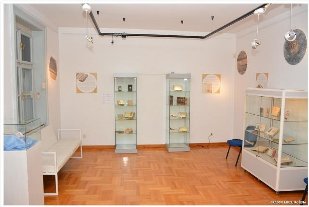
Slika 9. Izložba „Kruh nebeski – izložba molitvenika iz fundusa GMP-a, fotografirala: Ljiljana Marić