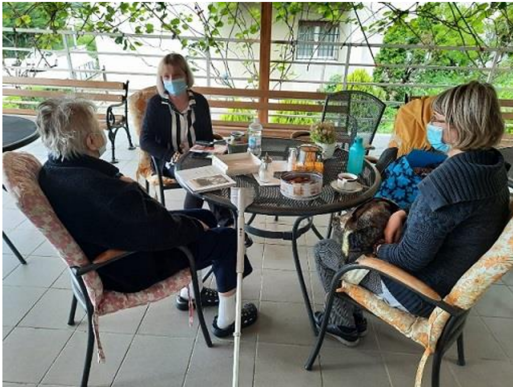
Slika 3. Teren, fotografirala: Maja Žebčević Matić