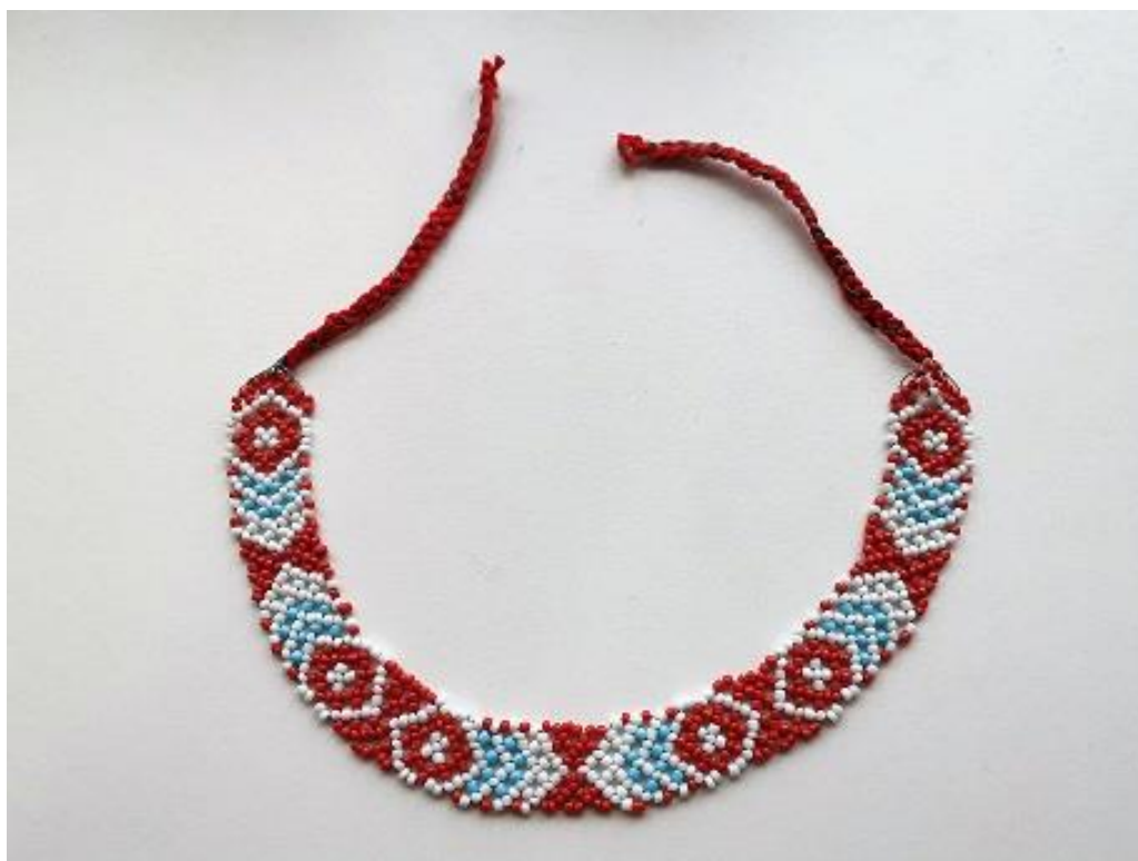
Slika 1. Ogrlica

- Za Zbirku (ženskog) oglavlja i nakita – 3 predmeta