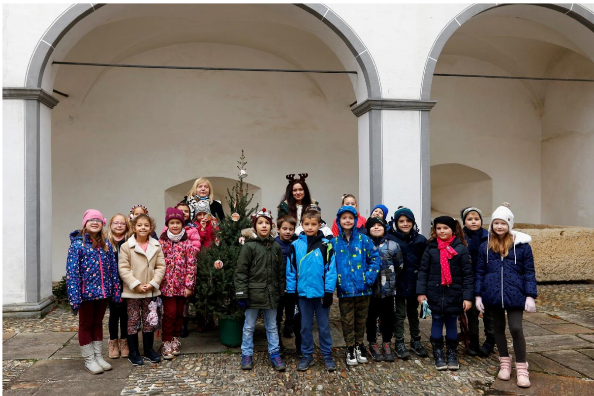
Slika 10. Božićne radionice u Starom gradu