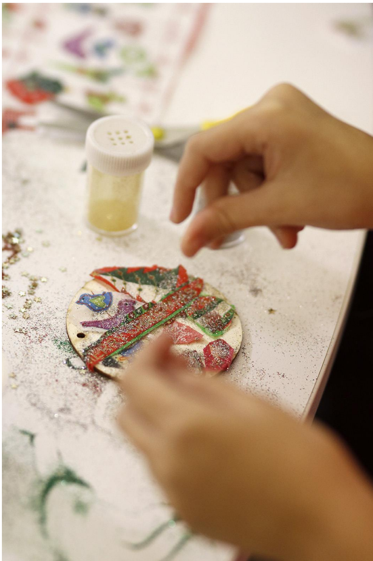
Slika 11. Božićne radionice u Starom gradu