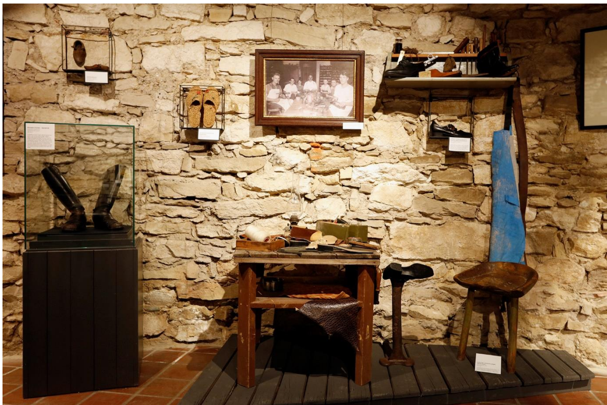
Slika 6. Izložba Šošteraj - priče o cipelama iz GMV