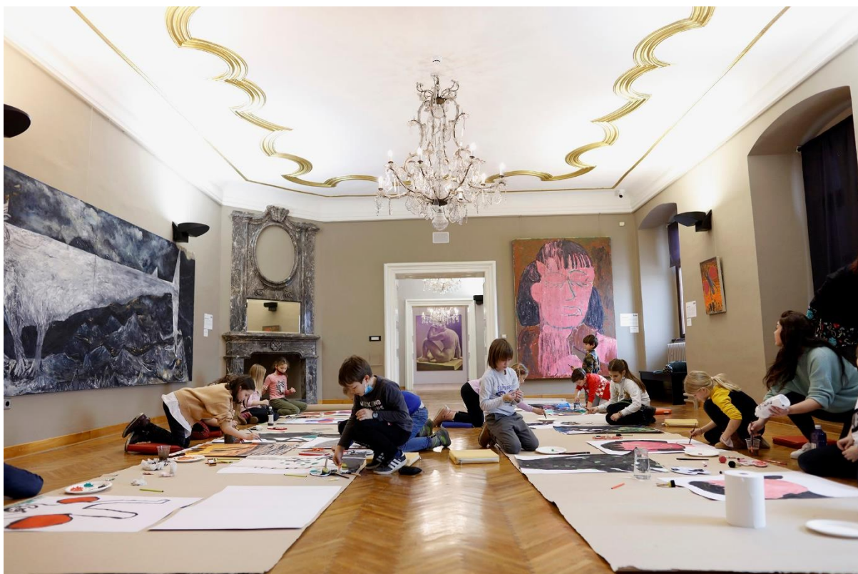
Slika 14. Radionica Slikarski challenge