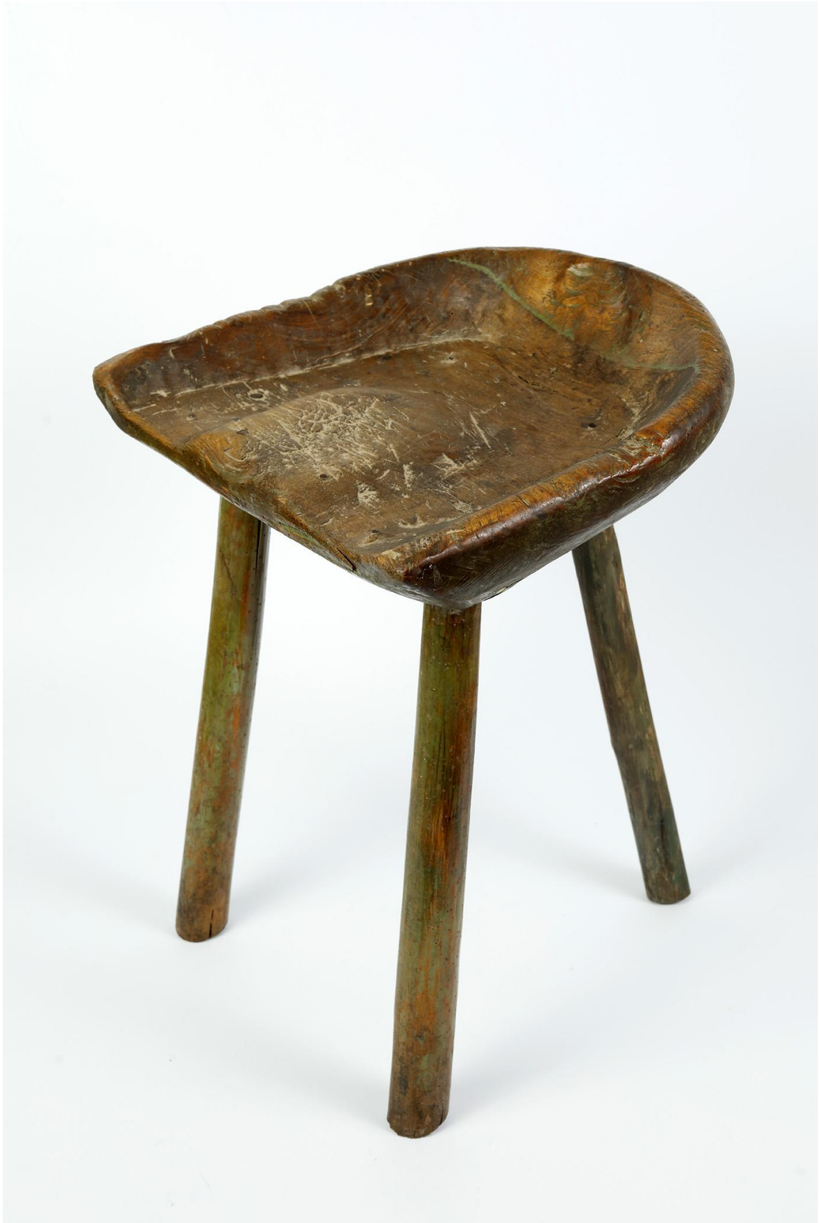
Slika 8. Postolarski tronožac, GMV 98595, akvizicija za Cehovsku zbirku