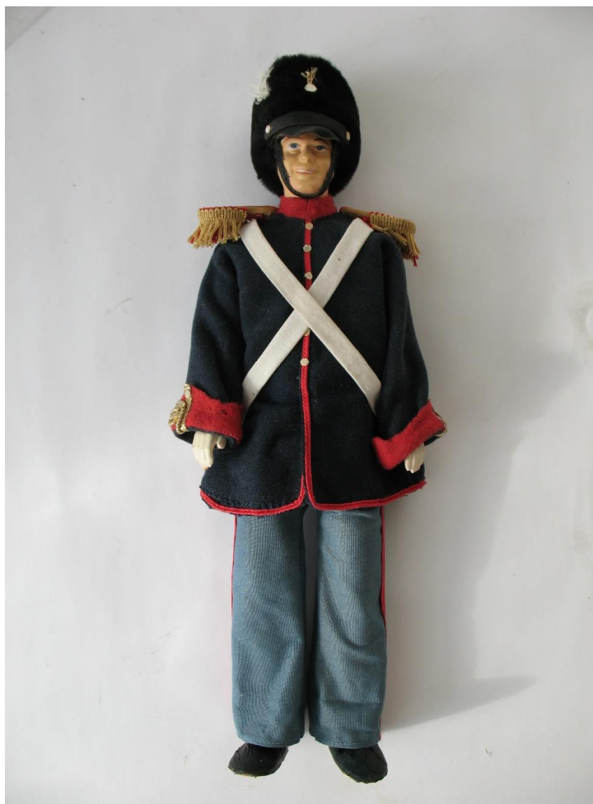
Slike 3. i 4. Lutka granadira Varaždinske gradske garde, GMV 98538, prije i nakon zahvata