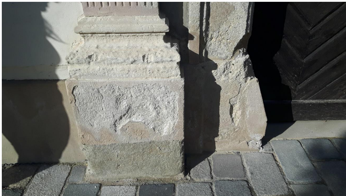
Slika 1. Lijeva kamena baza glavnog portala palače Herzer, prije restauracije