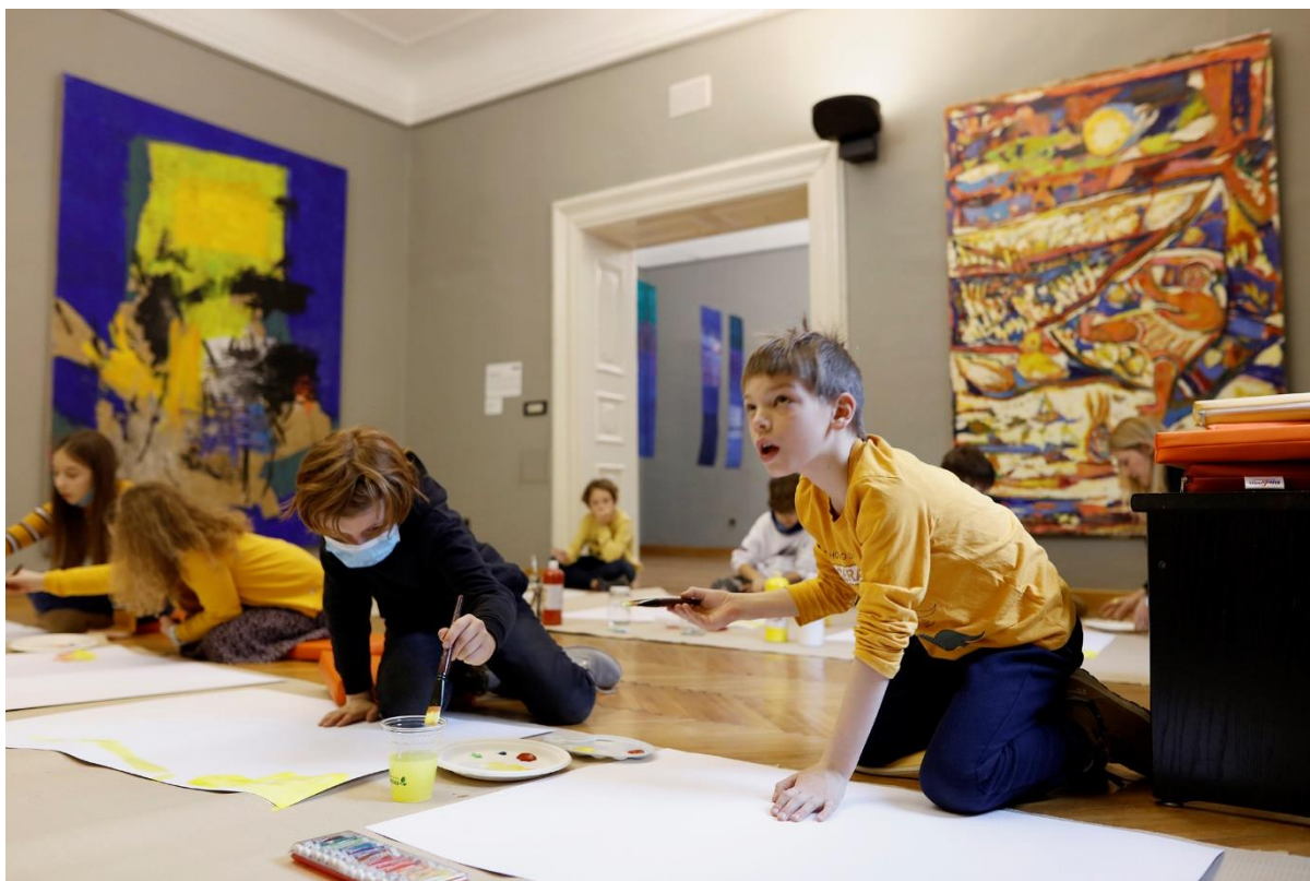
Slika 13. Radionica Slikarski challenge