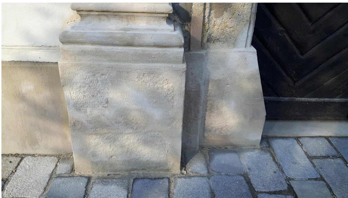
Slika 2. Lijeva kamena baza, glavnog portala palače Herzer, poslije restauracije