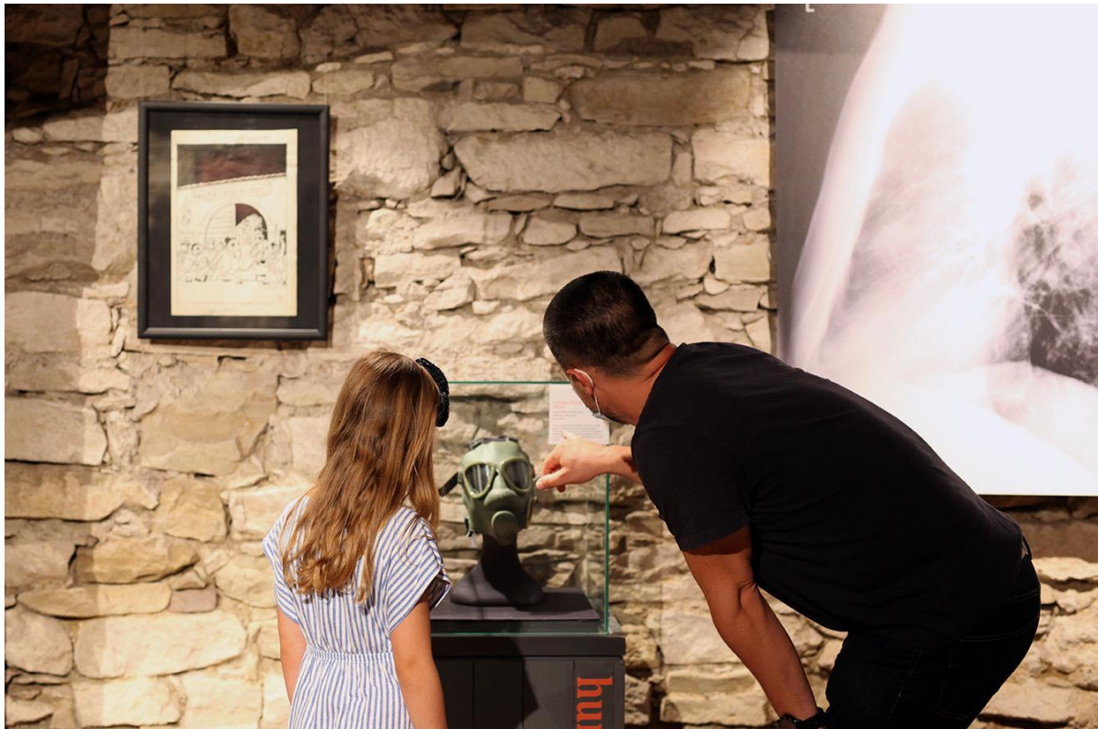
Slika 5. Izložba Dati volju za nevolju