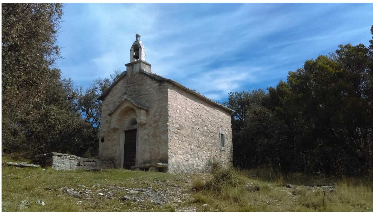
Slika 13. Virtualna izložba Srednjovjekovne crkve otoka Brača – Sv. Klement, Straževnik