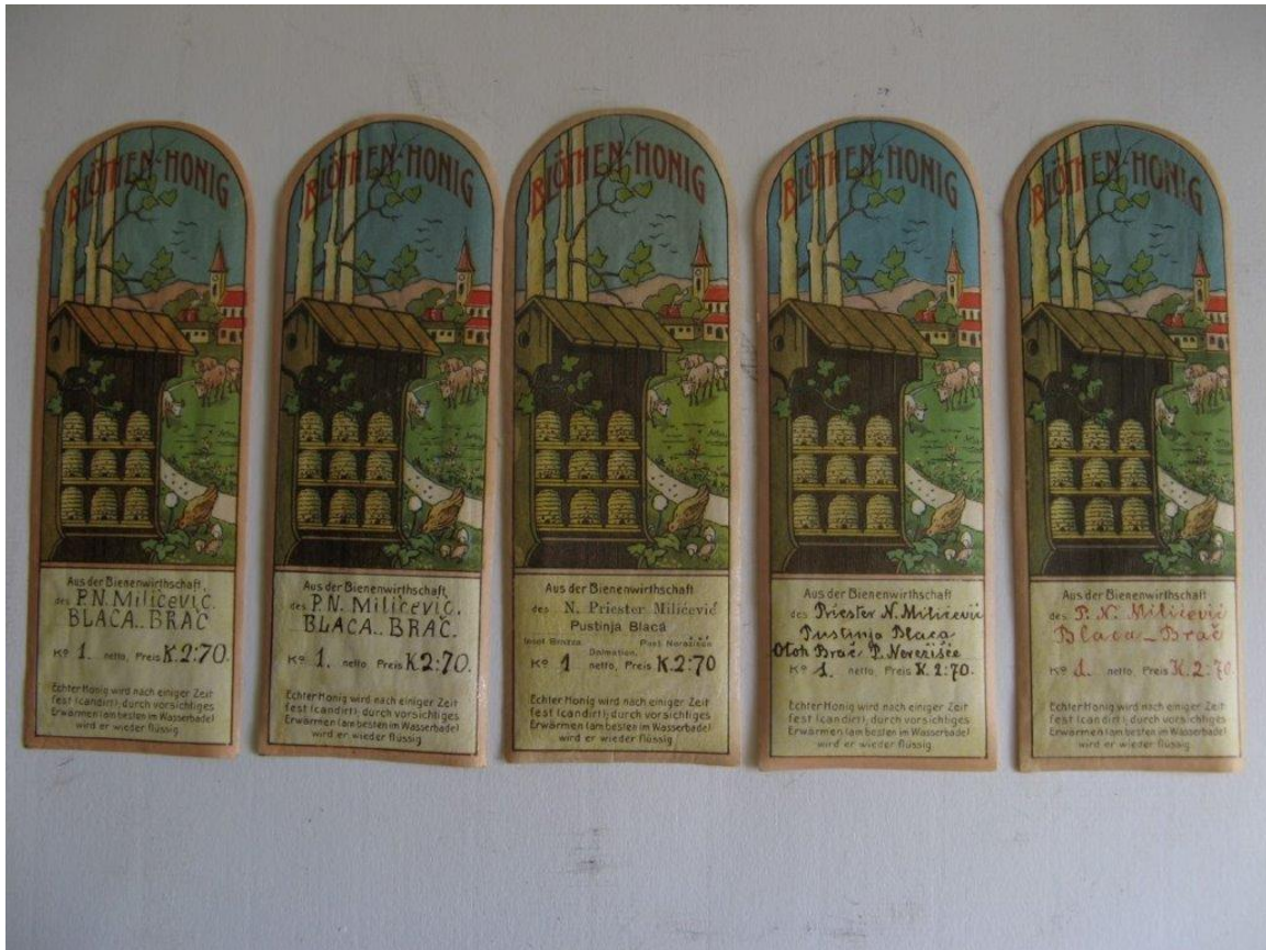
Slika 5. Etiketa sa staklenki za med Pustinje Blaca