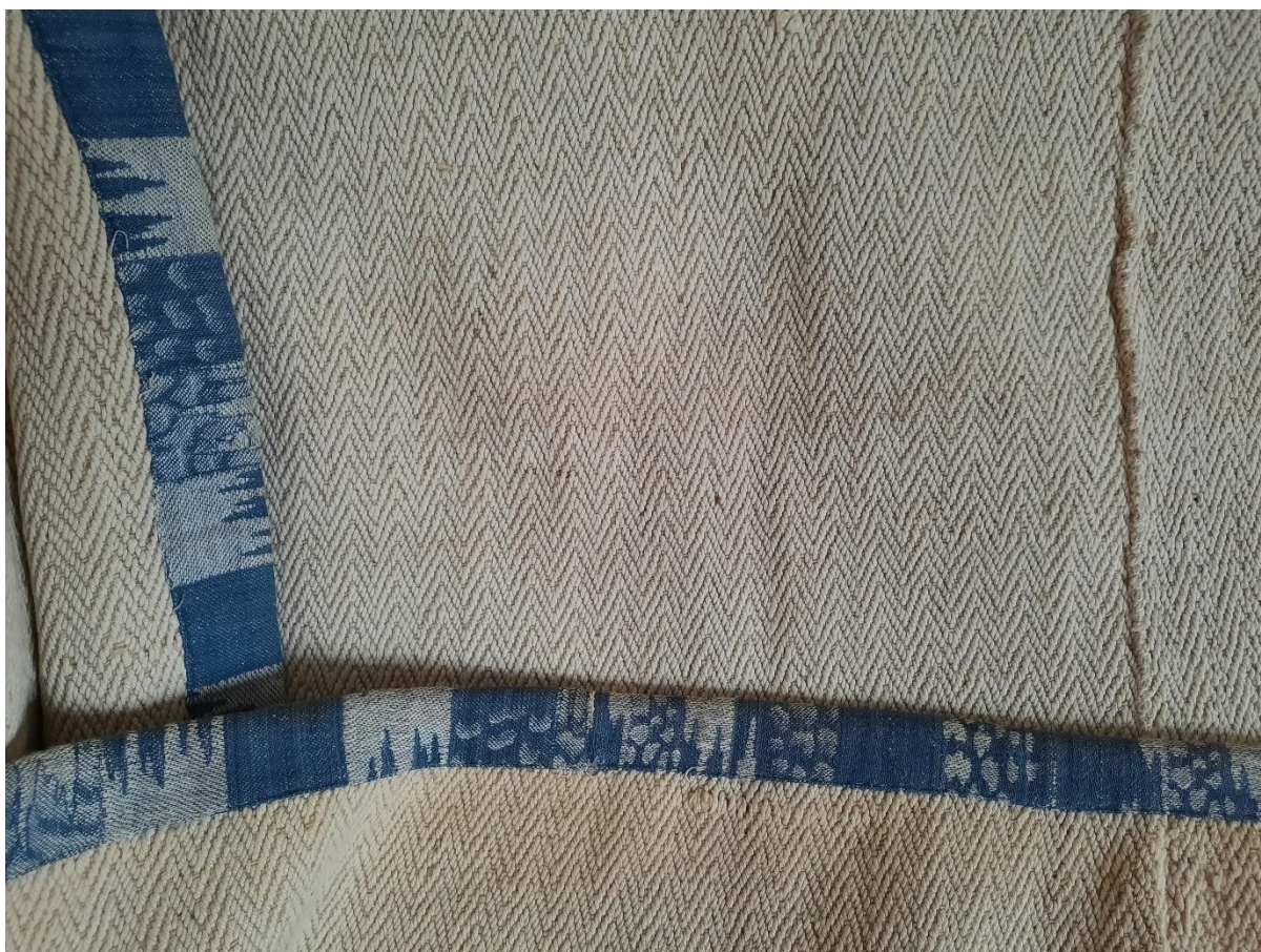
Slika 2. Novi darovani predmeti u fundusu Muzeja otoka Brača: pokrivač – bijac