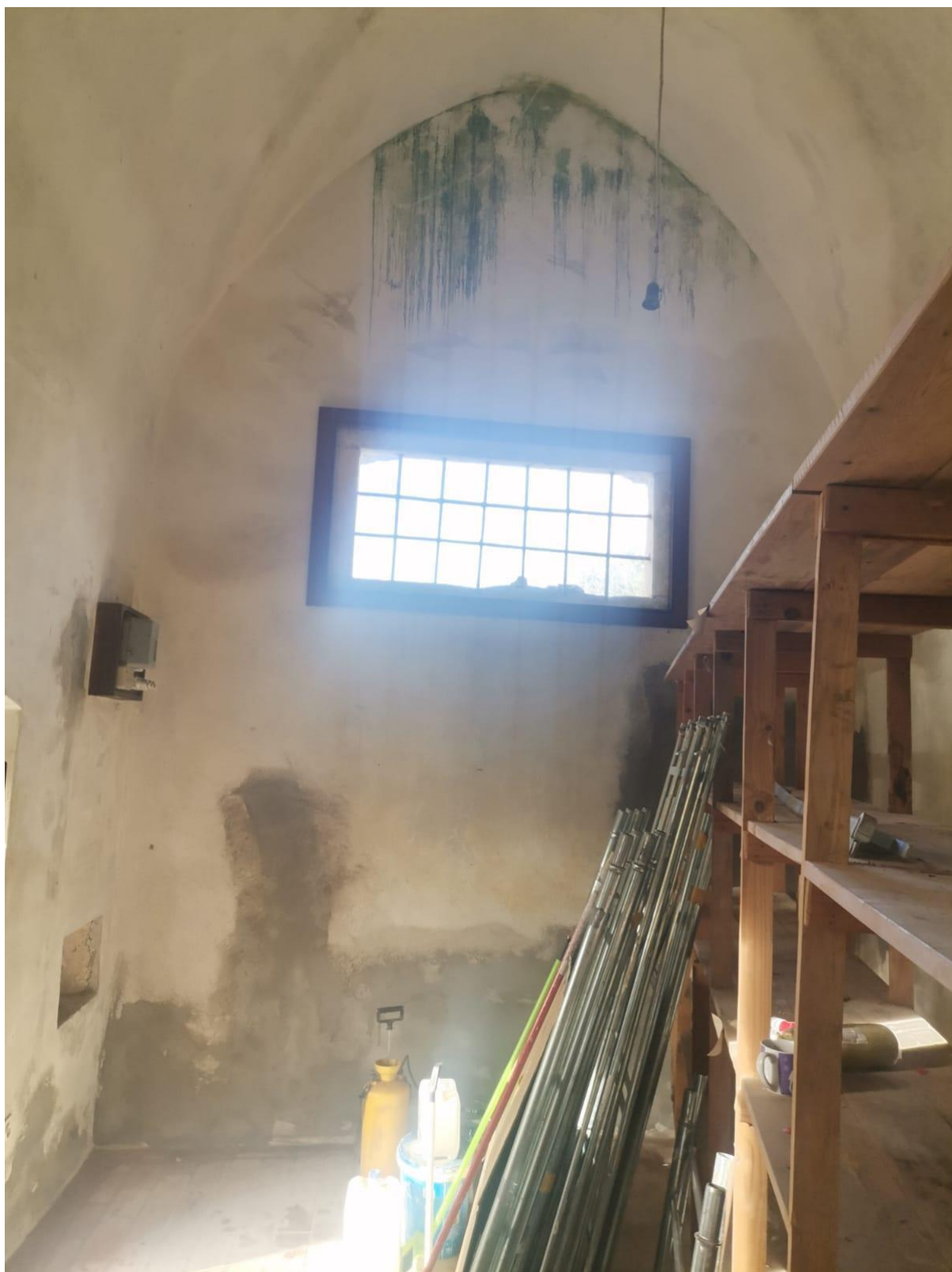
Slika 8. Radovi u sv. Anti u Škripu