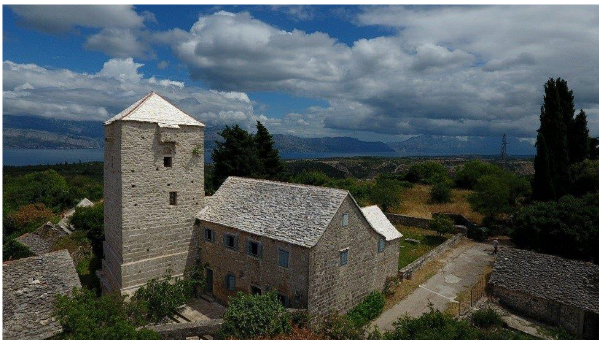
Slika 18. Zgrada Muzeja otoka Brača