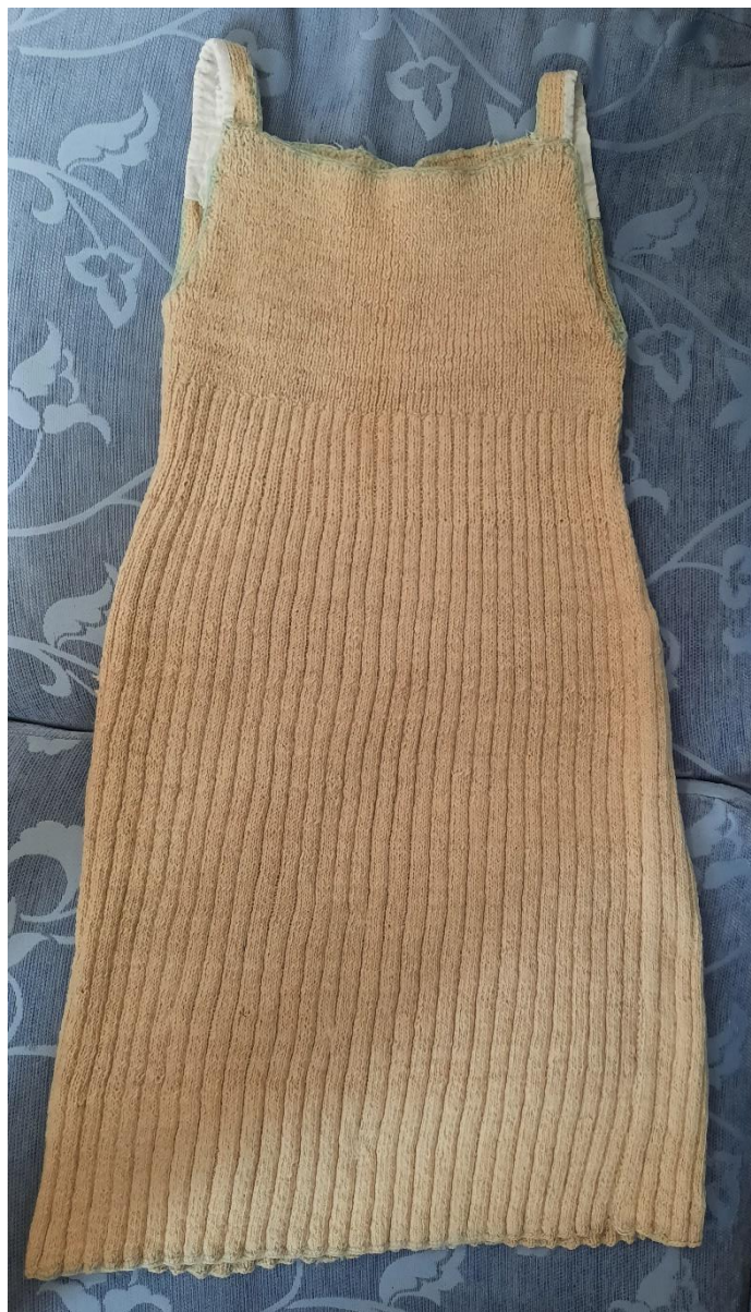
Slika 1. Novi darovani predmeti u fundusu Muzeja otoka Brača: donja haljina – šotana