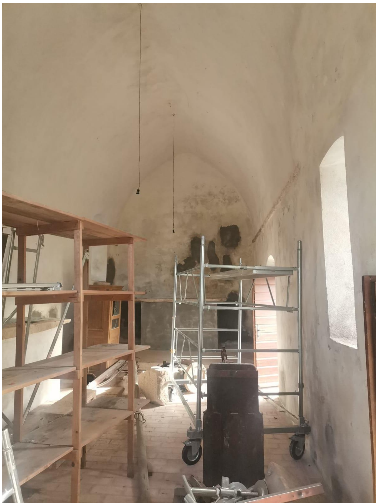
Slika 9. Radovi u sv. Anti u Škripu