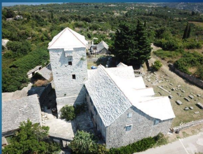
Slika 16. Fotografija iz virtualne priče iz Noći muzeja 2021.

Muzej otoka Brača, osnovan 1979., nalazi se u Škripu, najstarijem naselju na otoku, a smješten je u kaštelu Radojković.