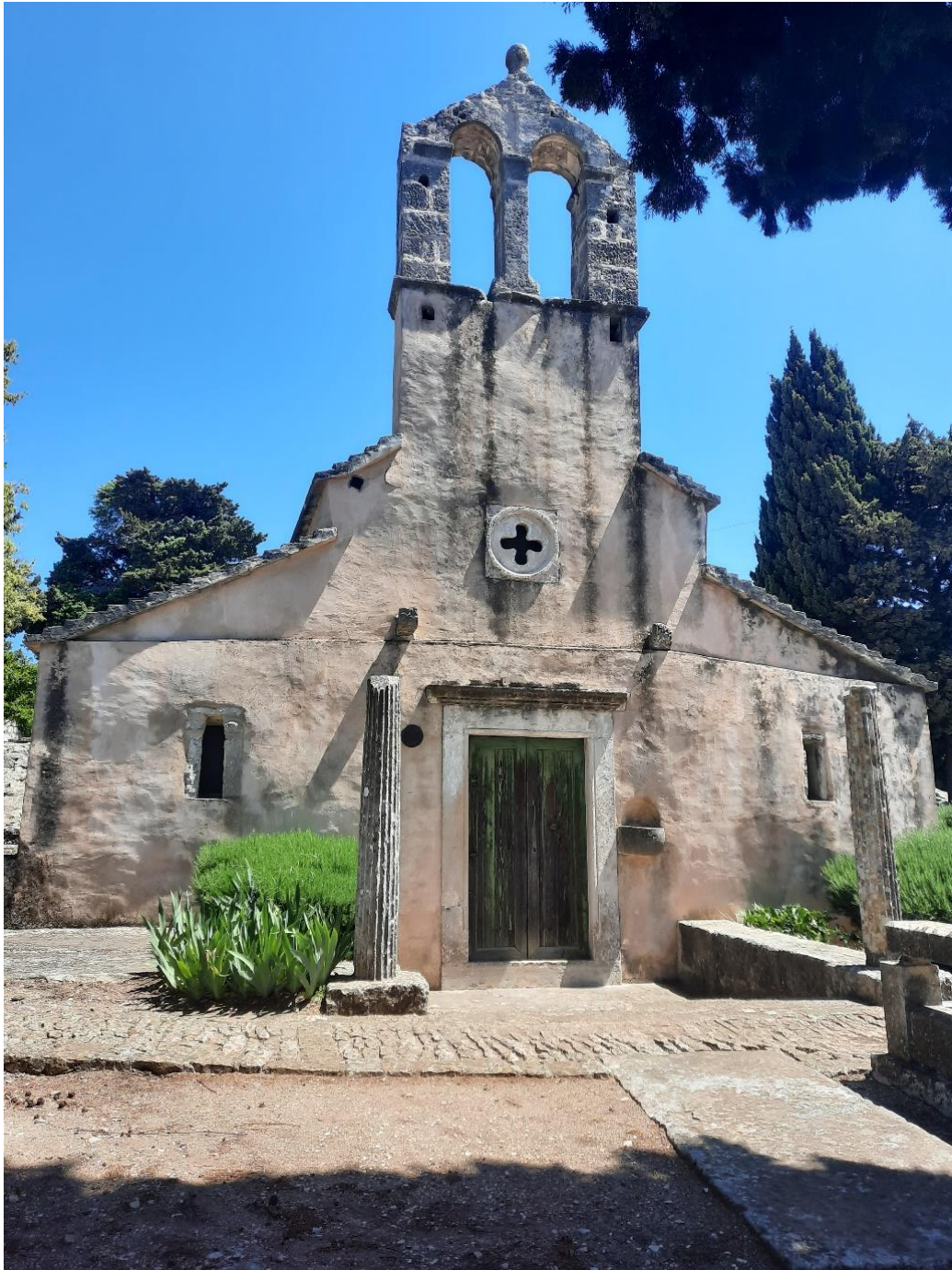
Slika 12. Virtualna izložba Srednjovjekovne crkve otoka Brača – Duh Sveti, Škrip