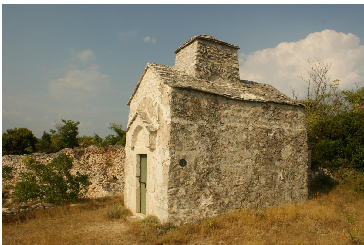
Slika 14. Virtualna izložba Srednjovjekovne crkve otoka Brača – Sv. Nikola, Selca