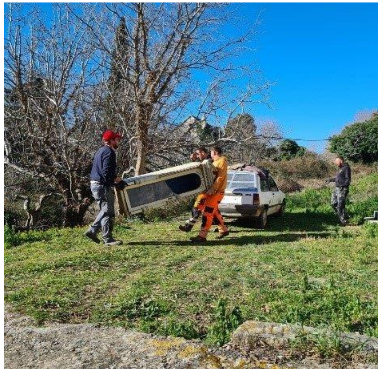
Slika 11. Radovi u sv. Anti u Škripu