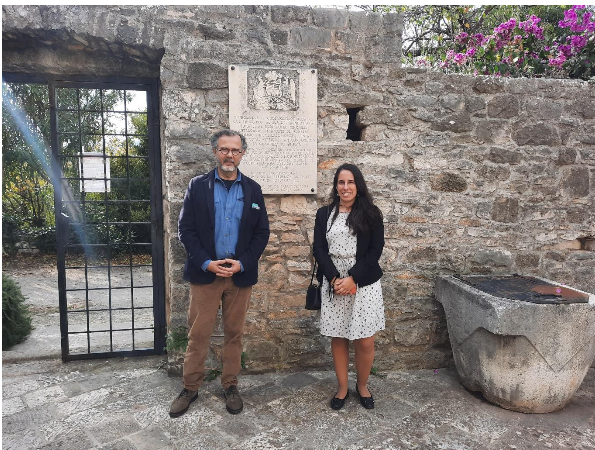
Slika 17. Posjet veleposlanika i konzulice Republike Čile, 12.11.2021.