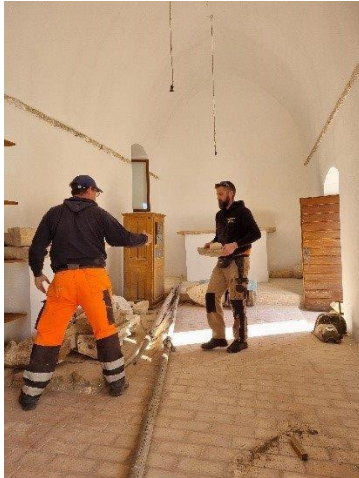
Slika 10. Radovi u sv. Anti u Škripu