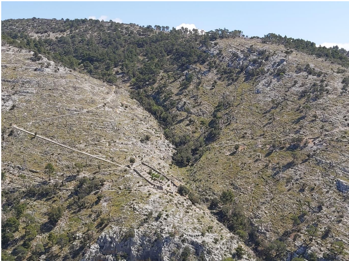
Slika 6. Pčelinjak Pustinje Blaca 2021.