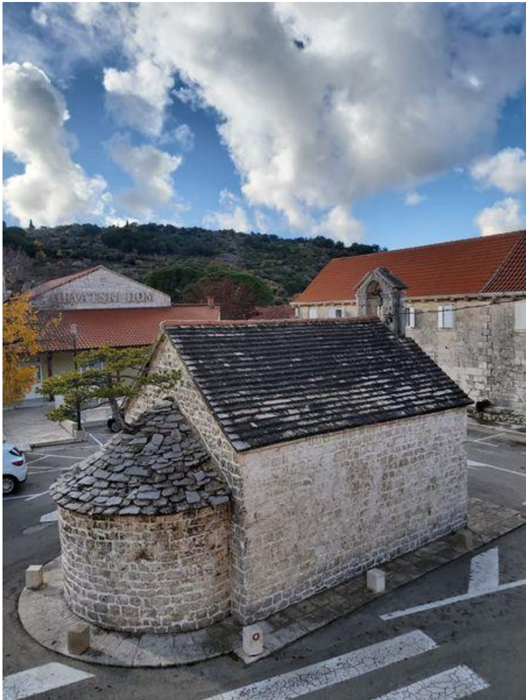
Slika 15. Virtualna izložba Srednjovjekovne crkve otoka Brača – Sv. Petar, Nerežišća