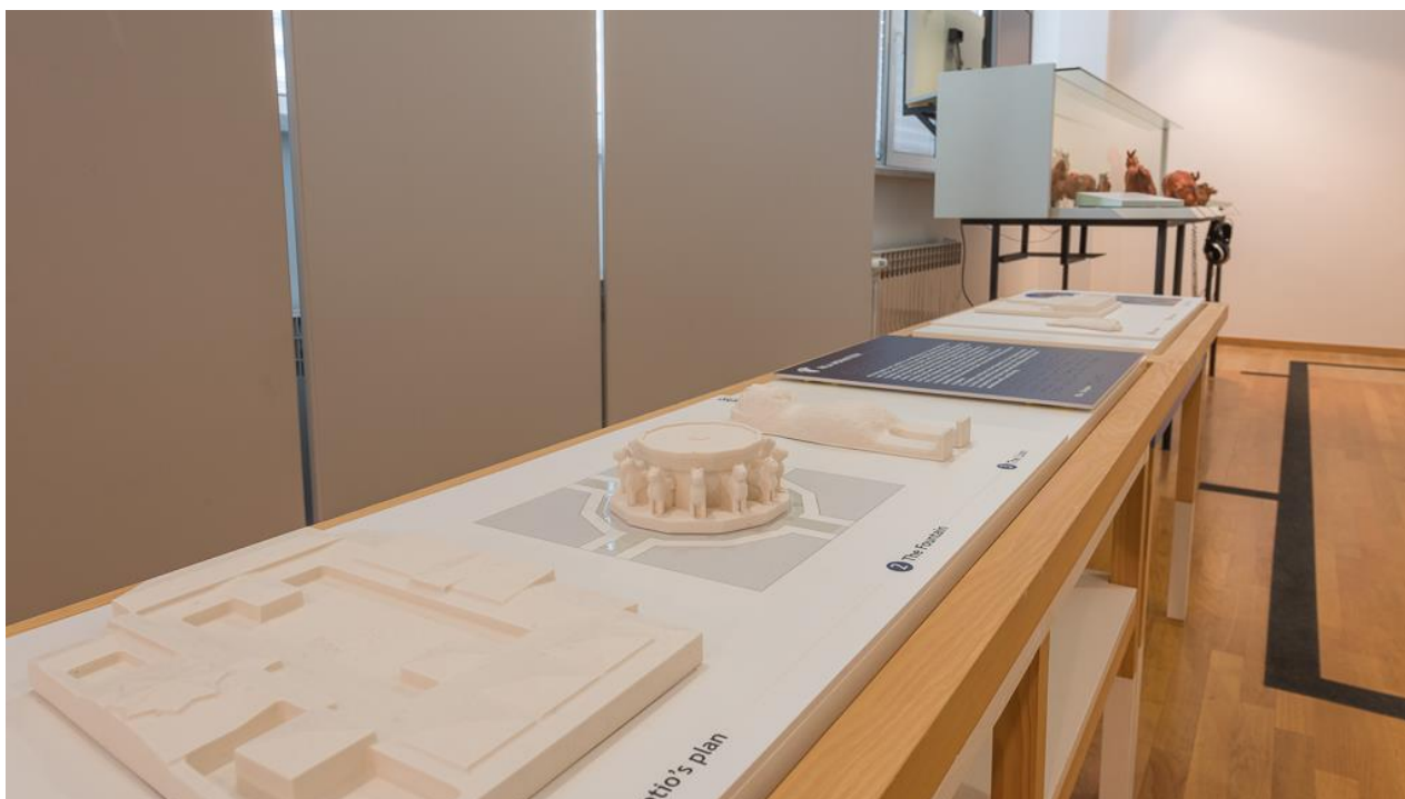
Slika 3. Izložba u sklopu projekta UNESCO 4 ALL (Renato Vukić)