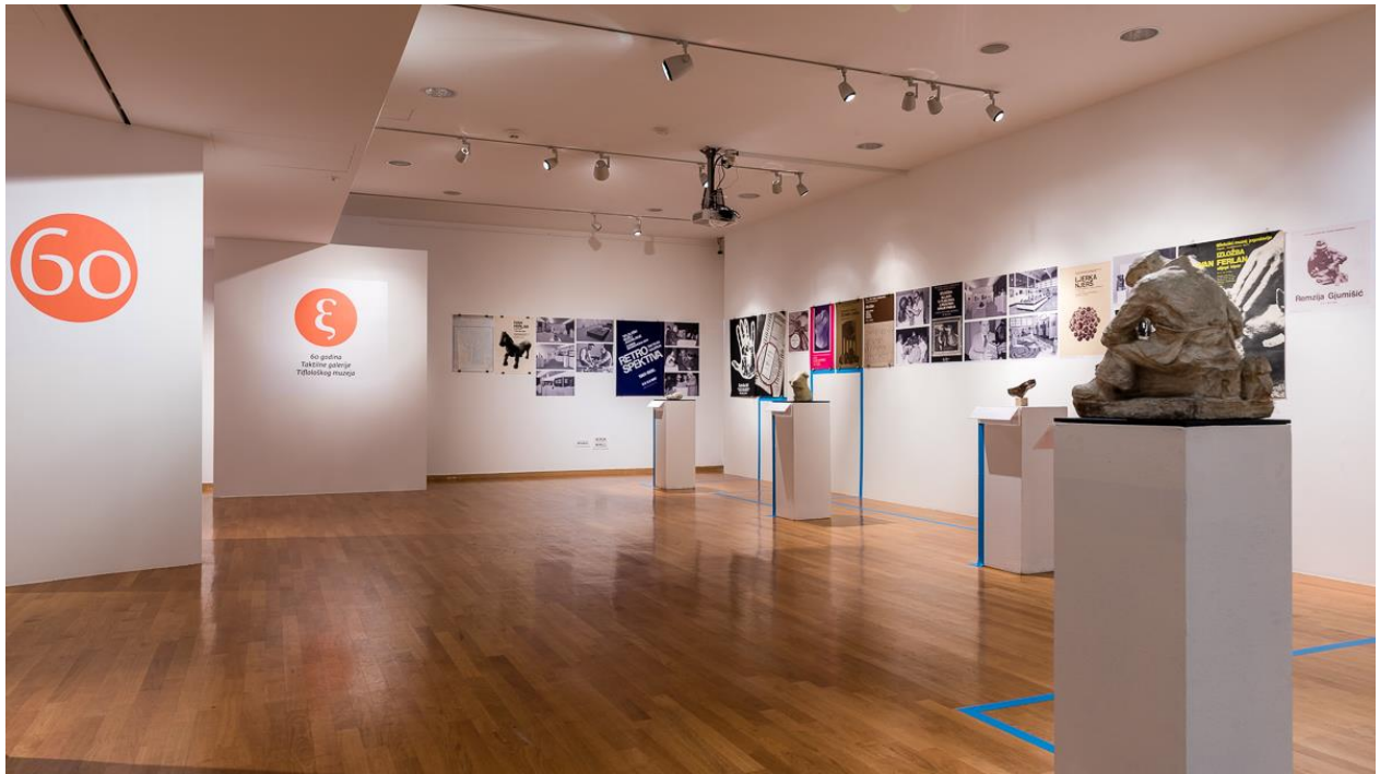
Slika 1. Izložba 60 godina Taktilne galerije Tiflološkog muzeja (Renato Vukić)