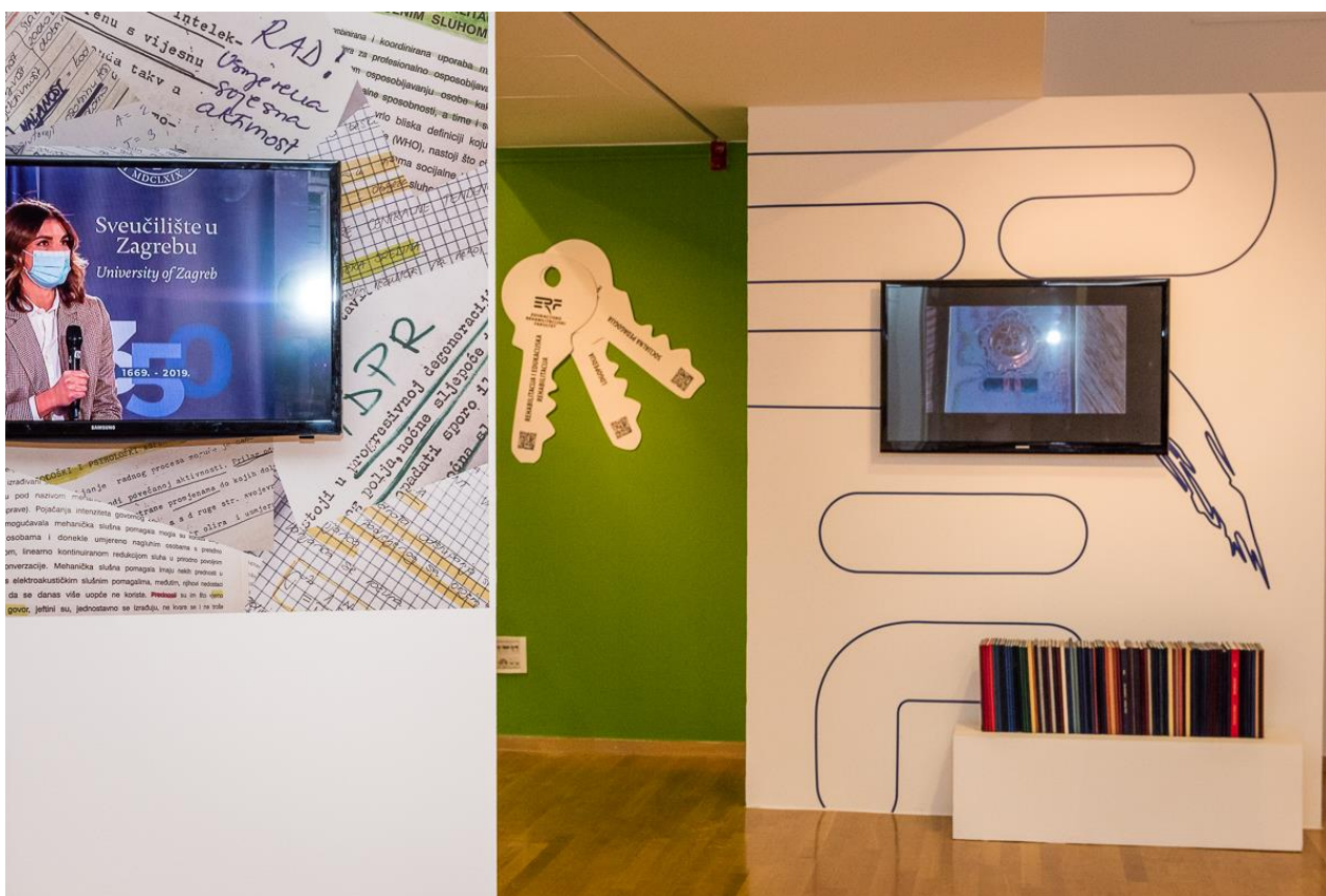
Slika 4. Izložba Ususret 60 godina Edukacijsko-rehabilitacijskog fakulteta (Renato Vukić)