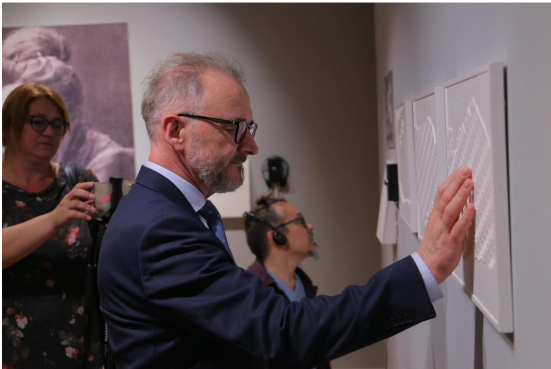
Izložba: „Dodirom kroz stvaralaštvo Nadežde Petrović“