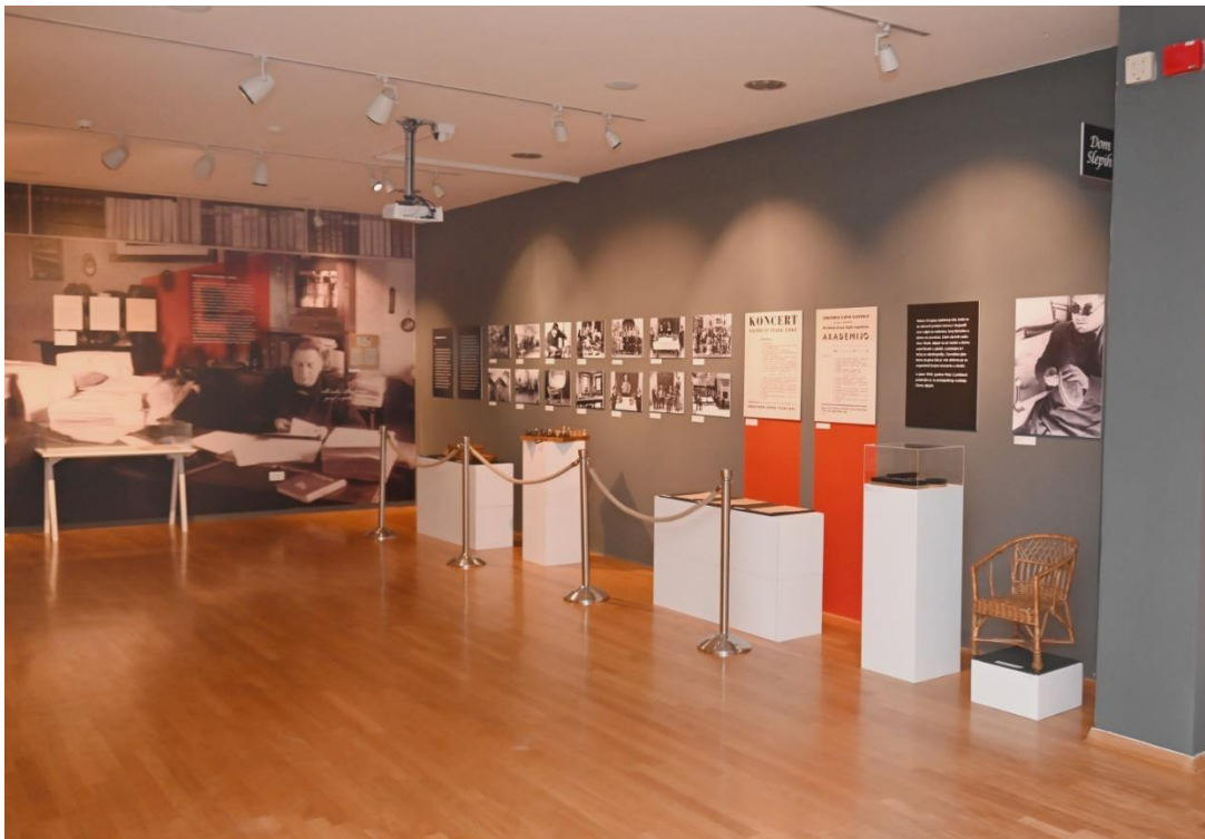
Izložba: „Svjetlost istiskuje tamu“