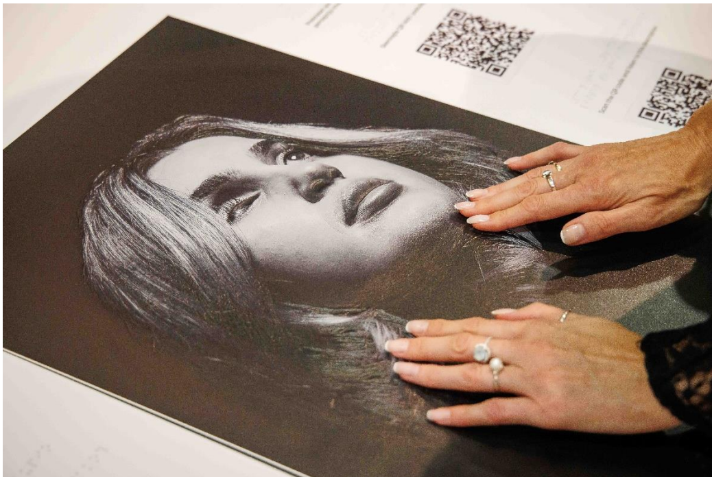
Izložba: „Nevidljivi svijet“ / „World Unseen“