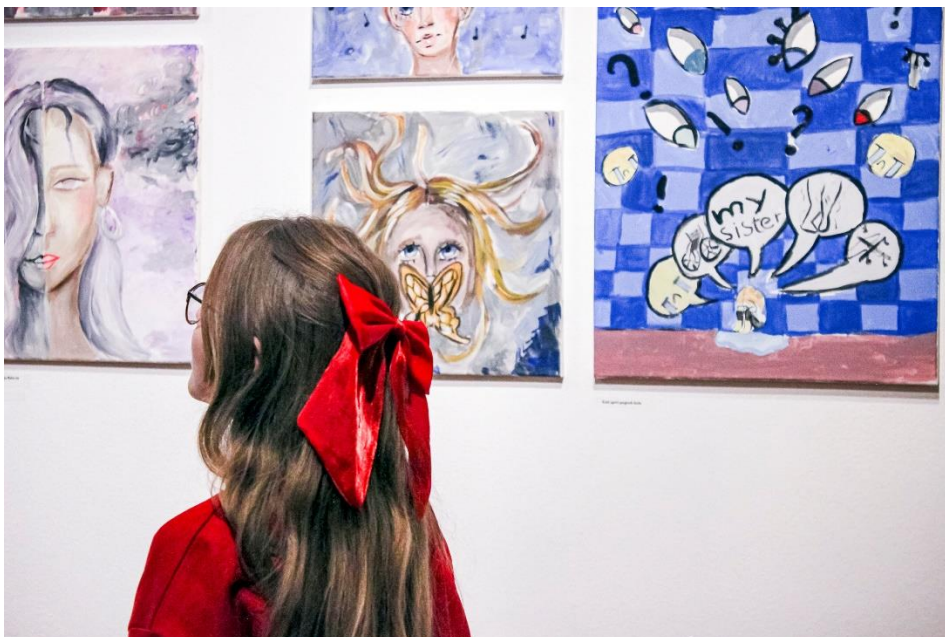
Izložba: „Likovni razgovor: Zoja i Lola, nas dvije“