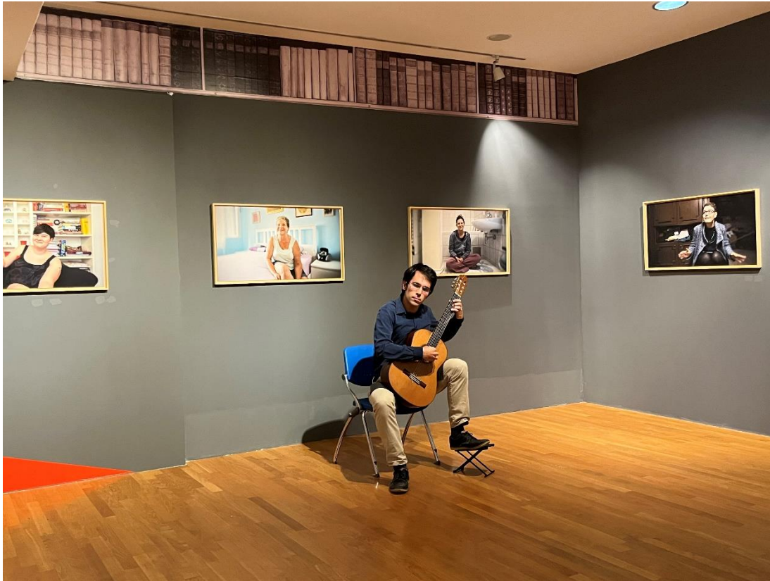
Festival empatije