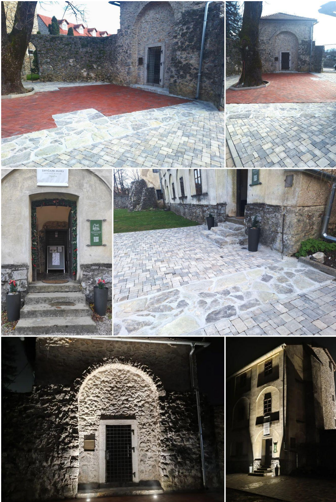
Slika: Projekt popločavanja južnog dijela dvorišta Starog grada Ogulina