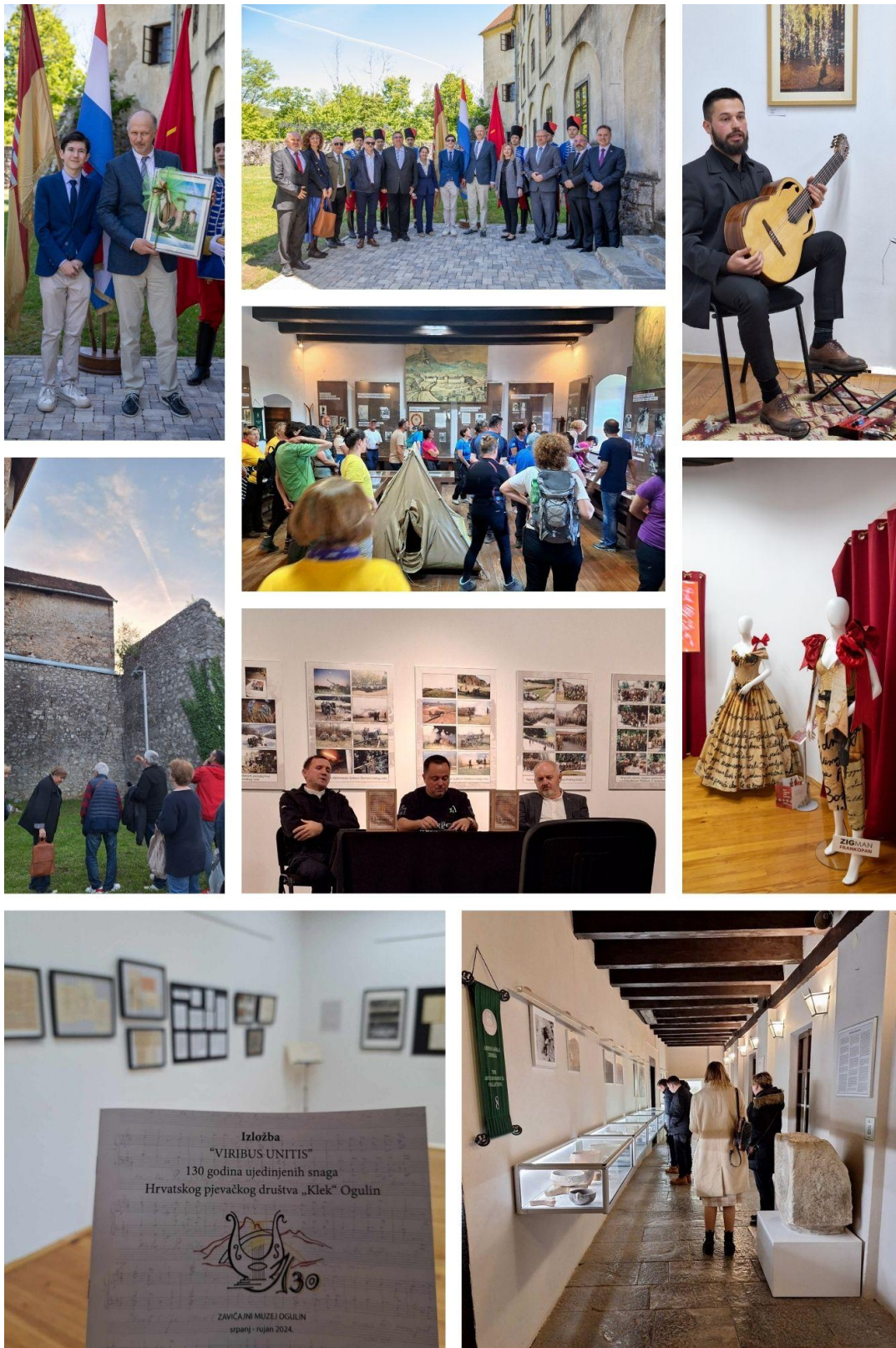
Slika: Programske aktivnosti u 2024. godini