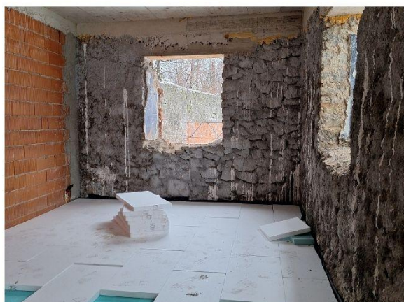
Slika: Radovi na dvorišnoj zgradi konjušnici 2023./2024.