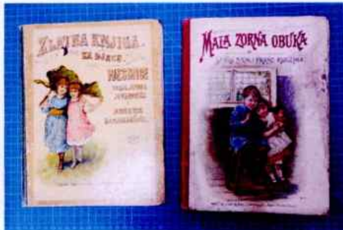
Darovane dvije dječje priče