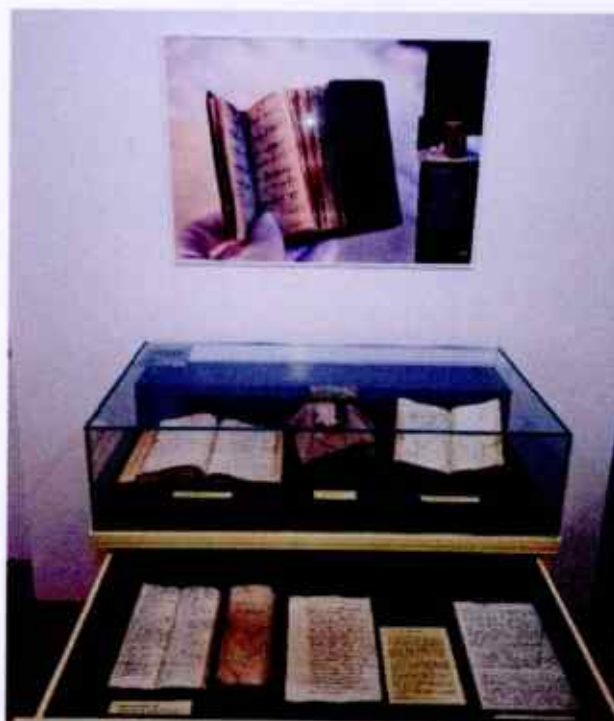
○ Detalj s izložbe