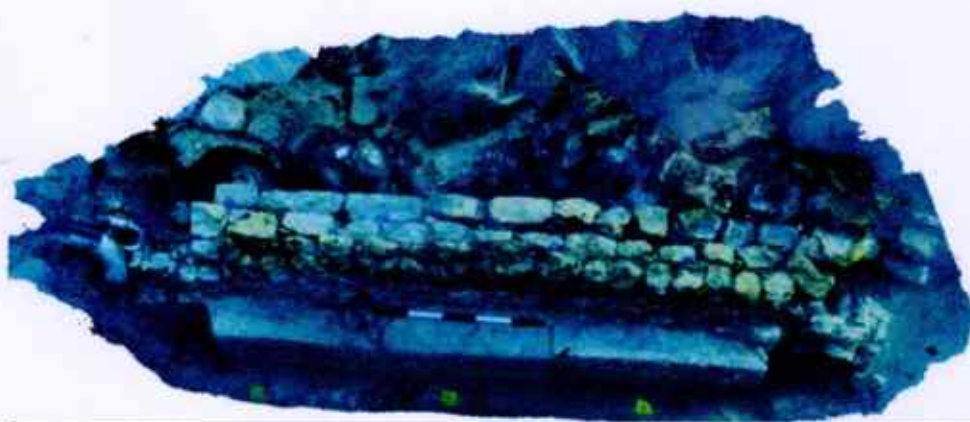
Fotogrametrijski snimak istraženog zida

Očišćen i dokumentiran zid u kampanji 2025. g.