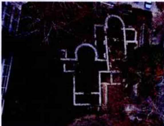
Brzet, stanje istraženosti 2025.