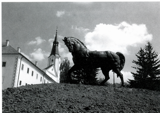
Antun Augustinčić, Konj — novopostavljena skulptura u Parku Galerije

Nabavljeno je 55 bibliotečnih jedinica (uz donaciju knjiga Ministarstva kulture RH)