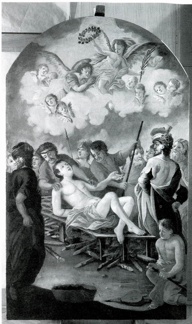
Blaž Gruber, Mučeništvo sv. Lovre , ulje na platnu, 18. st.