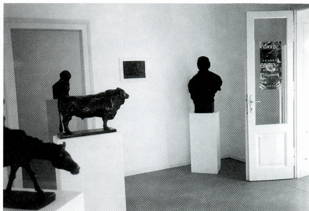
Postav izložbe Frangeš, Valdec, Meštrović, Augustinčić — Što su učitelji mogli dati svojem učeniku?