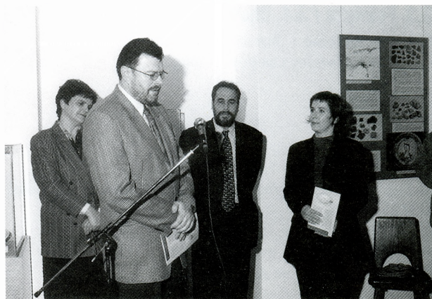
Otvorenje izložbe Ulomak do ulomka