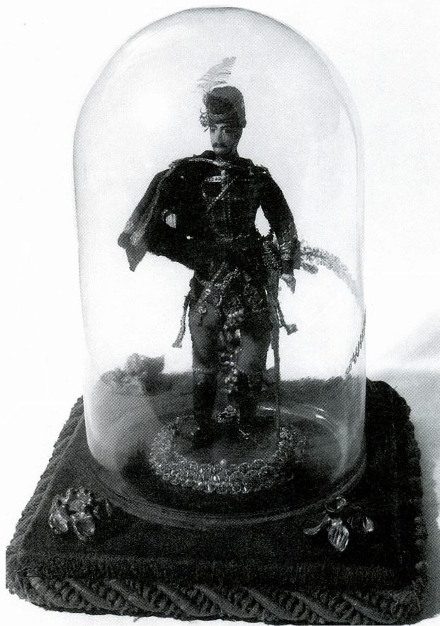
Lutka ban Josip Jelačić, 19. st.

Inventiran je dio građe nabavljen krajem prošle godine.