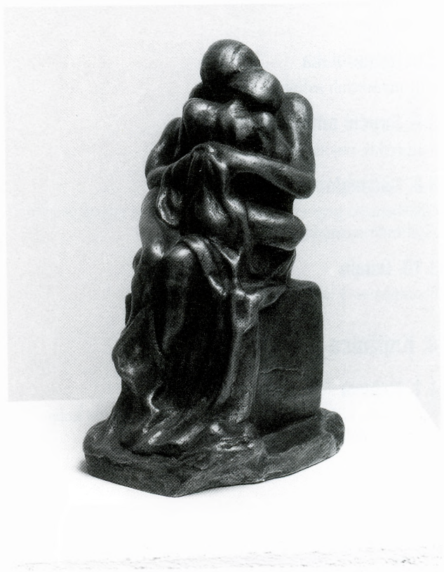
Antun Augustinčić, Majka s djecom