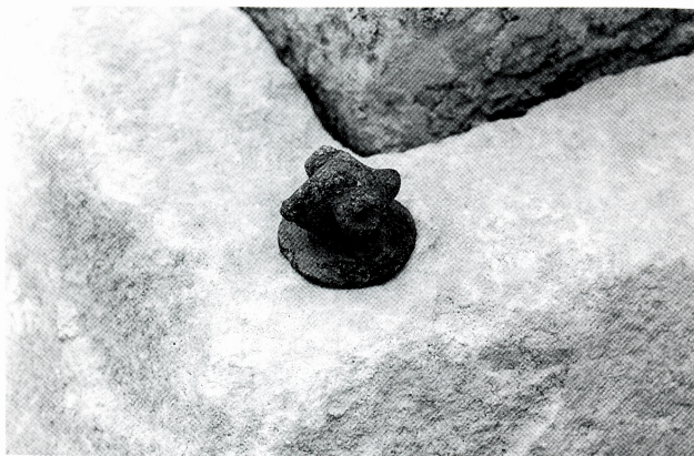
Ovnujska glavica — poklopac posude, nalaz iz Markove špilje (neolit)