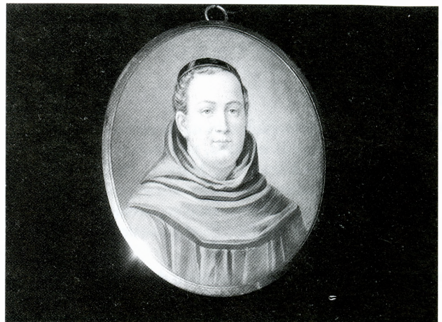
Medalja s likom fra Andrije Kačića Miošića, druga pol. 19. st.