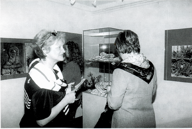
Obrti koji nestaju: varaždinski licitari, prizor s otvorenja izložbe

Tema izložbe su fotografije s prikazima ukrasa na varaždinskim građevinama.