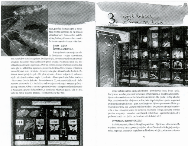
Vodič stalnim postavom Entomološkog odjela

Gradski muzej Varaždin, Stari grad, 6. prosinca 2000.-4. veljače 2001.