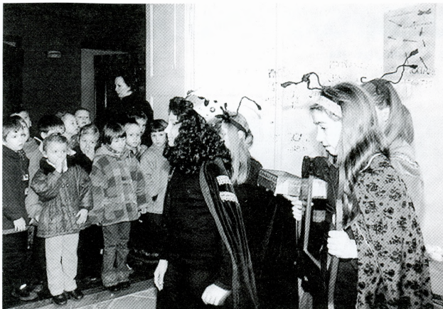
Predstava Jutro mravlje kraljice