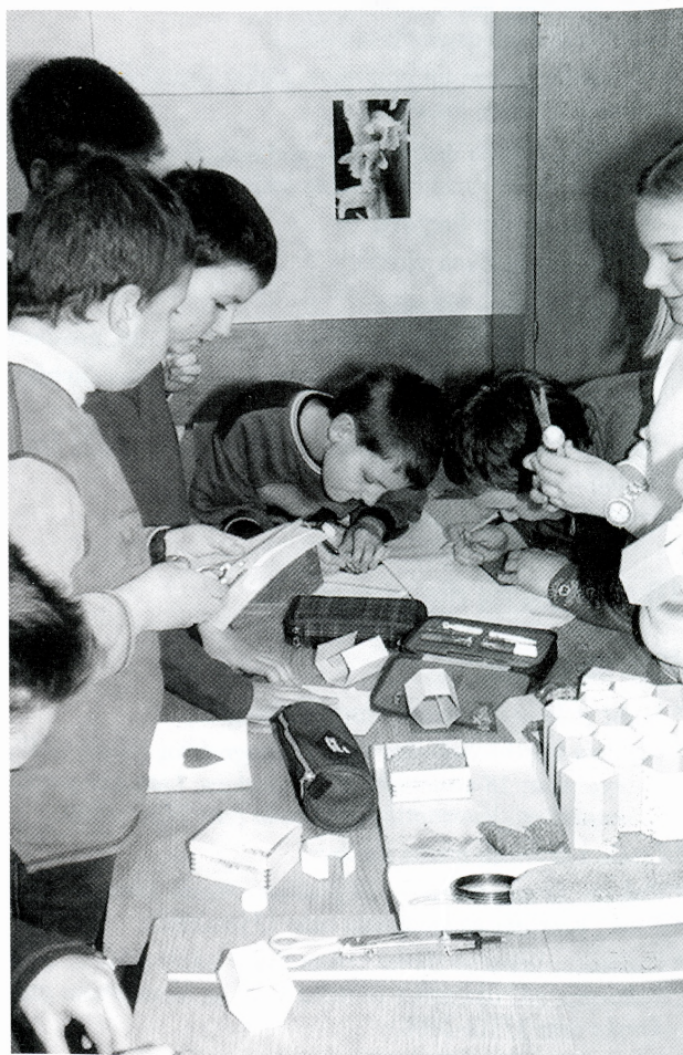
Radionica Životni ciklus i metamorfoza kukaca