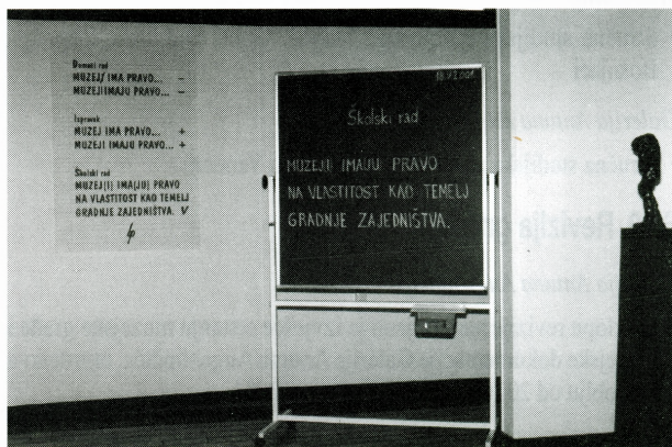
Detalj postava izložbe Muzej(i) ima(ju) pravo...