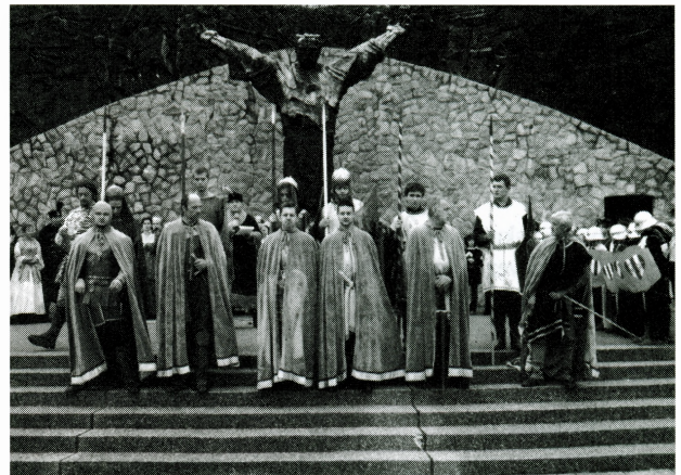
Viteški turnir, 16. rujna 2001.

Događanje i radionice posjetilo je približno 1.500 osoba.