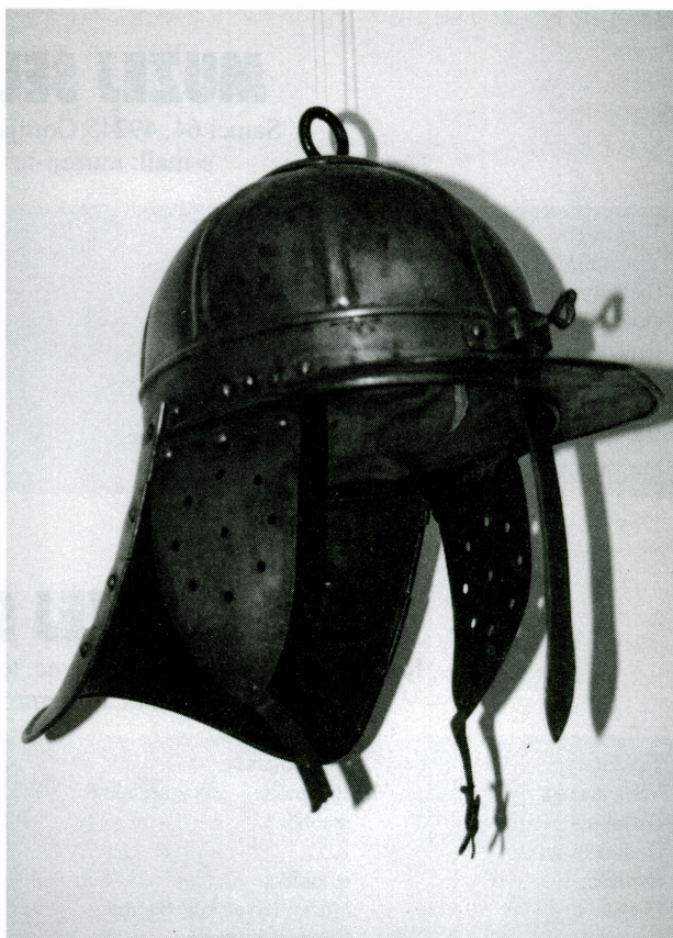
Kaciga, oko 1600.