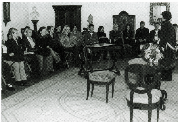
Predavanje Bidermajer namještaj