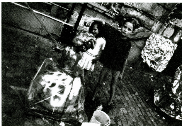
Obilježavanje Međunarodnog dana muzeja