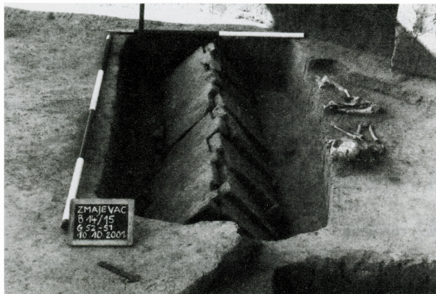
Rimsko groblje u Zmajevcu, arheološko iskopavanje 2001. g. (grob 51/52)

Istraživanje tog lokaliteta ušlo je u treću godinu, u kojoj je istražen neusporedivo najveći broj grobova s nizom iznimnih nalaza iz