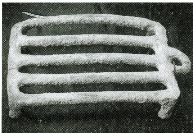
Pržilica, keramika, 1. - 2. st.