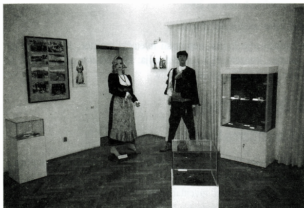
Dio stalnog postava, ožujak 2001.