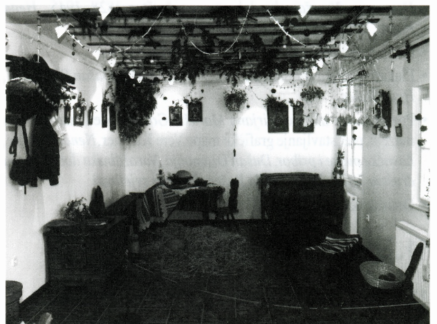
Dio postava izložbe Svim na Zemlji mir, veselje

Uz izložbu su tiskani pozivnica i katalog u nakladi GMV-a.