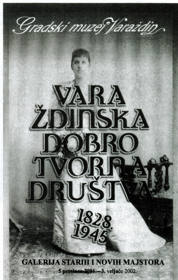
Katalog izložbe Varaždinska dobrotvorna društva 1828.-1945.

Nekoliko stotina vodstava posjetitelja (uglavnom učeničkih ekskurzija) kroz postavbe i neke izložbe