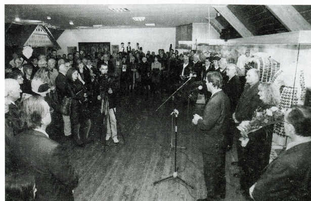
Otvorenje stalnoga etnološkoga postava, Vinkovci, 2001.