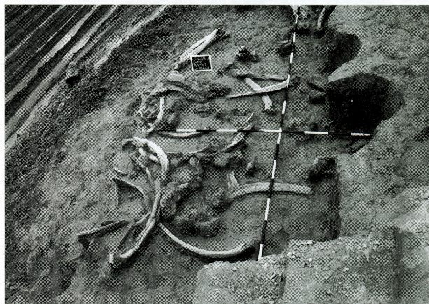
Kosti mamuta iskopane na Gliništu Ljeskovac-Dren

nekropole. U Gundulićevoj i Glagoljaškoj ulici na prostoru grada Colonia Aurelia Cibalae otkriveni su dijelovi rimske arhitekture.