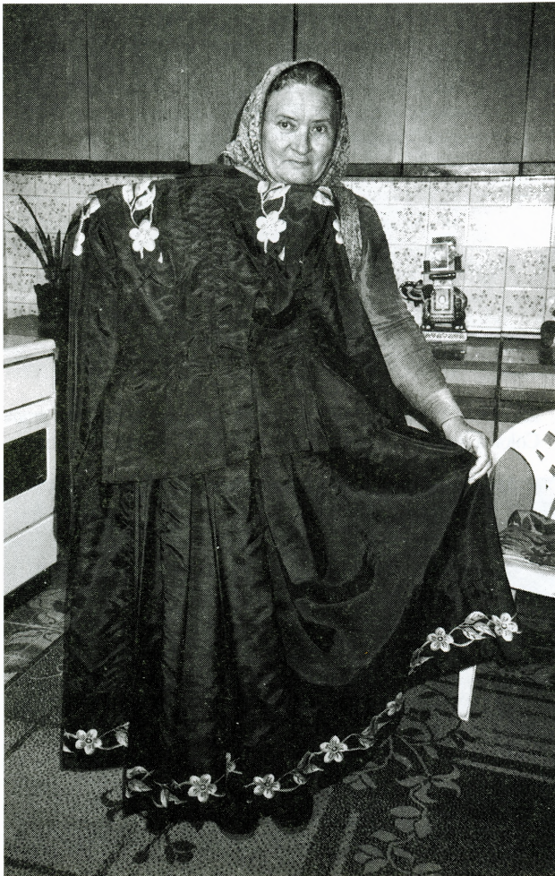
Pregled i registriranje etnološke građe na terenu, Otok, 2001.