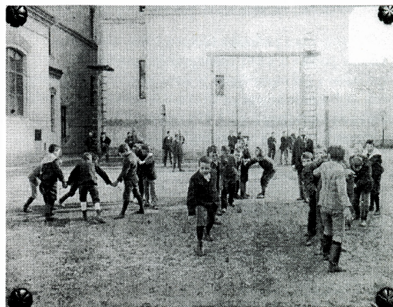
Fotografija nakon restauracije