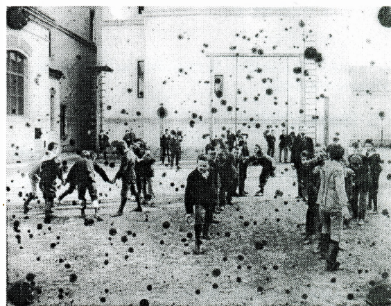
Učenici pučke škole u Samostanskoj ulici u Zagrebu, 1895. (fotografija prije restauracije)

Među predmetima na kojima su obavljeni zaštitni radovi je i nekoliko fotografija školskih ambijenata s kraja prošlog stoljeća koji su bili u vrlo lošem stanju.