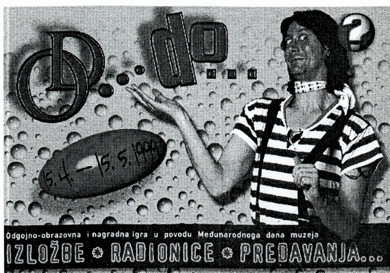
Naslovnica knjižice-ulaznice odgojno-obrazovne i nagradne igre Od ...do ...