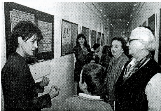
Učenici i umirovljenici zajedno na izložbi Od pločice do kompjutera

Korisnici: djeca osnovnoškolske dobi, mladež, starije osobe