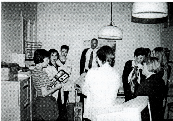
Seminar Muzeji i galerije suvremene umjetnosti – poslije rata , upoznavanje sudionika s radom MDC-a