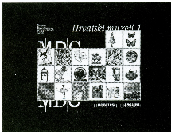
CD-ROM Hrvatski muzeji 1