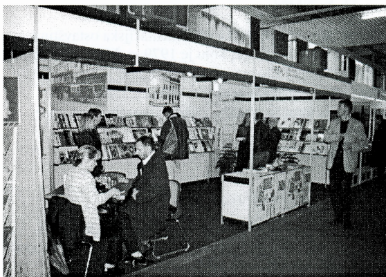
18. godišnja izložba izdavačke djelatnosti hrvatskih muzeja i galerija