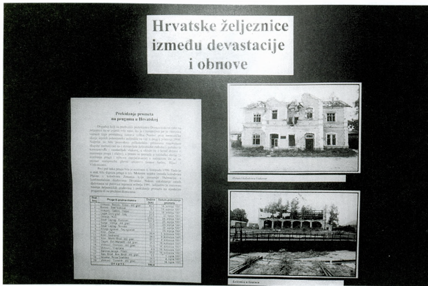
Dio postava izložbe Hrvatske željeznice između devastacije i obnove