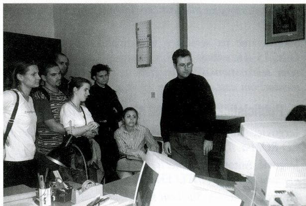
Studenti Odsjeka za informacijske znanosti Filozofskog fakulteta na prezentaciji obrade Zbirke inozemnih poštanskih maraka u programu PROMUS