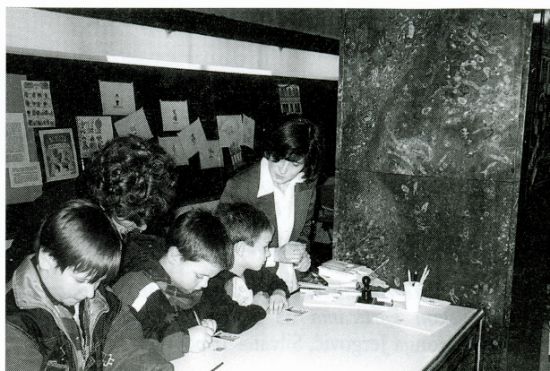
Muzejska radionica Likovi iz crtića na poštanskim markama i telefonskim karticama

Vrsta izložbe: edukativno-informativna, skupna