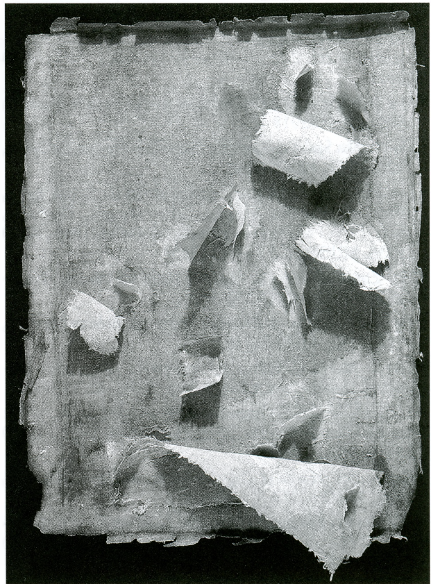
Nepoznati autor, Sv. Magdalena — slika tijekom restauracije