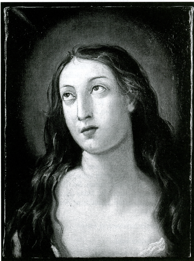
Nepoznati autor, Sv. Magdalena — slika nakon restauracije