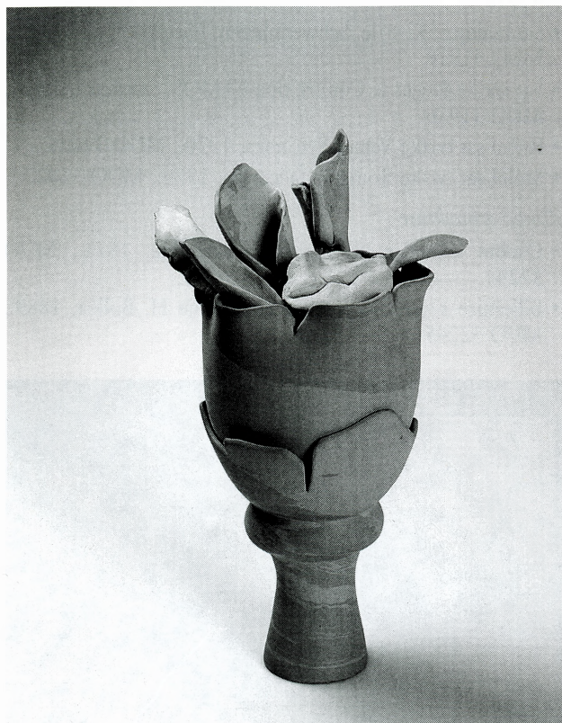
Višnja Jelačić, Agatna forma , 1985.