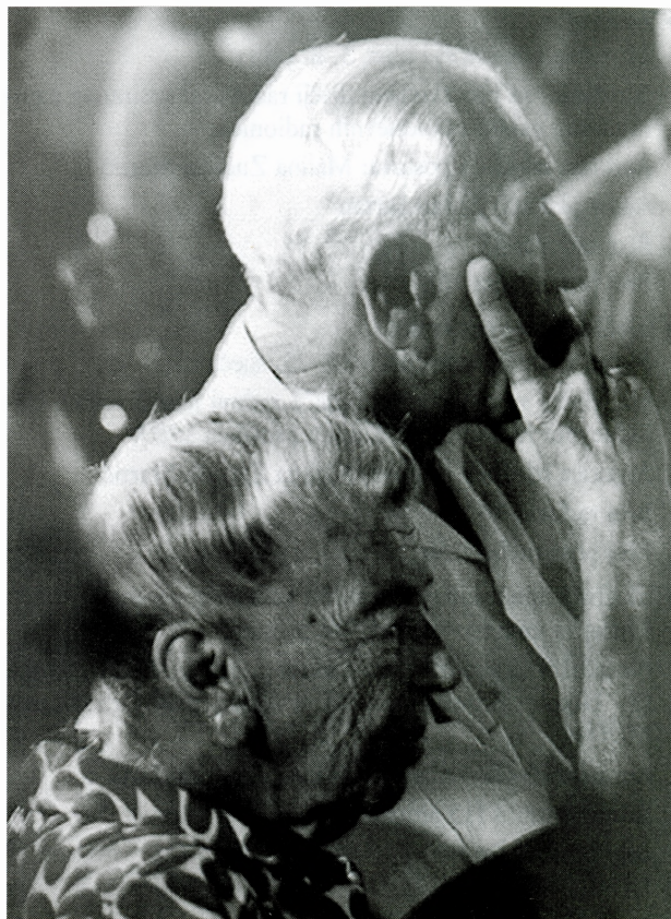
Krešimir Tadić, Zajednički život , 1968.