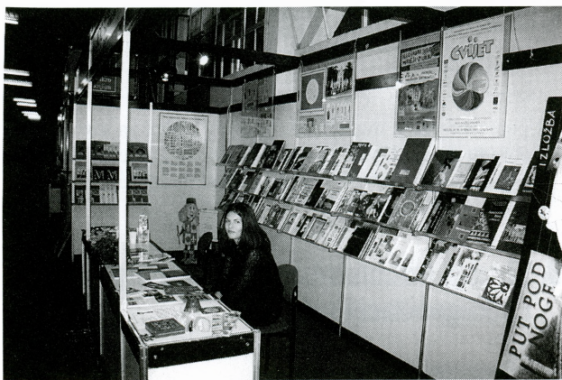
19. godišnja izložba izdavačke djelatnosti hrvatskih muzeja i galerija