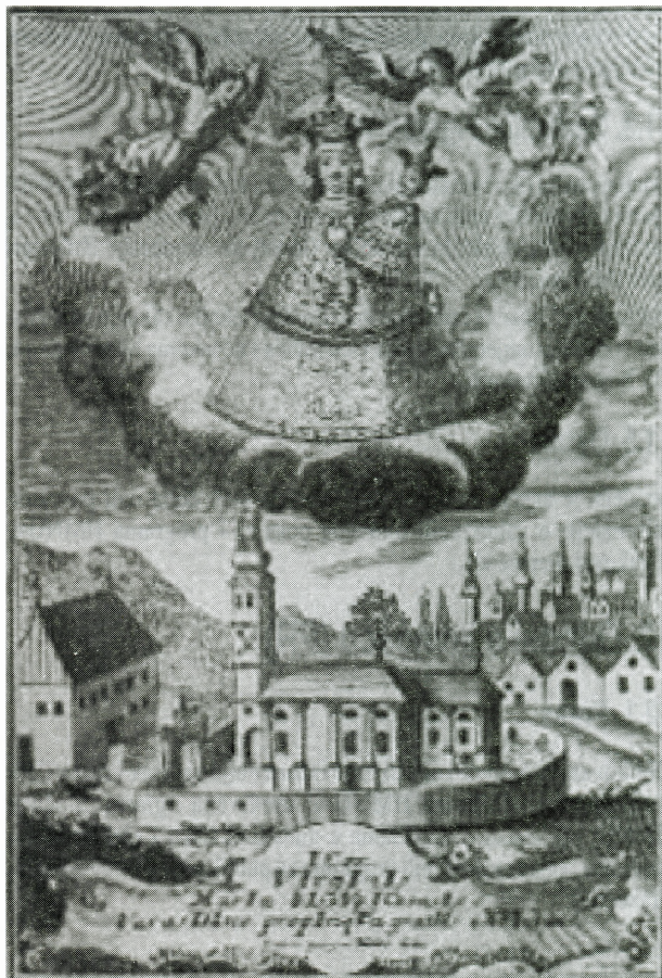
J. G. Walter, Majka Božja Biškupec ; 1646.