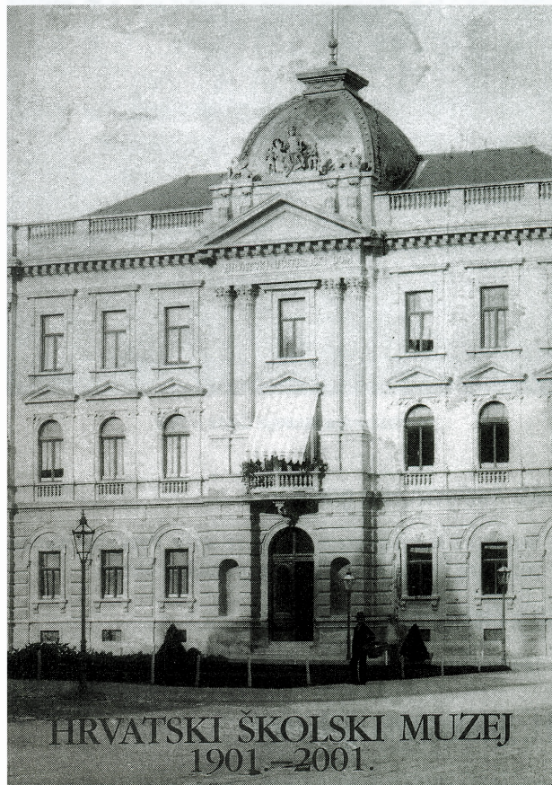
Naslovnica kataloga stalnog postava, Hrvatski školski muzej 1901 - 2001.