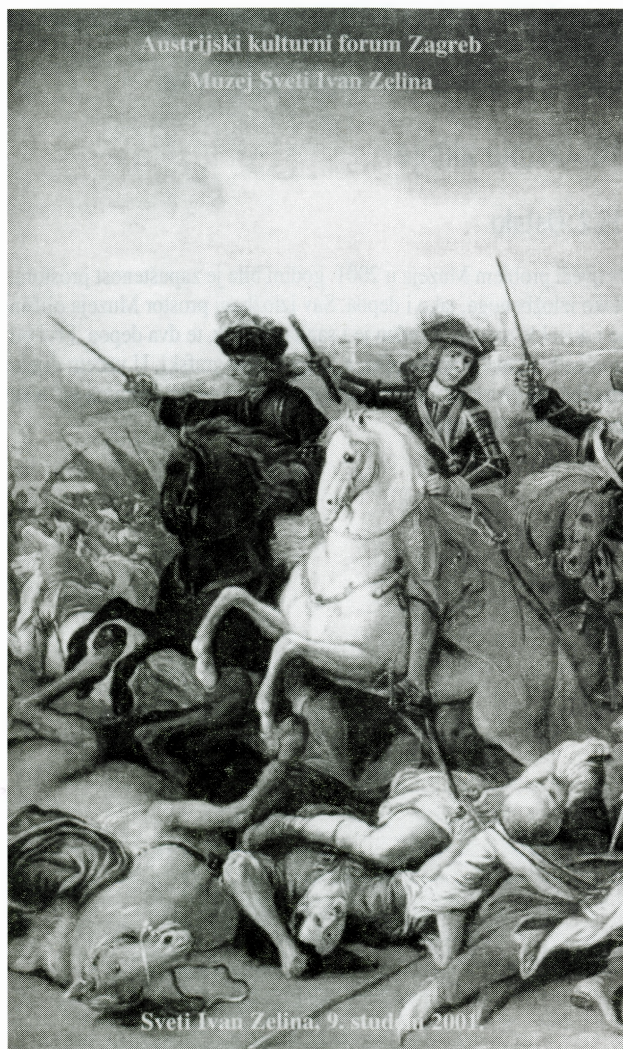
Naslovnica deplijanta izložbe Slike iz Hrvatske i Bosne

kamena plastika. Uz izložbu građe postavljeni su panoji s fotografijama arheoloških radova te je održano prigodno predavanje.