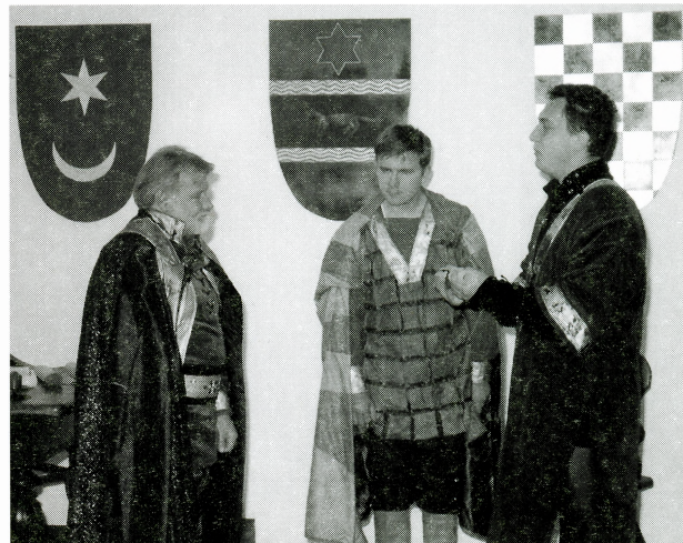
Igrokaz Kraljevo trgovište nek Zelina bude

Domjenak je održan 28. prosinca 2001. a na njega je pozvan veći broj uzvanika iz kulturnoga i javnog života grada. Za tu prigodu u Zelingradu je izrađena posebna pozornica s koje su glumci zelinskoga amaterskog kazališta ZAMKA recitirali srednjovjekovnu trubadursku poeziju. Zelingrad je bio svečano ukrašen brojnim zastavama i bakljama te štitovima s heraldičkim obilježjima. Kako bi se što bolje dočarao ondašnji ambijent, u prostor Zelingrada postavljeni su likovi vitezova i srednjovjekovnih dama izrađeni u prirodnoj veličini.