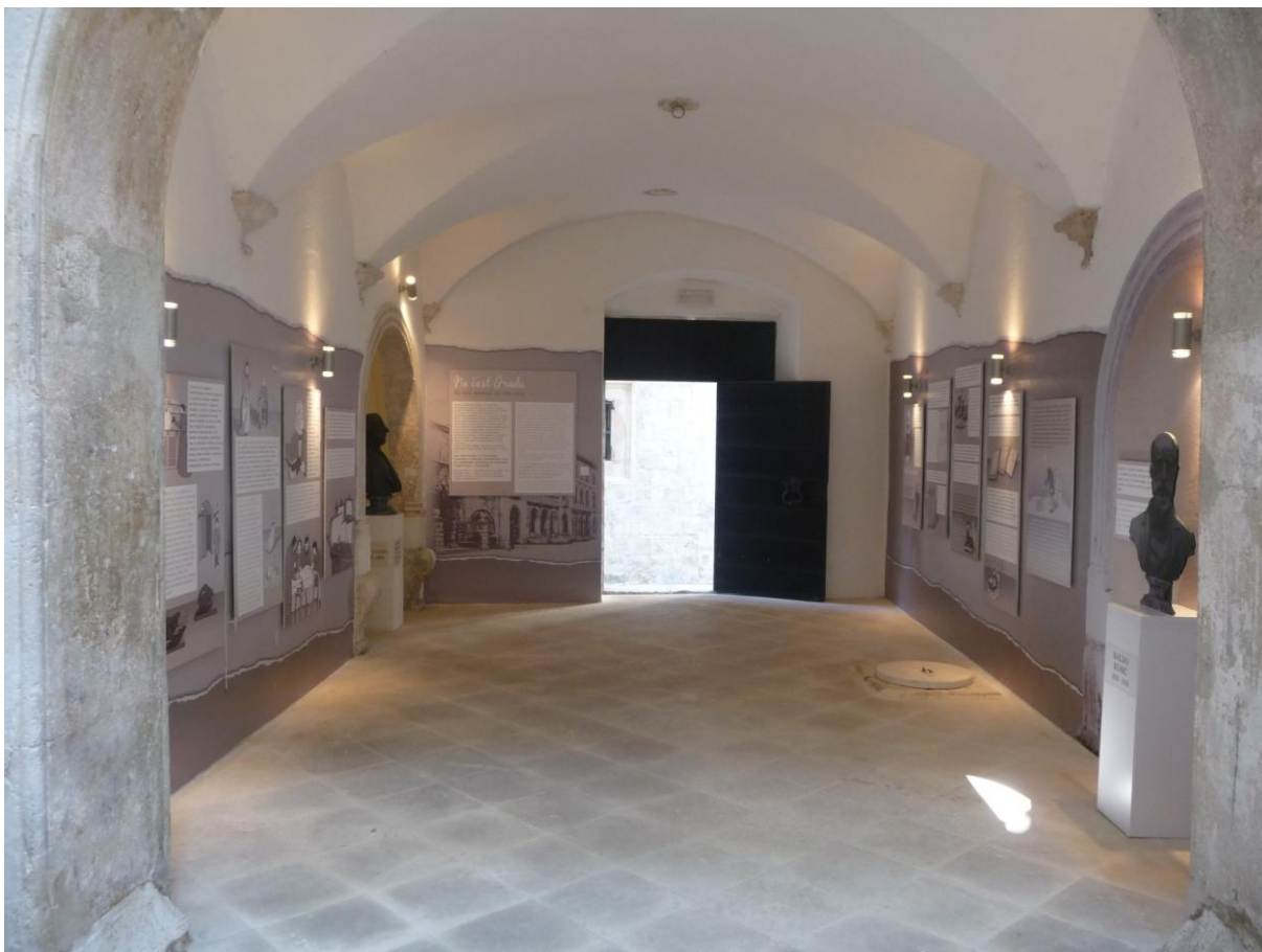
Slika 3. Izložba „Na čast Gradu“