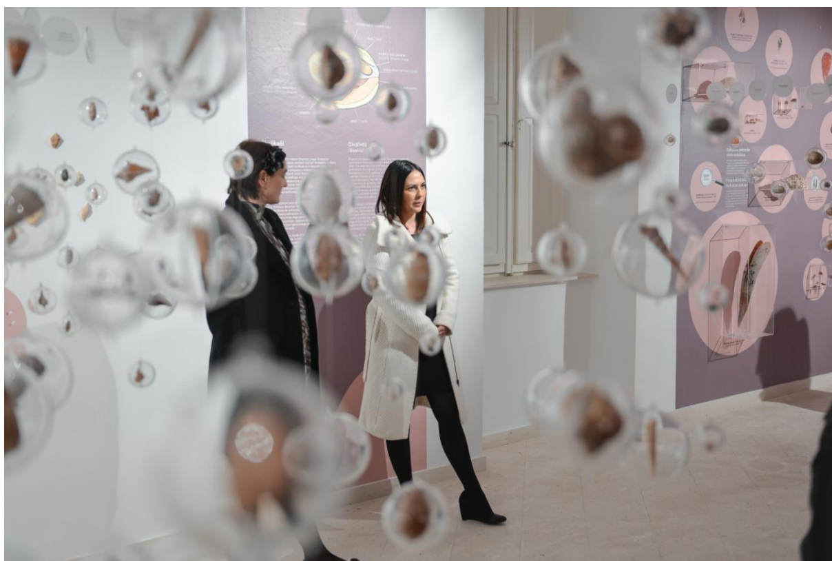
Slika 2. Otvorenje izložbe “Šum mora”