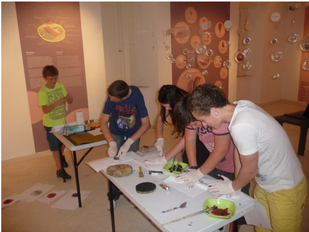
Slika 8. Uzimanje otisaka godova na poprečnim presjecima drva u sklopu nastavne jedinice „Mala škola dendrokronologije“