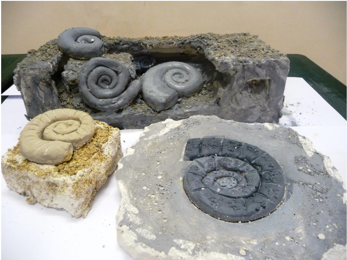
Slika 10. Amoniti nastali u radionici „Zaroni u prošlost“