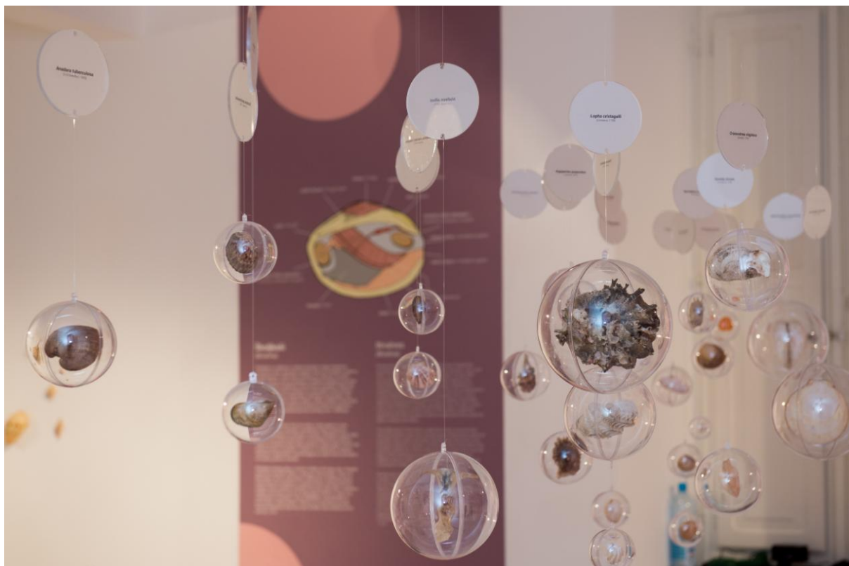
Slika 1. Detalj izložbe „Šum mora“