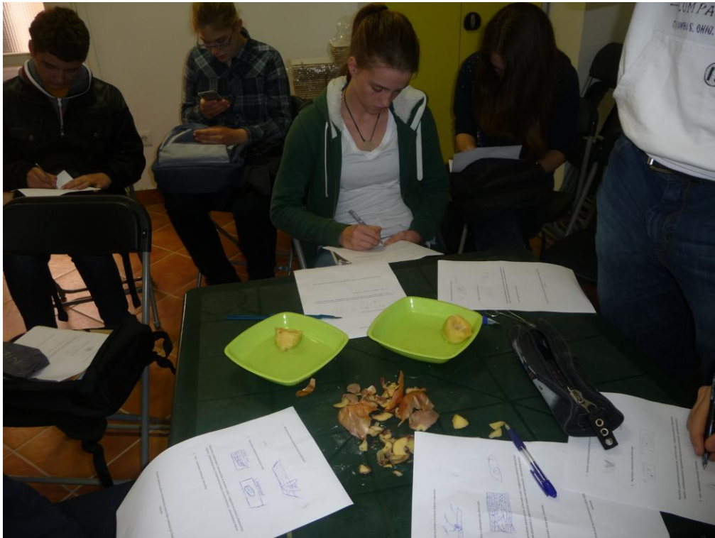
Slika 7. Samostalno izvođenje pokusa i bilježenje promjena u nastavnoj jedinici „Biljna fiziologija kroz pokuse“