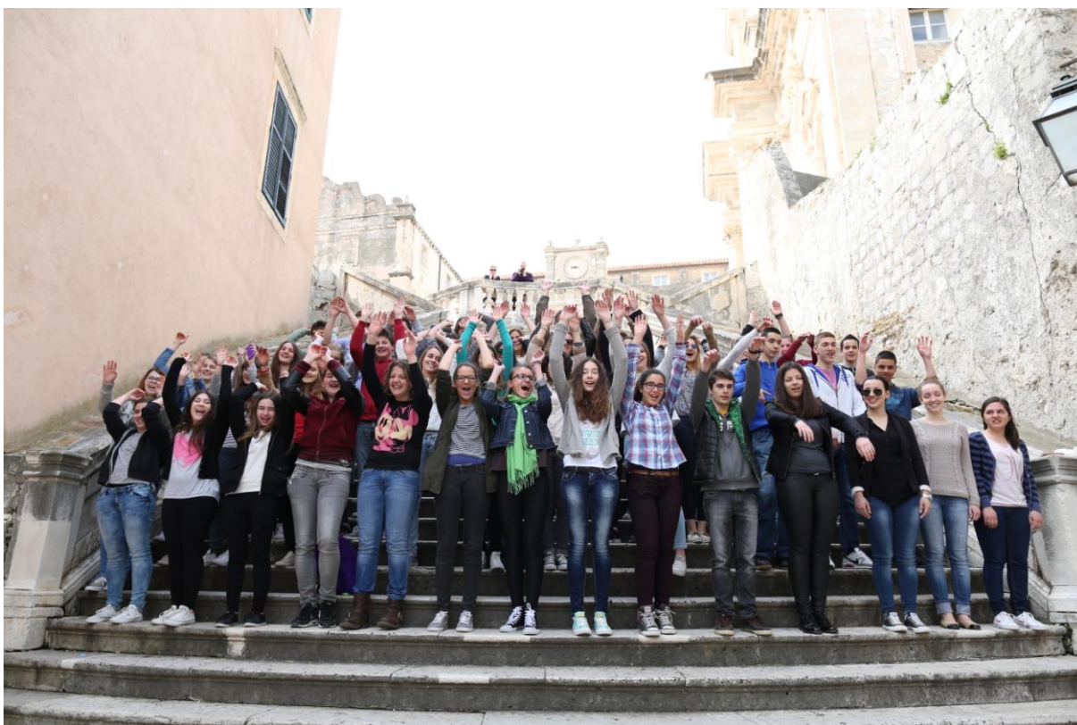
Slika 13. Fotografija „Valovi“ na skalinima Uz Jezuite (Festival znanosti 2014.)