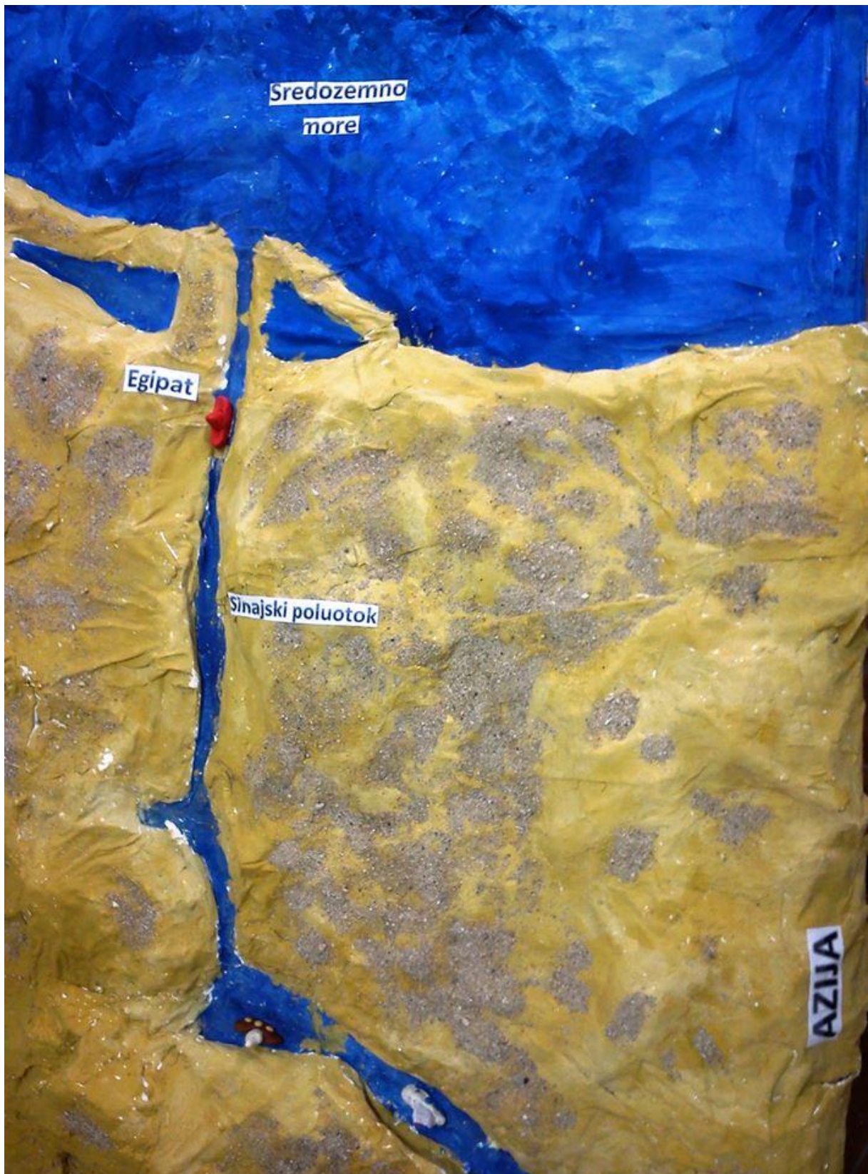
Slika 9. Maketa reljefa Sueskog kanala