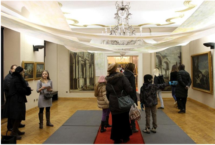
Sl. 29. Noc muzeja