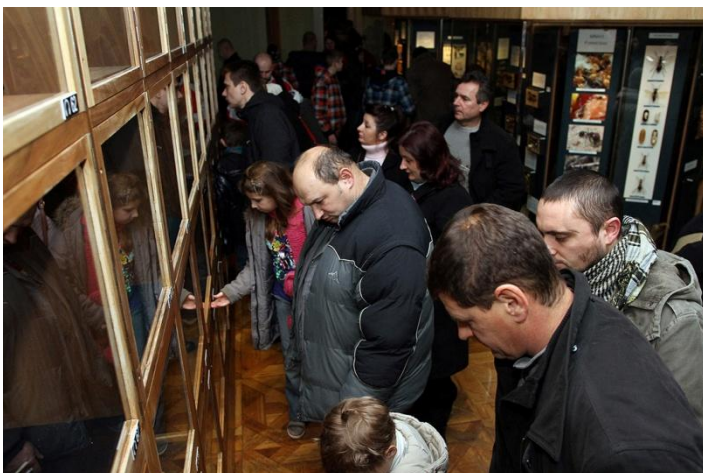
Sl. 25. Noc muzeja