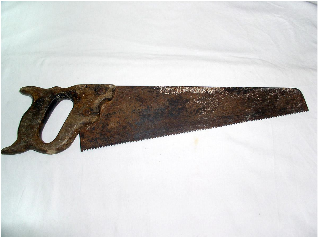
Sl. 2. Pila za obradu drveta, darovani predmet za Etnografski odjel GMV-a