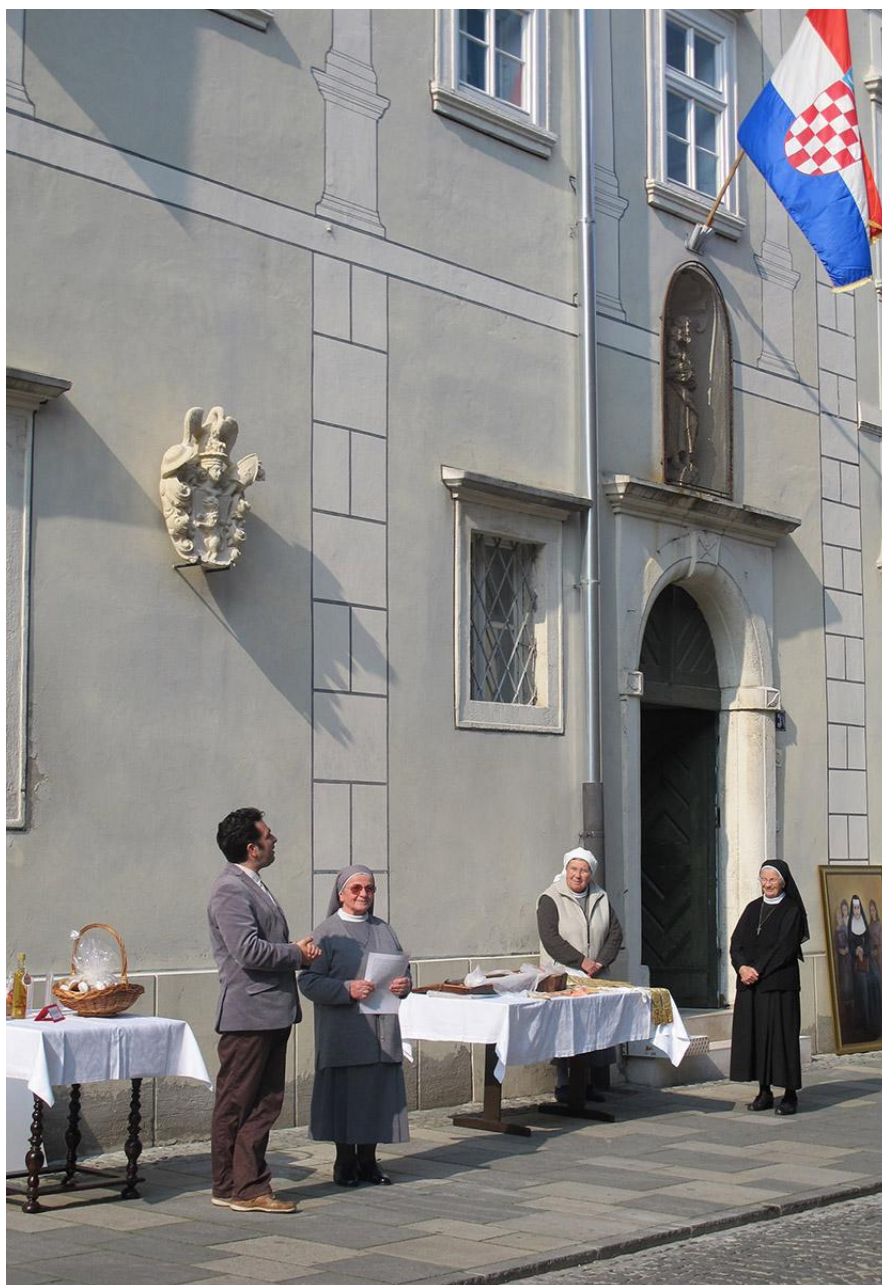
Sl. 10. Postavljanje replike grba opata S. Szinersperga na pročelje zgrade uršulinskog samostana u Varaždinu, 7. listopada 2014.