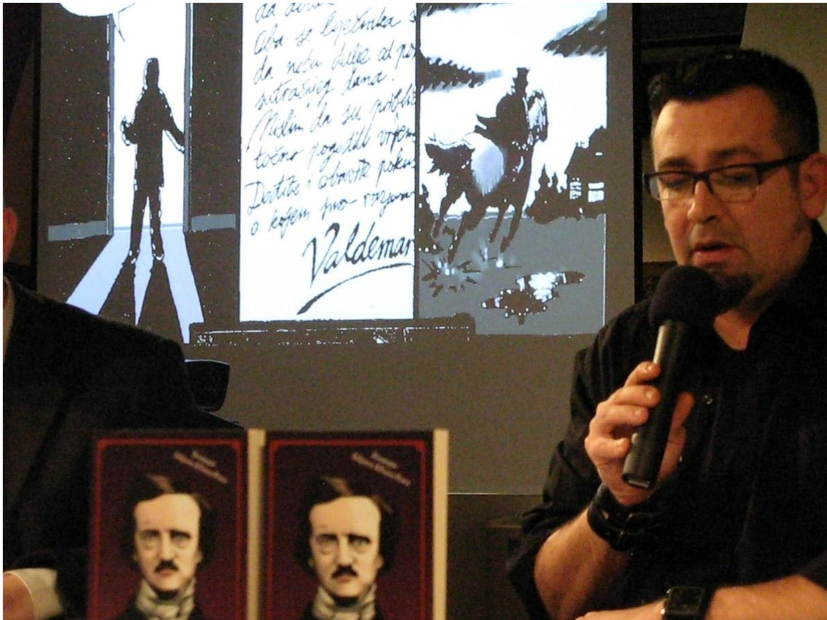
Sl. 12. Srijeda u Muzeju E. A. Poe - čovjek koji se nije smijao, GMV Palača Herzer, 5. veljače 2014.