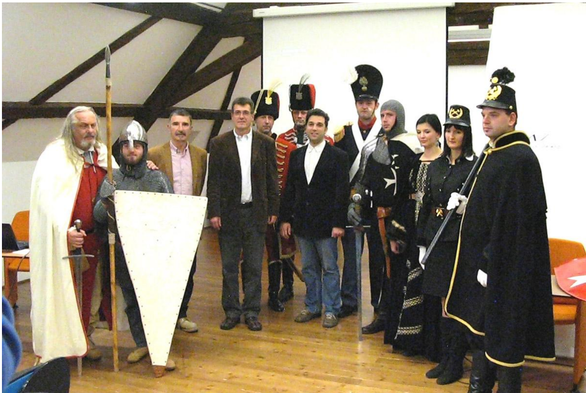
Sl. 14. Srijeda u Muzeju - Povijesne postrojbe Varaždinske županije, 19. studenoga 2014.