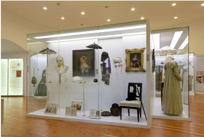
Sl. 31. Nova muzeološka cjelina Kultura odijevanja