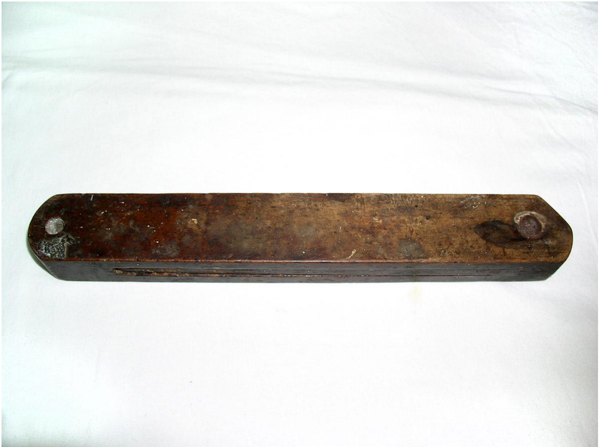
Sl. 1. Drvodjelsko pomagalo, darovani predmet za Etnografski odjel GMV-a