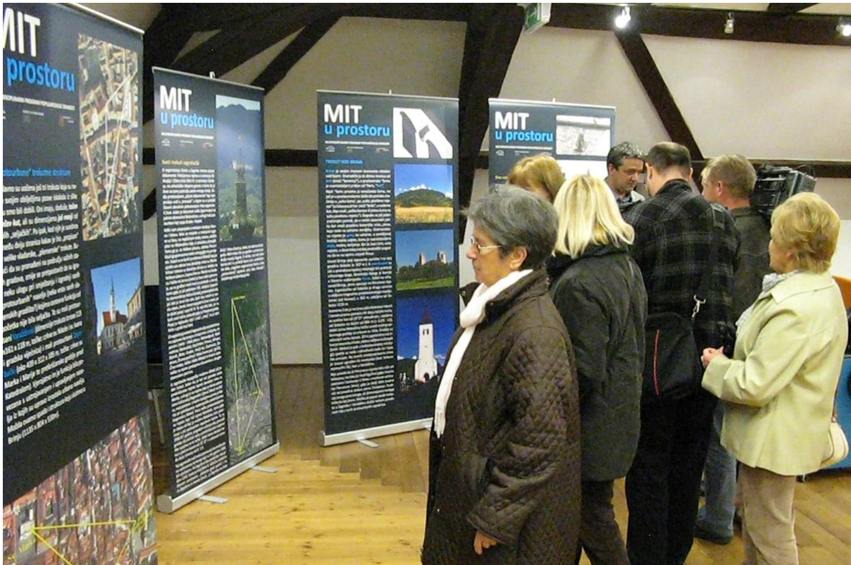
Sl. 13. Srijeda u Muzeju Mit u prostoru, GMV Palača Herzer, 29. listopada 2014.