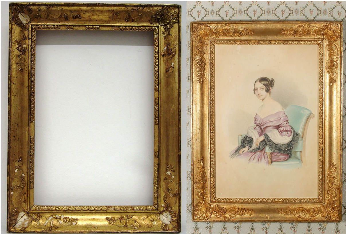
Sl. 33. Daša Suić - okvir prije i poslije zahvata, kpo 44