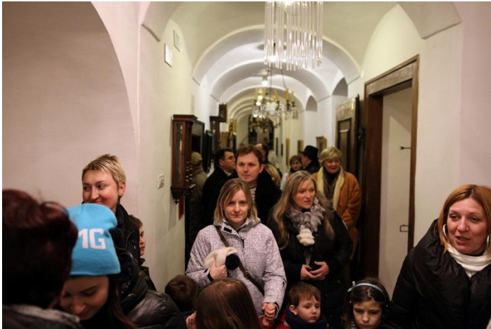
Sl. 26. Noc muzeja