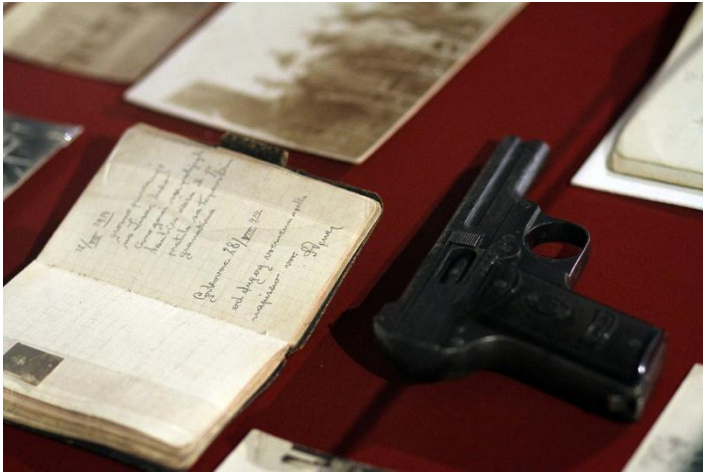
Sl. 23. „Narod u nevolji“