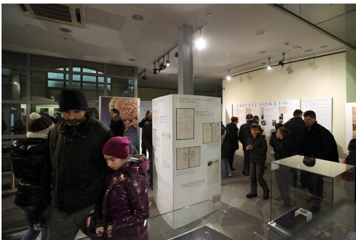
Sl. 24. Noc muzeja