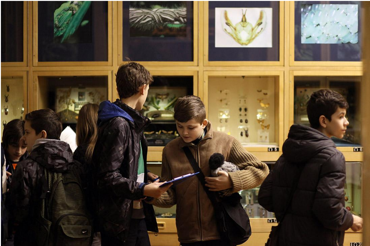
Sl. 15. Edukativna radionica O kukcima u Svijetu kukaca