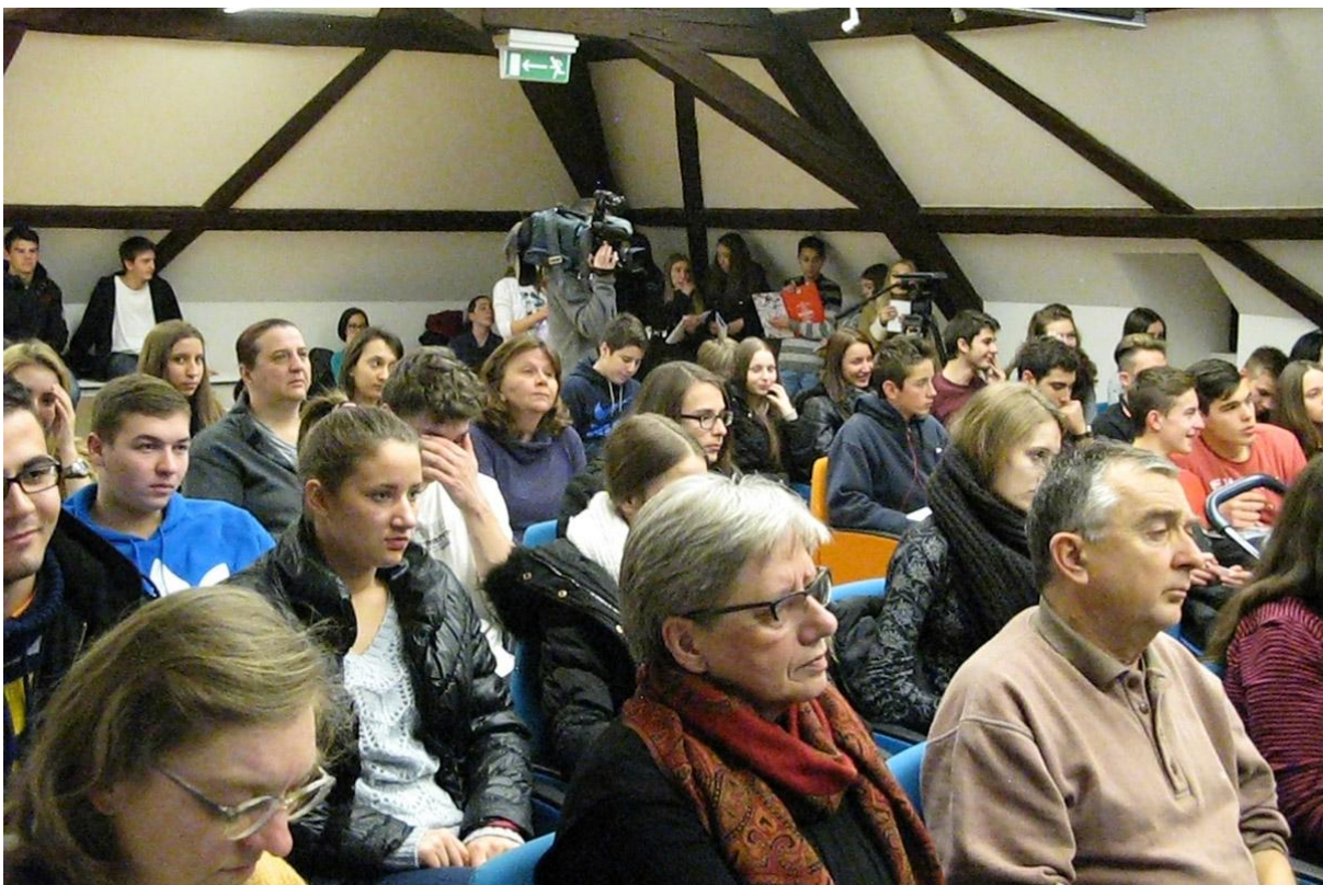
Sl. 5. 60. godišnjica djelovanja Entomološkog odjela GMV-a, palača Hercer