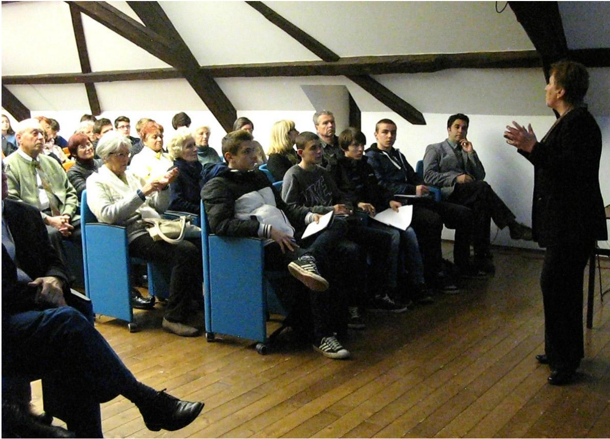
Sl. 4. 60. godišnjica djelovanja Entomološkog odjela GMV-a, palača Hercer