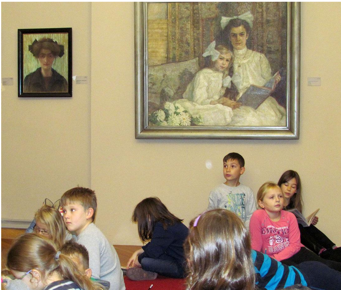
Sl. 18. Edukativna radionica uz izložbu „Nasta Rojc - Kritička retrospektiva“ I