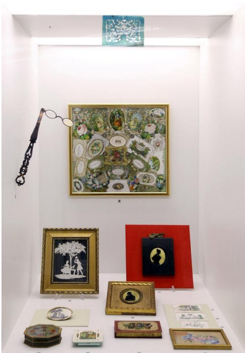
Sl. 30. Nova muzeološka cjelina „Kultura odijevanja“