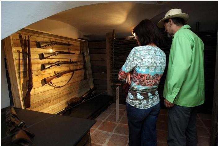
Sl. 21. „Narod u nevolji“