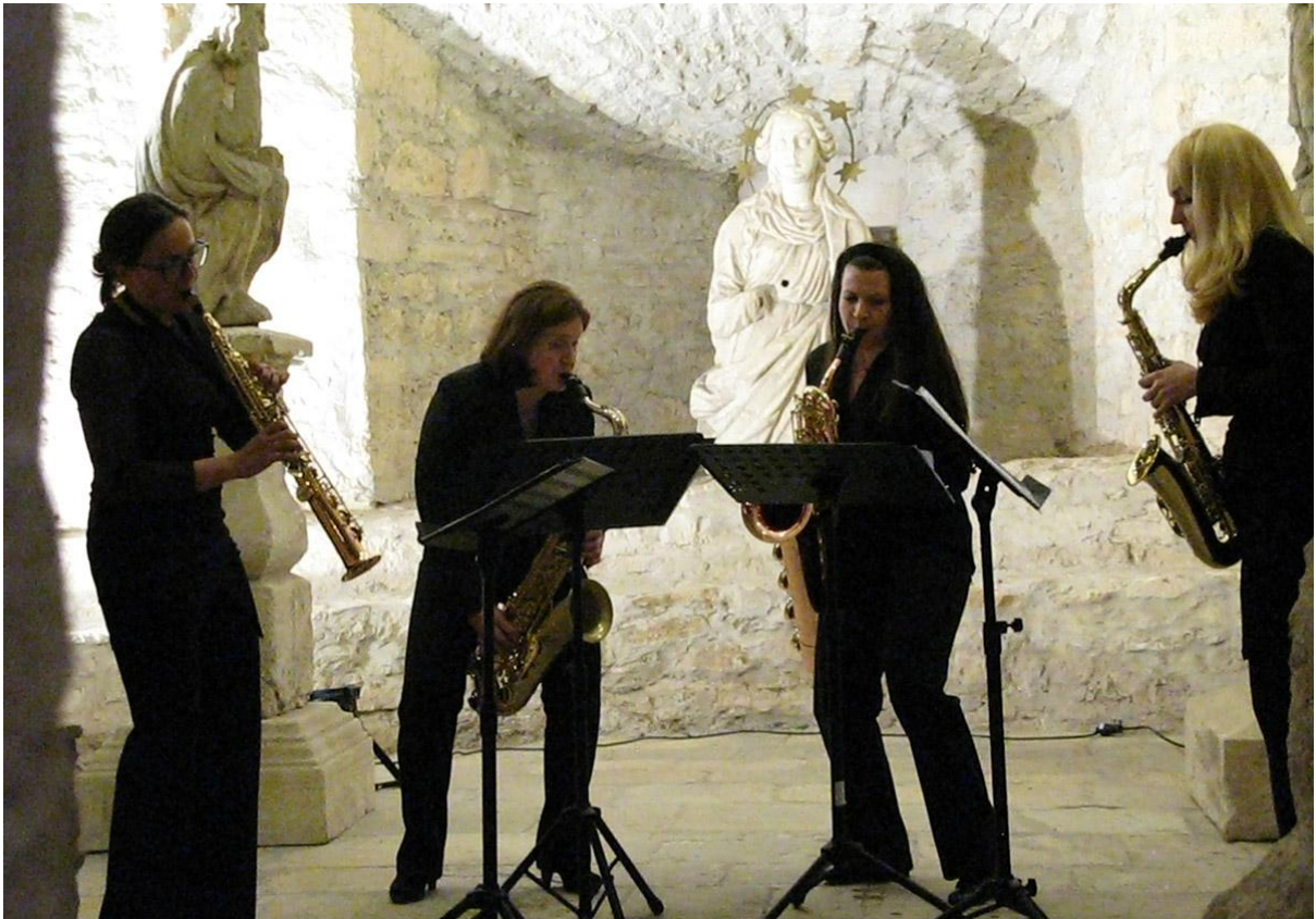
Sl. 3. 8. varaždinske muzejske svečanosti - LadieSaxophone Quartet, 16. svibnja 2014.