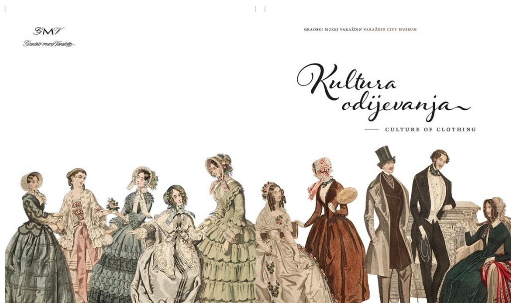
Sl. 32. Vodic Kultura odijevanja