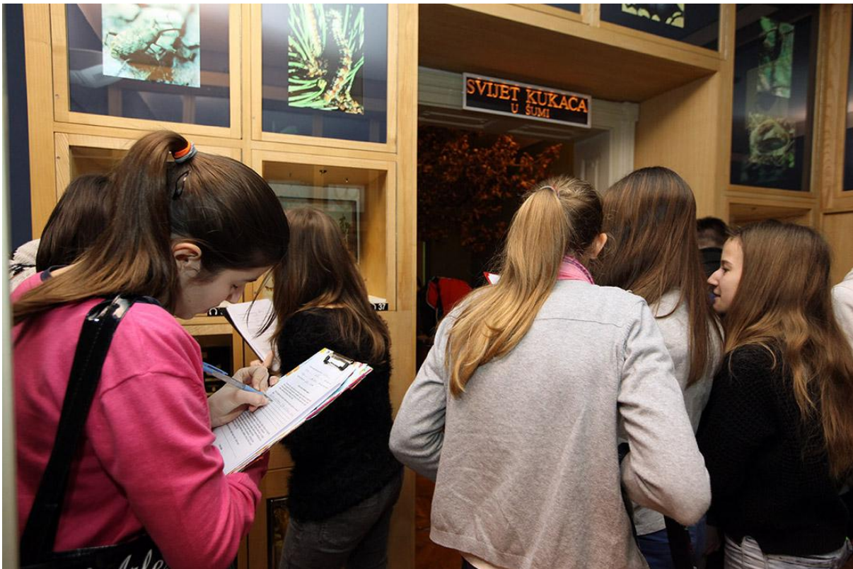
Sl. 16. Edukativna radionica O kukcima u Svijetu kukaca