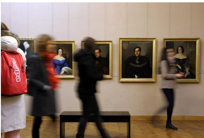
Sl. 28. Noc muzeja