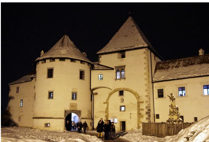
Sl. 27. Noc muzeja