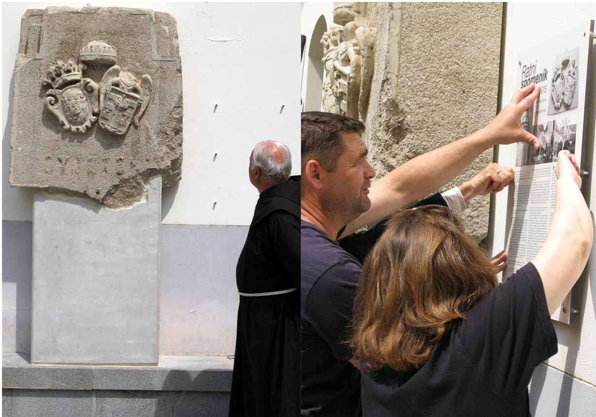
Sl .9. Postavljanje obnovljenog dijela ratnog spomenika iz 1915.g., Franjevački trg u Varaždinu