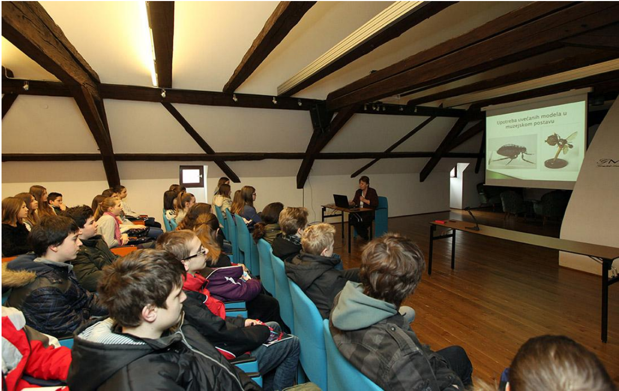
Sl. 17. Edukativna radionica O kukcima u Svijetu kukaca