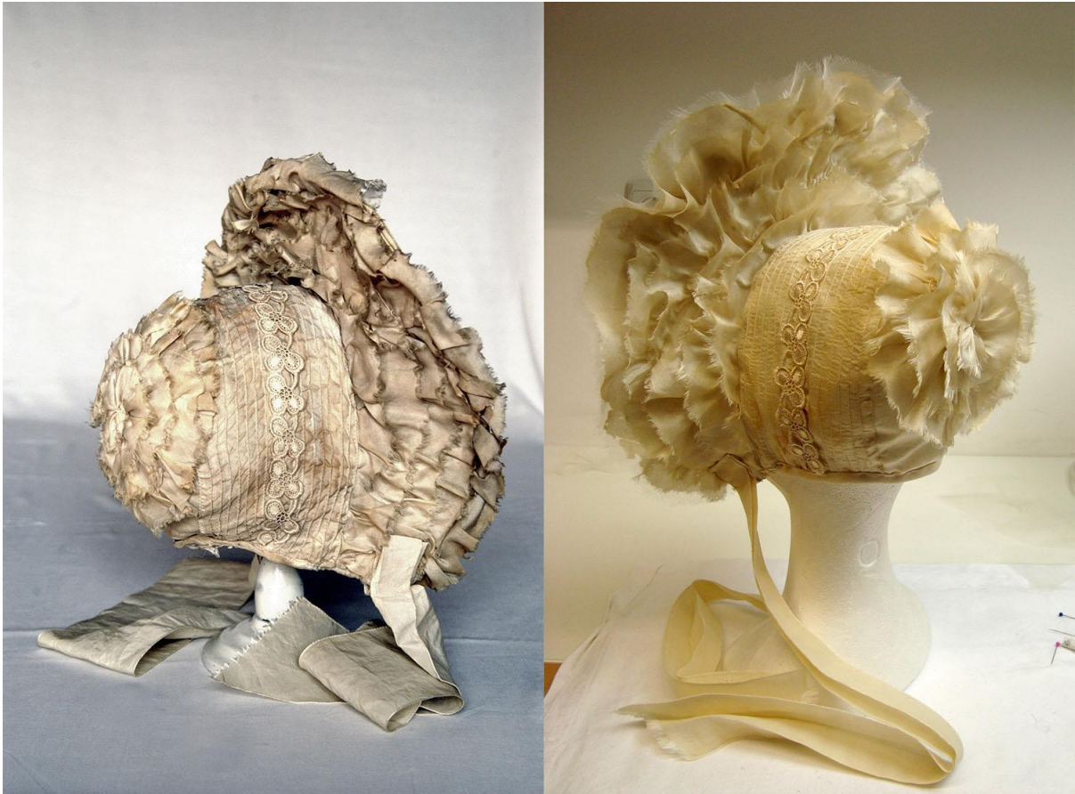
Sl. 34. Melita Krnoul - ženski šešir prije i poslije restauracije