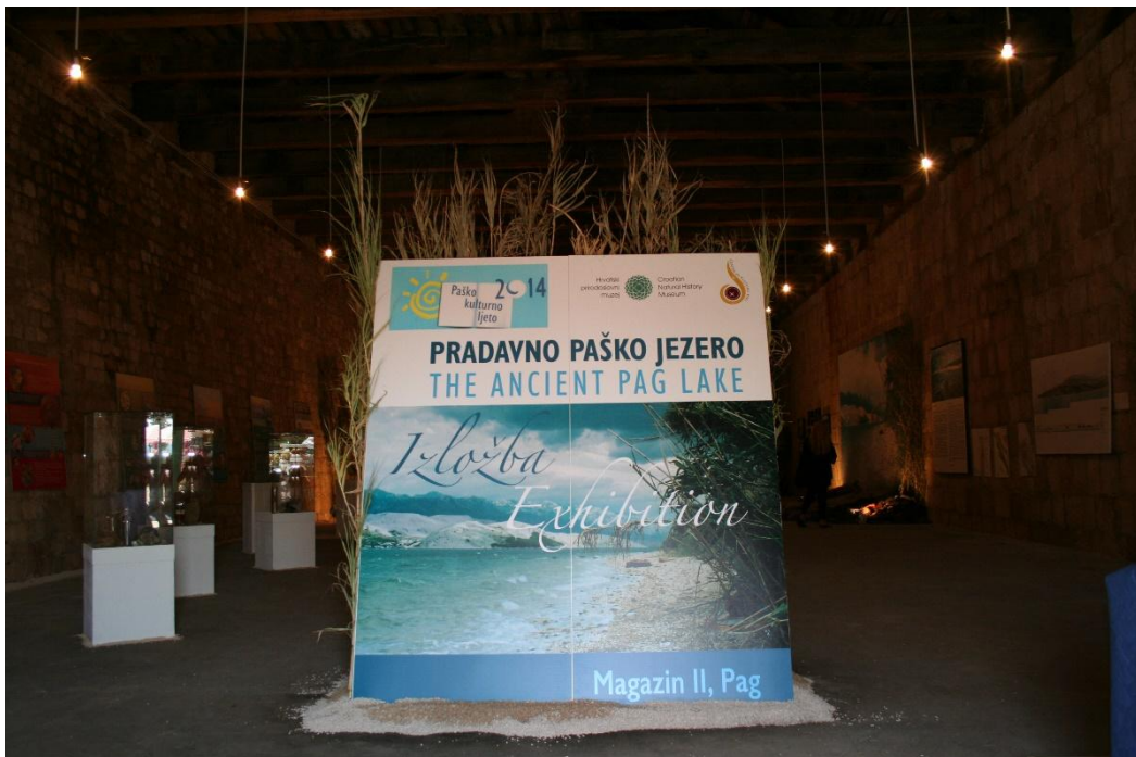
Sl. 6. Izložba „Pradavno paško jezero“ u Pagu