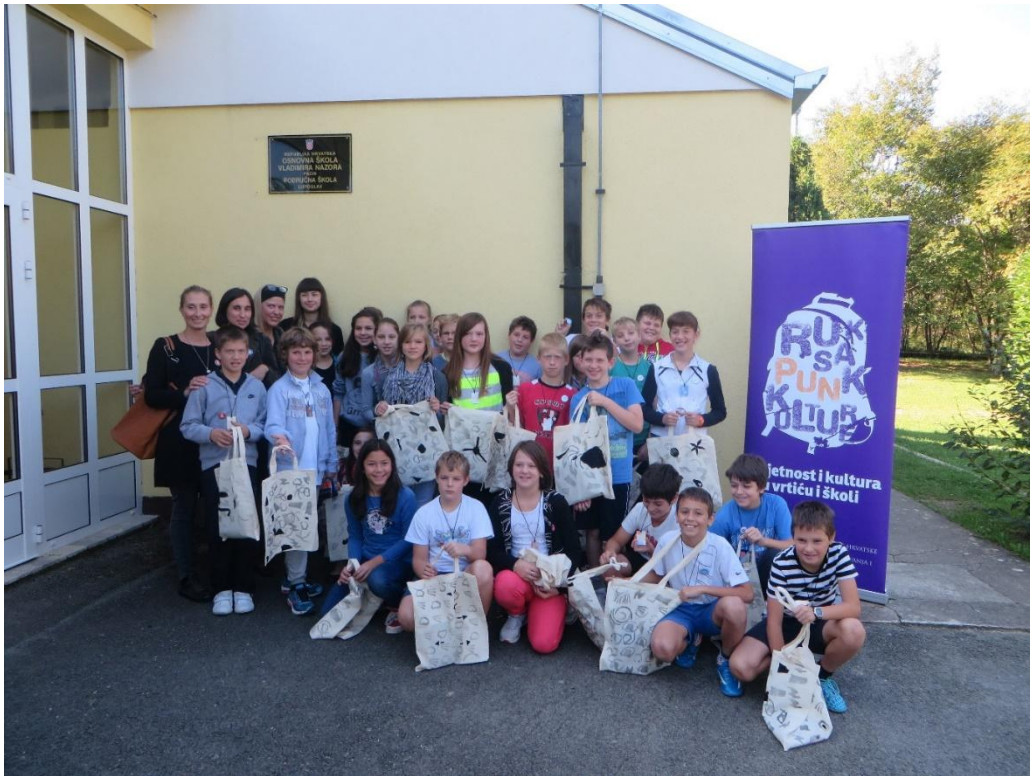
Sl. 15. Akcija Ministarstva kulture „Ruksak pun kulture“ u područnoj školi Lupoglav