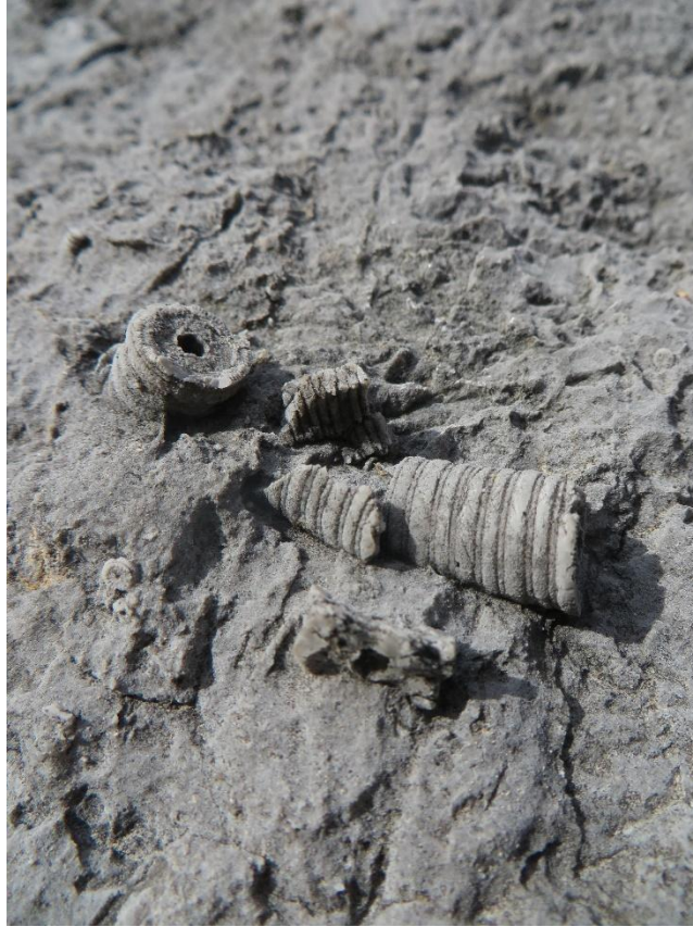
Sl. 1. Terenska istraživanja Donje Pazarište, Tulove grede