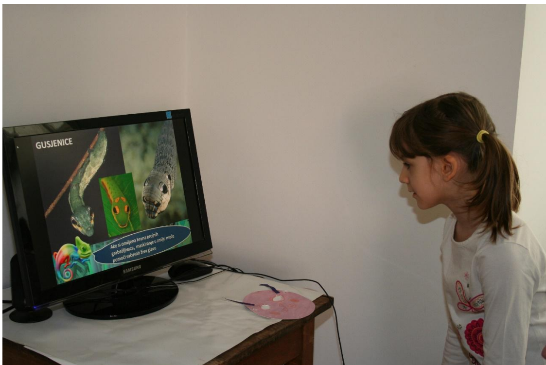
Sl. 13. Radionica za djecu „Naturfašnik 2014.“