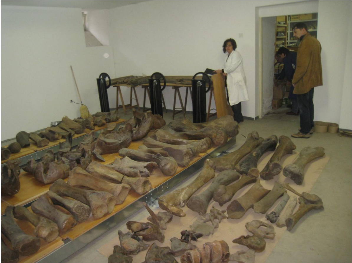
Sl. 5. Revizija Osteološke zbirke