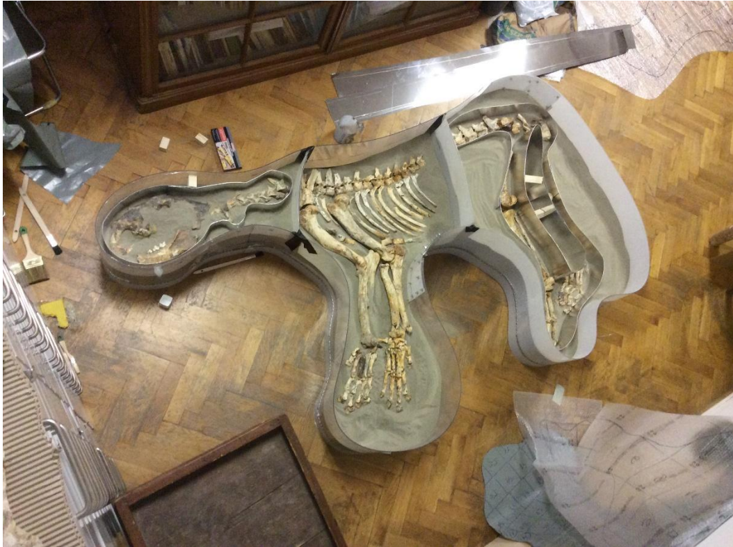
Sl. 7. Prikaz špiljskog lava Panthera spelaea – izrada kalupa