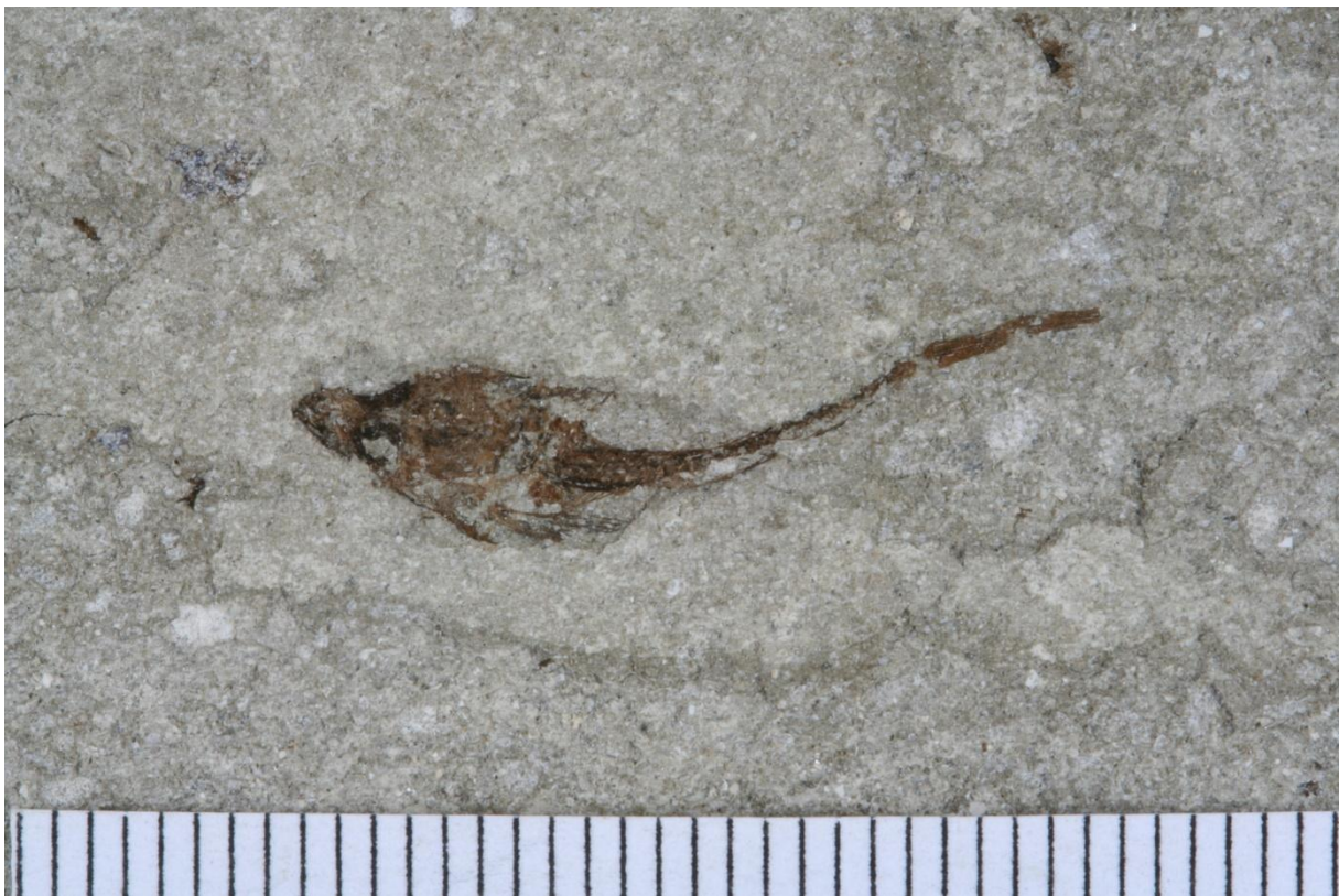
Sl. 4. Fossilna riba Callionymus macrocephalus