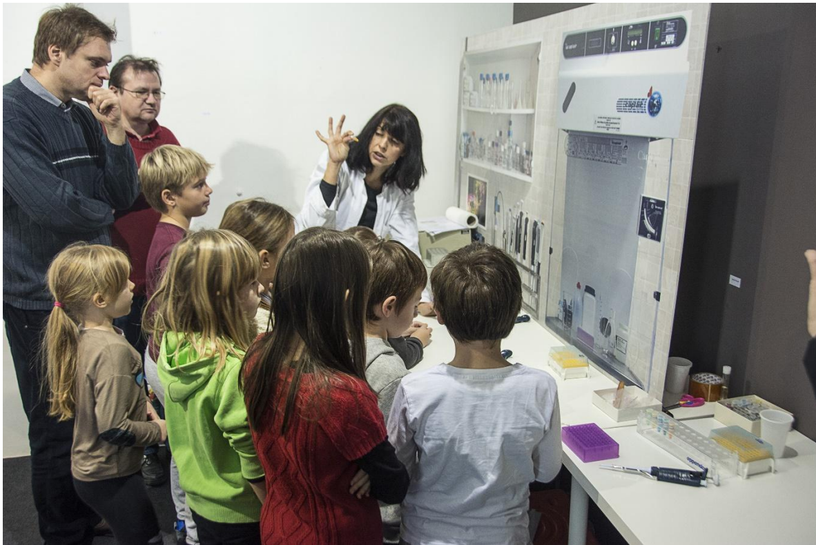
Sl. 17. Edukativna radionica "CSI:HPM – Zločin u kokošinjcu"