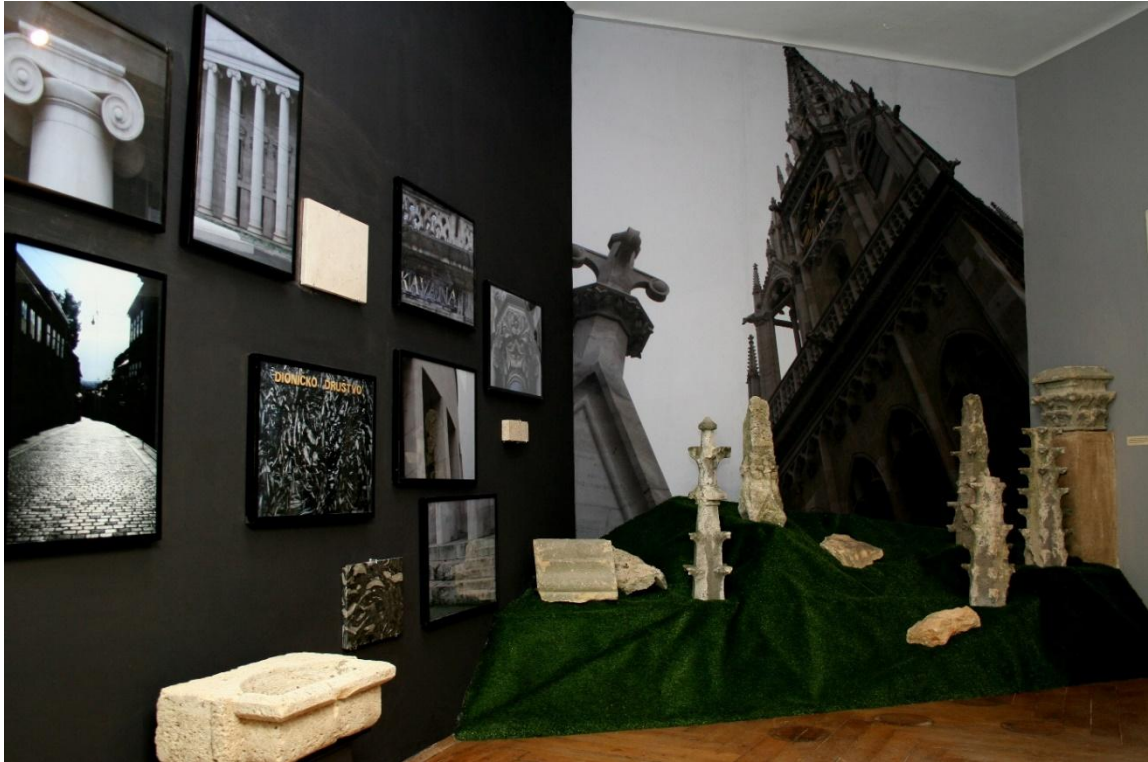
Sl. 11. Izložba „Zagrebačkim ulicama... Zagreb u kamenu“