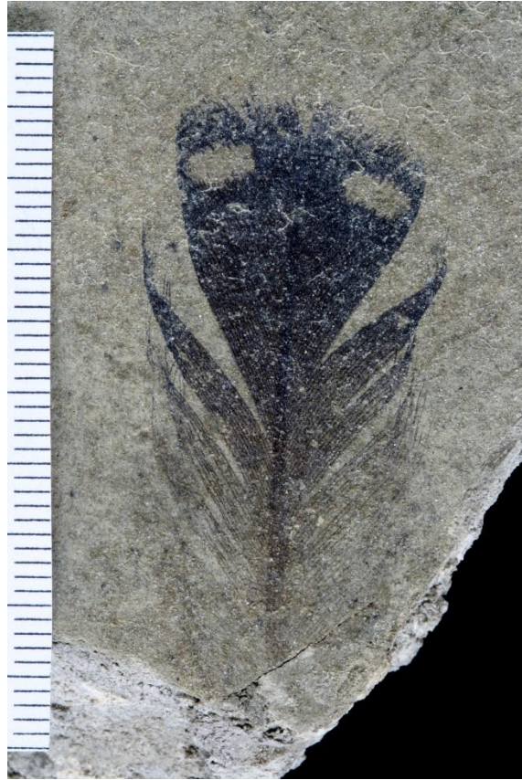
Sl. 3. Fossilno pero Gavia sp.