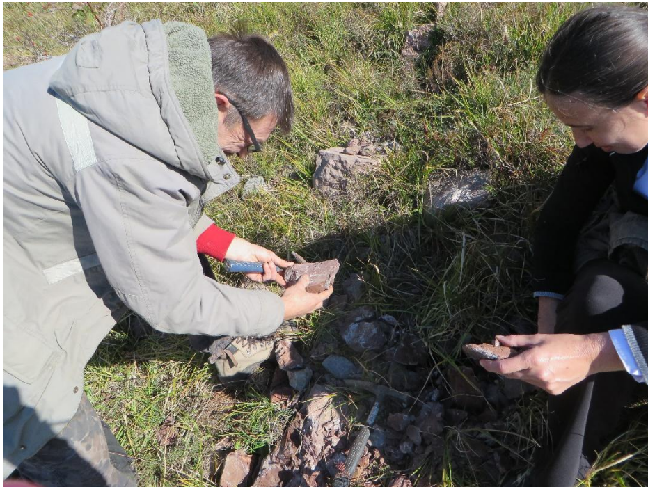
Sl. 2. Terenska istraživanja Donje Pazarište, Tulove grede