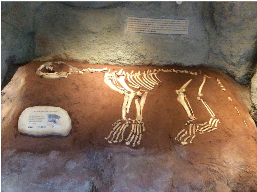
Sl. 8. Prikaz špiljskog lava Panthera spelaea u zagrebačkom Zoološkom vrtu