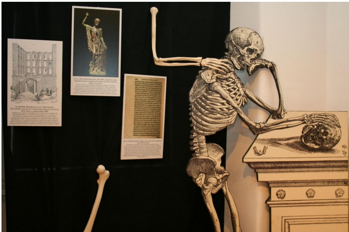
Sl. 12. Izložba „Andreas Vesalius (1514.-1564.): razotkrivanje ljudskoga tijela u renesansi“