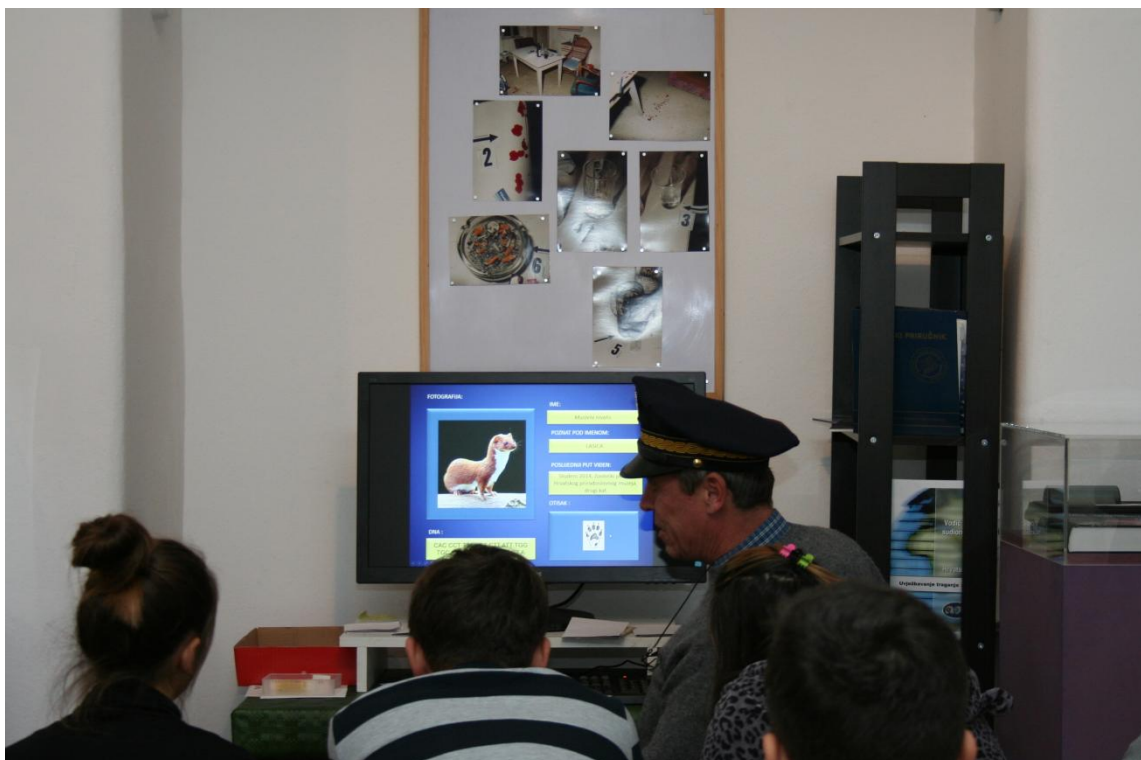
Sl. 16. Edukativna radionica "CSI:HPM – Zločin u kokošinjcu"