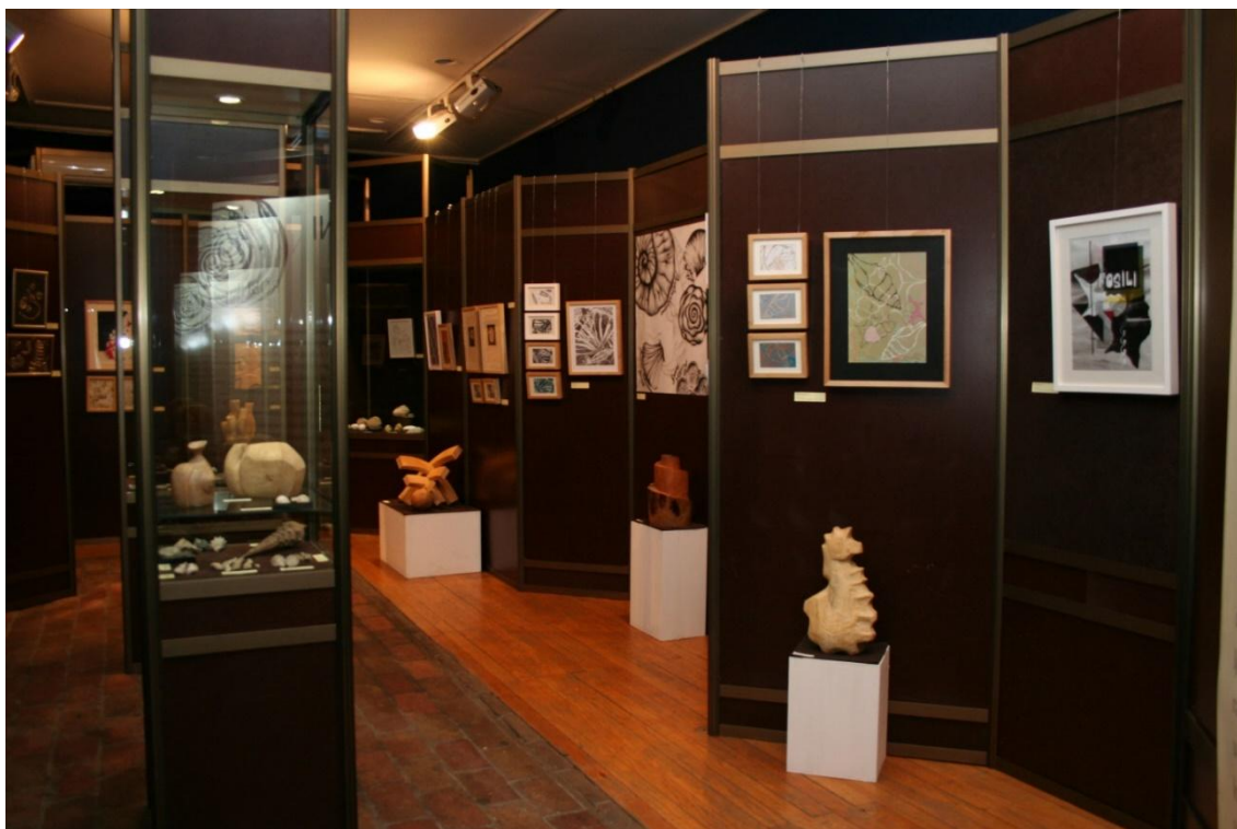
Sl. 10. Gostovanje izložbe „Čarobni svijet fosila“ u Prirodnjačkom muzeju u Beogradu