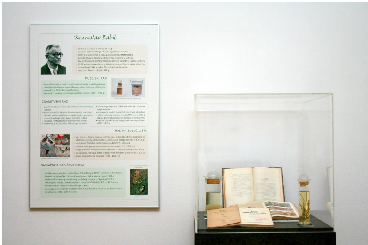
Sl. 9. Izložba „Neraskidive spone - Zoološki odjel Hrvatskoga prirodoslovnog muzeja & Zoologijski zavod PMF-a