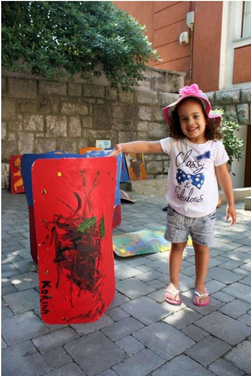
Sl. 20. Radionica povodom Dana Ad Turresa