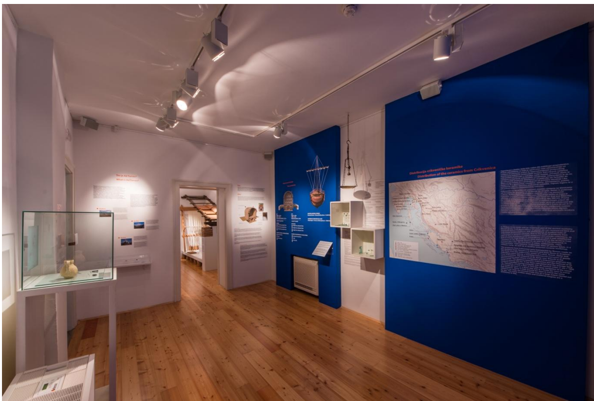
Sl. 24. Izložba „845 stupnjeva celzijusa“