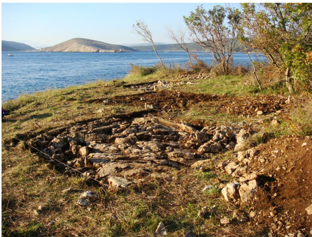
Sl. 36. Arheološka istraživanja u Jadranovu, uvala Lokvišća - prostor uništene antičke nekropole