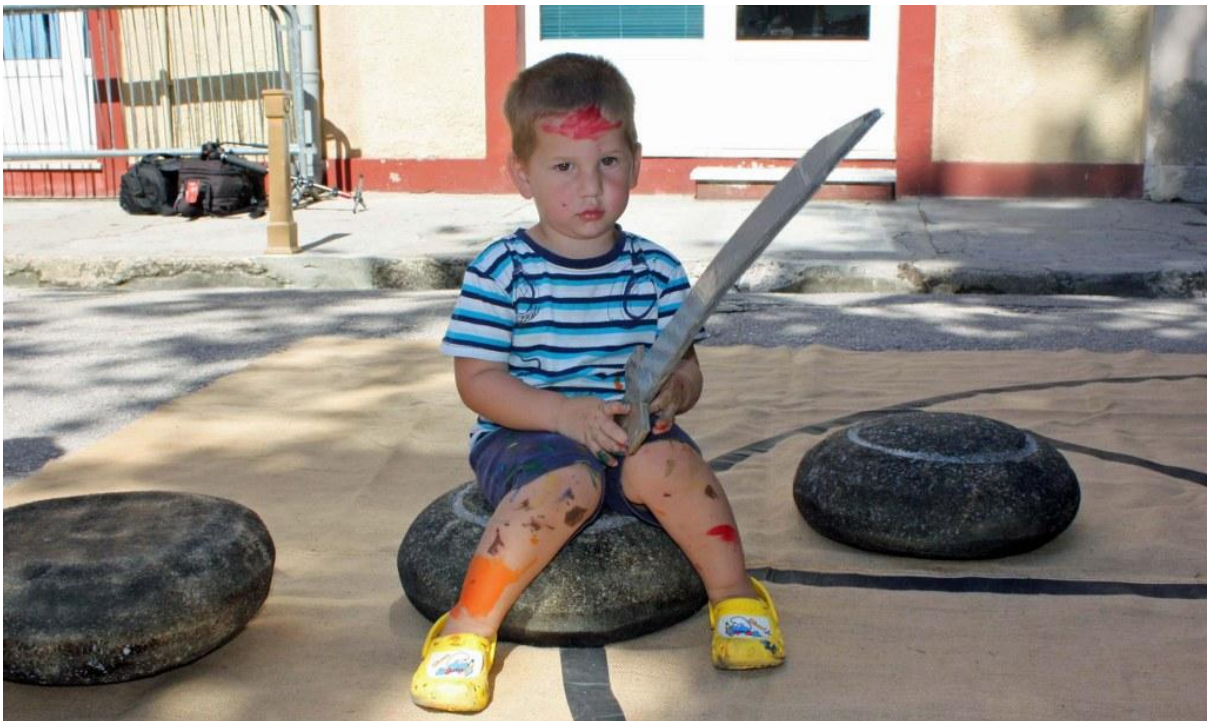
Sl. 18. Radionica povodom Dana Ad Turresa