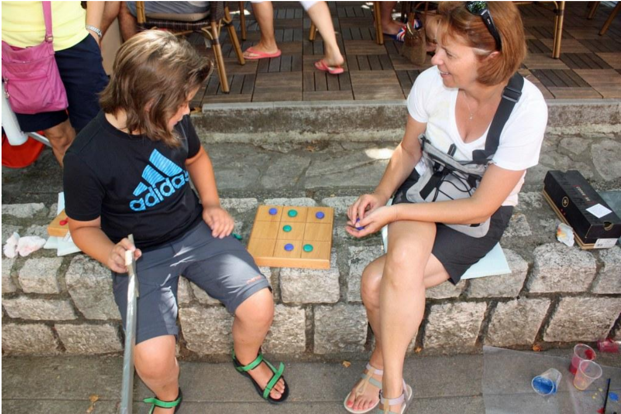
Sl. 19. Radionica povodom Dana Ad Turreza