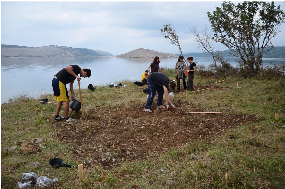
Sl. 36. Arheološka istraživanja u Jadranovu, uvala Lokvišća - prostor uništene antičke nekropole