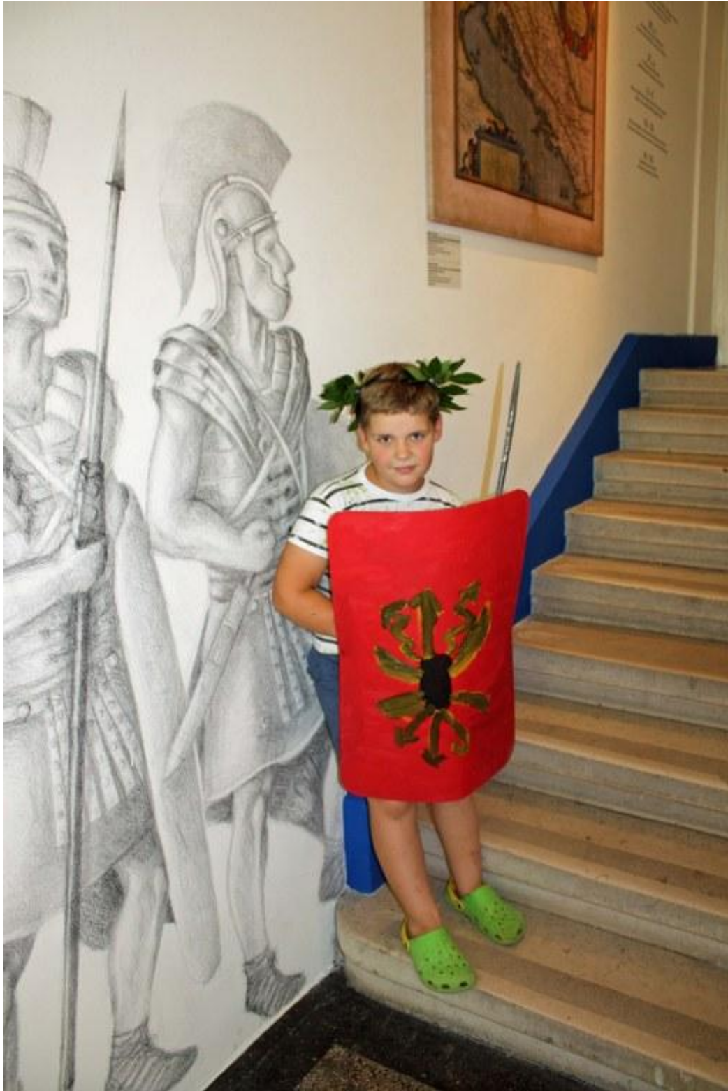
Sl. 23. Radionica povodom Dana Ad Turresa