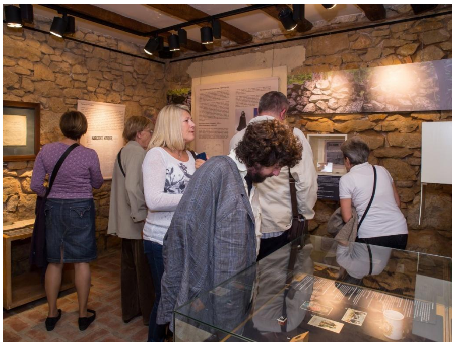
Sl. 31. Izložba „Zaboravljeni rat 1914.-1918.“