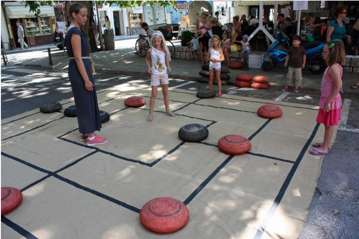
Sl. 15. Radionica povodom Dana Ad Turresa