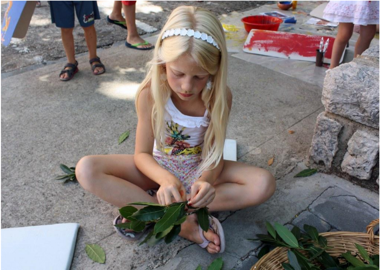
Sl. 17. Radionica povodom Dana Ad Turresa