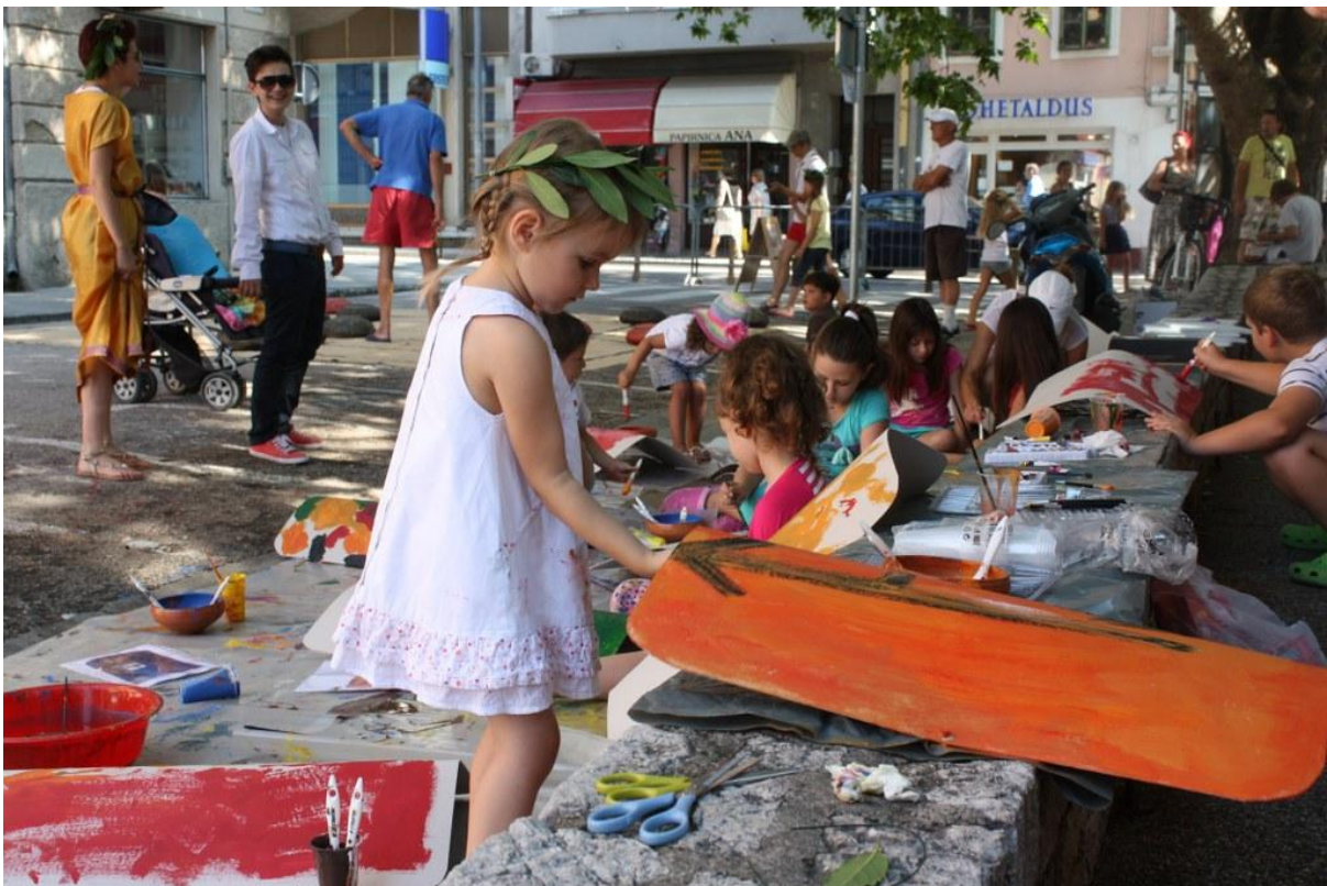
Sl. 16. Radionica povodom Dana Ad Turresa