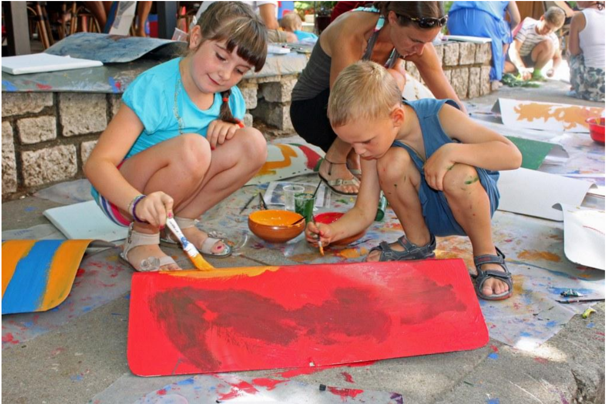
Sl. 21. Radionica povodom Dana Ad Turresa