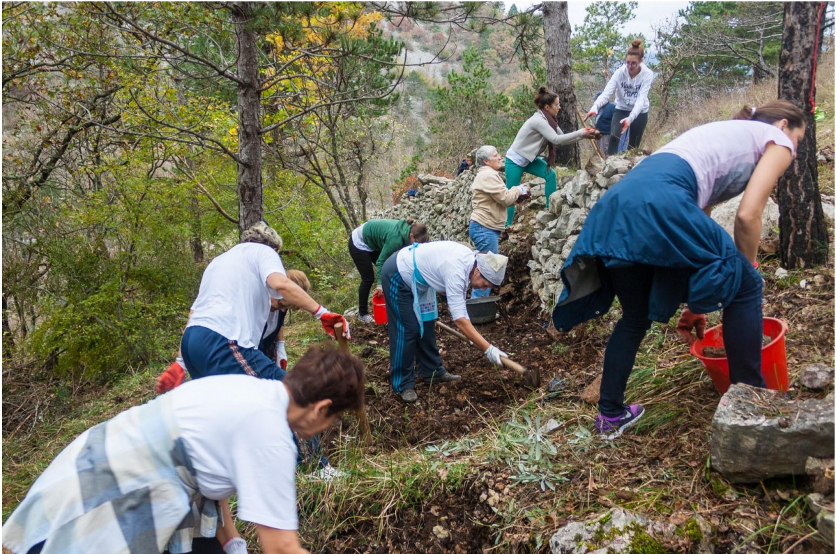
Sl. 9. Radionica „Očuvanje gromača“ na Kotoru pokraj Crikvenice