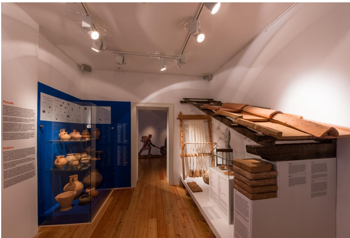
Sl. 25. Izložba „845 stupnjeva celzijusa“