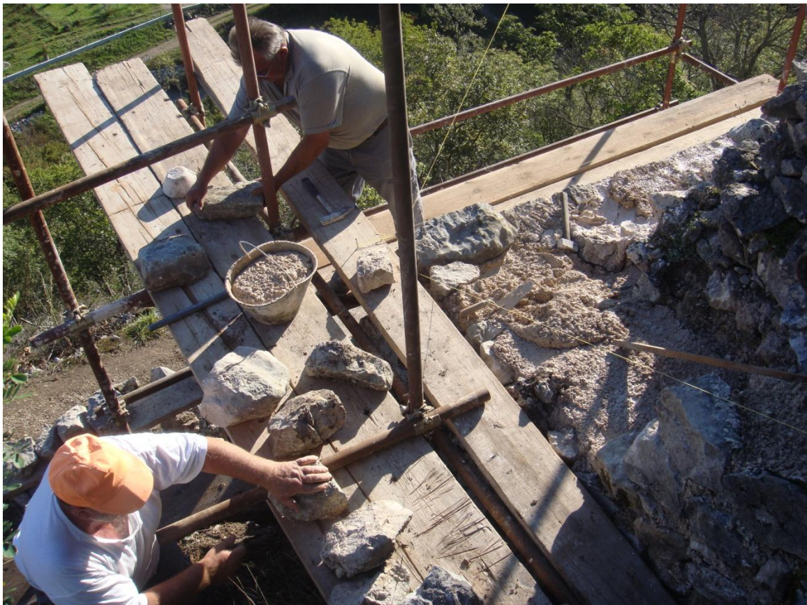
Sl. 33. Konzervatorski radovi na srednjovjekovnoj utvrdi Badanj pokraj Crikvenice