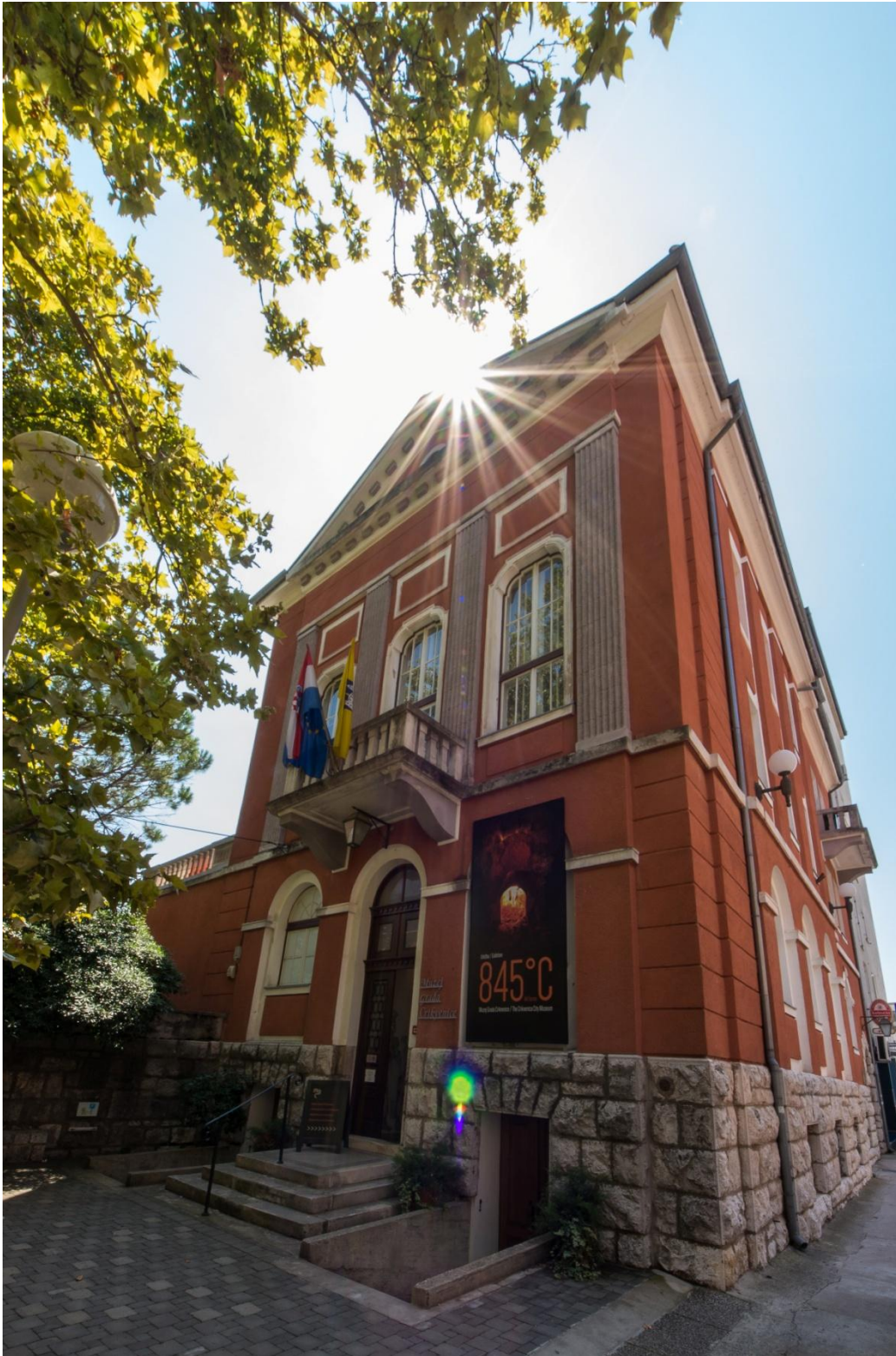
Sl. 1. Zgrada muzeja