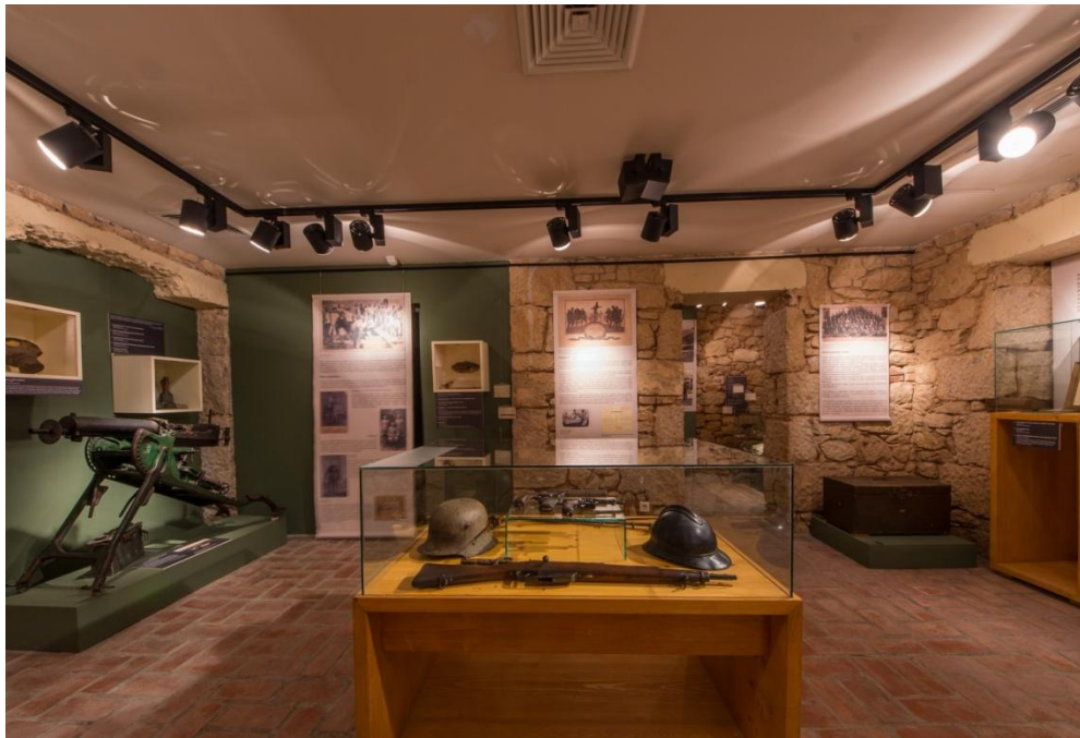
Sl. 30. Izložba „Zaboravljeni rat 1914.-1918.“