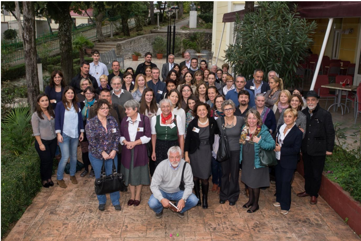
Sl. 5. 3. međunarodni arheološki kolokvij - Rimske keramičarske i staklarske radionice