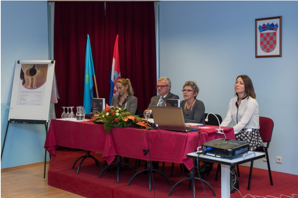
Sl. 4. 3. međunarodni arheološki kolokvij - Rimske keramičarske i staklarske radionice