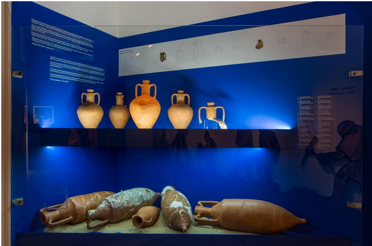
Sl. 26. Izložba „845 stupnjeva celzijusa“