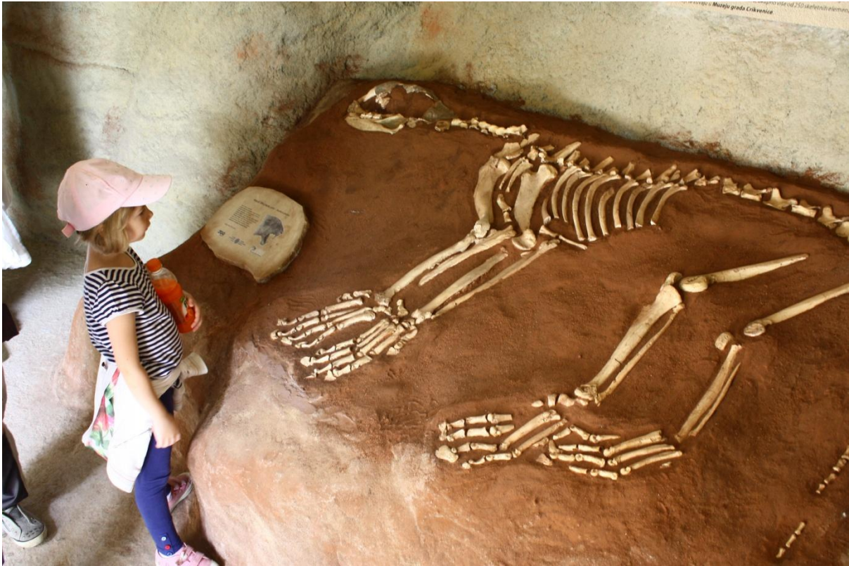
Sl. 6. Nastambe lavova u ZOO Zagreb