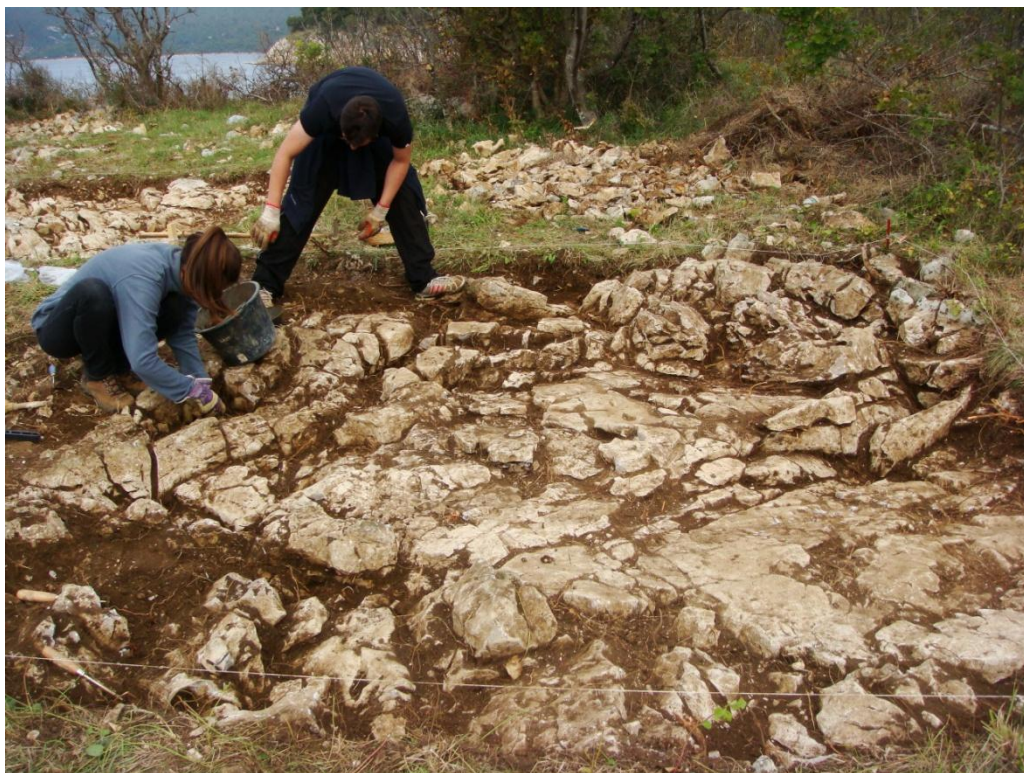
Sl. 37. Arheološka istraživanja u Jadranovu, uvala Lokvišća - prostor uništene antičke nekropole