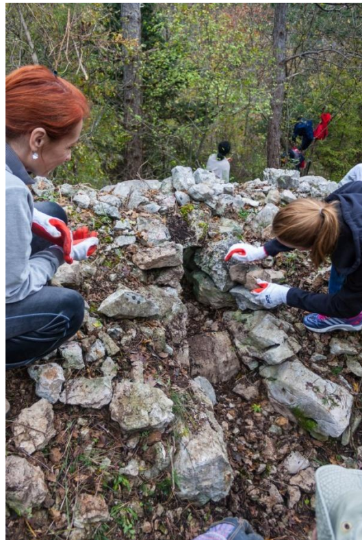
Sl. 7. i Sl. 8. Radionica „Očuvanje gromača“ na Kotoru pokraj Crikvenice