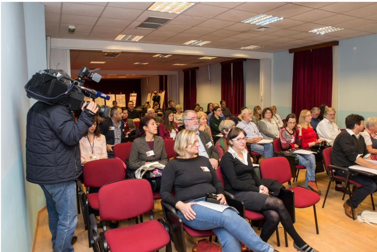
Sl. 3. 3. međunarodni arheološki kolokvij - Rimske keramičarske i staklarske radionice