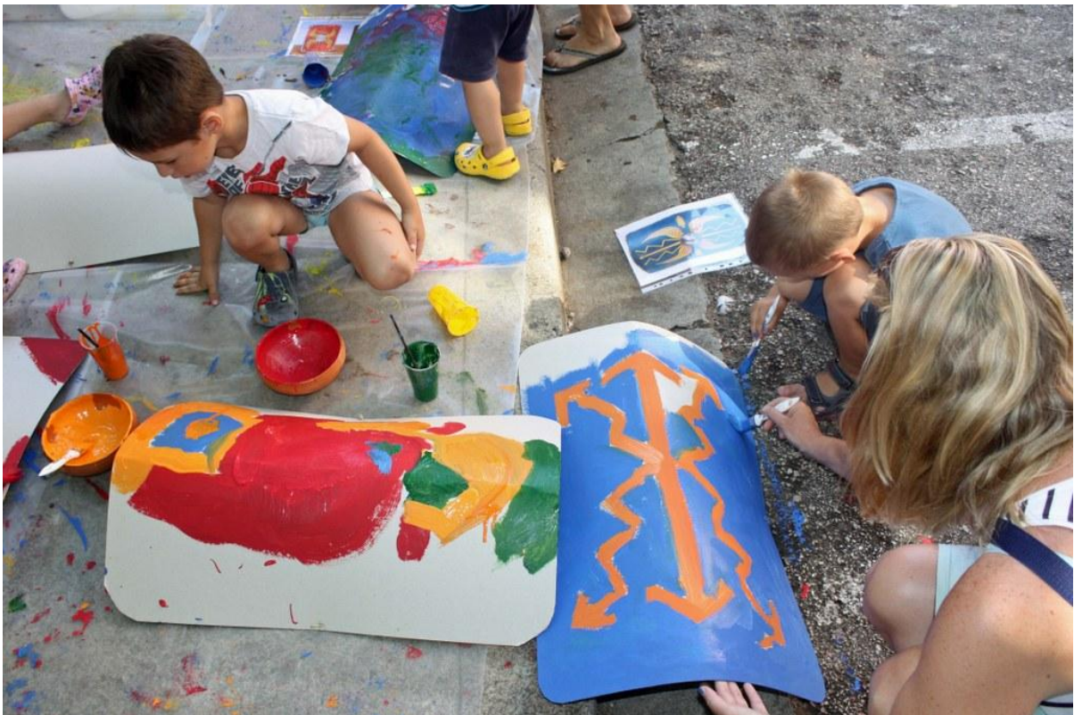
Sl. 13. Radionica povodom Dana Ad Turresa