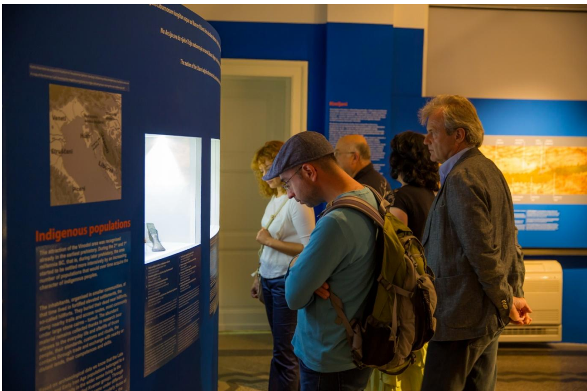
Sl. 27. Izložba „845 stupnjeva celzijusa“