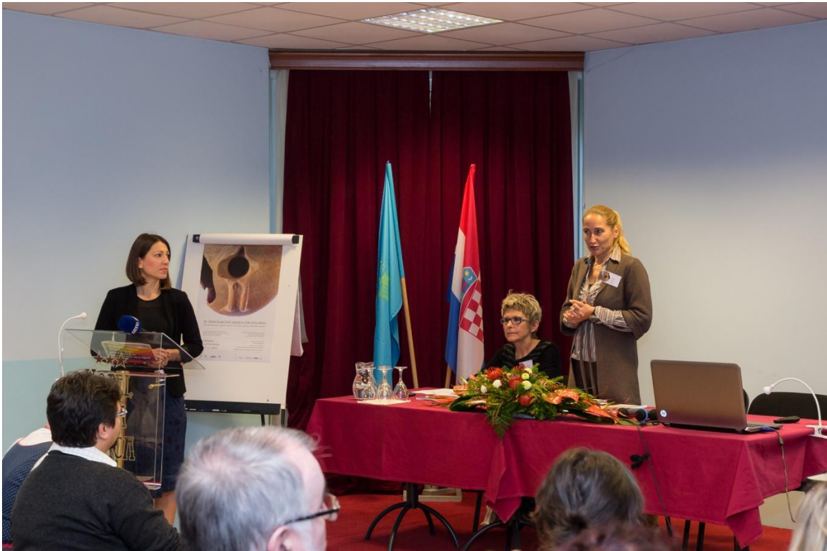
Sl. 2. 3. međunarodni arheološki kolokvij - Rimske keramičarske i staklarske radionice