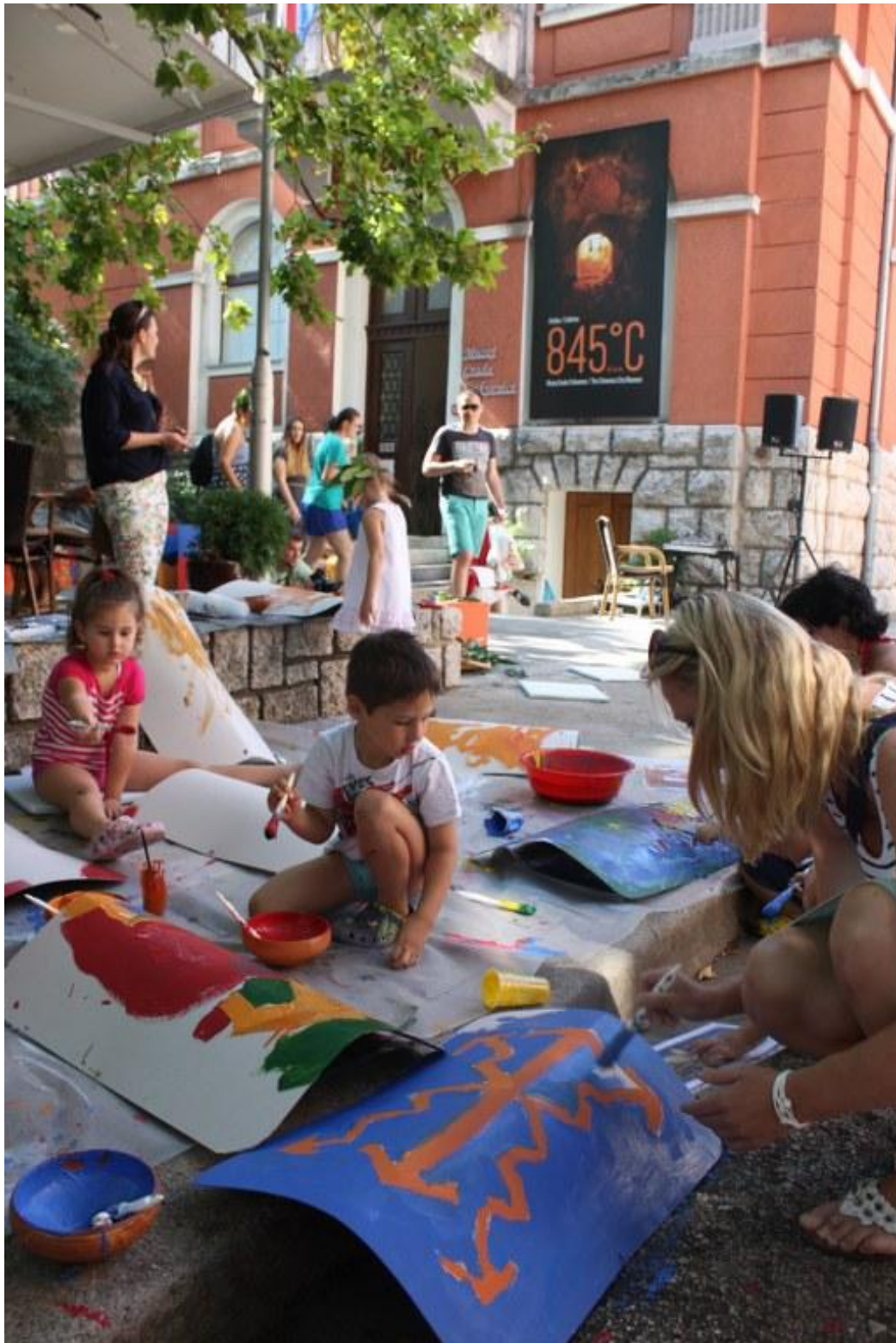
Sl. 14. Radionica povodom Dana Ad Turresa