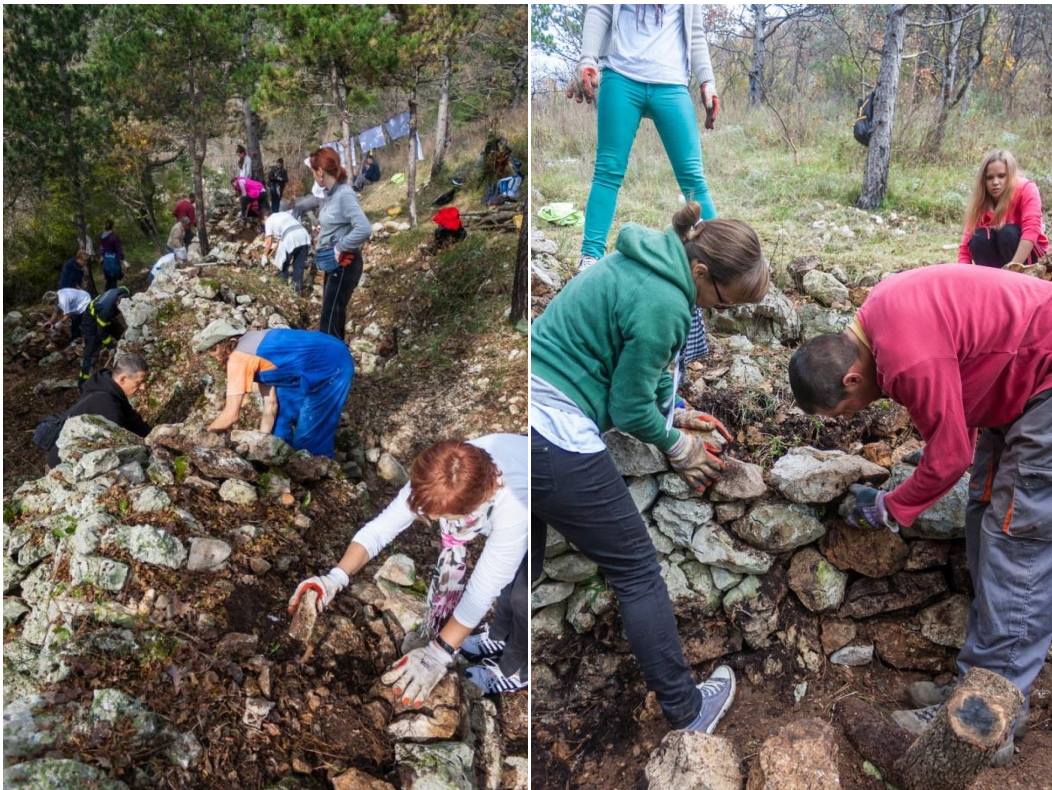
Sl. 10. i Sl. 11. Radionica Očuvanje gromača na Kotoru pokraj Crikvenice