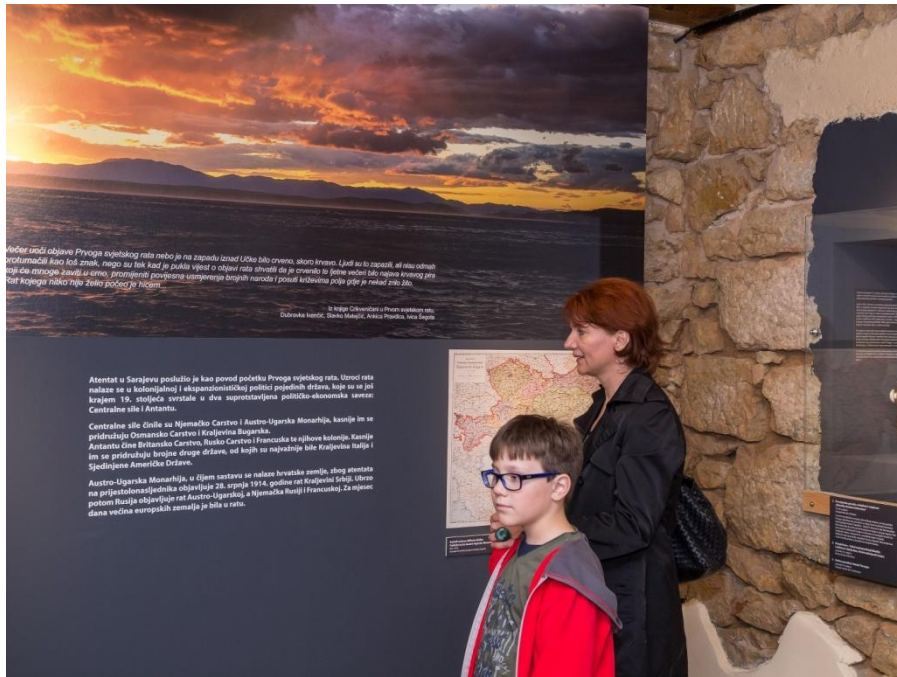
Sl. 32. Izložba „Zaboravljeni rat 1914.-1918.“