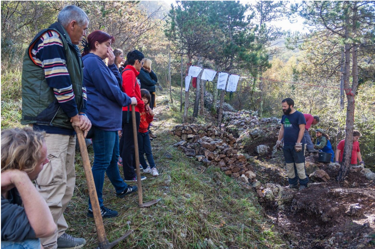
Sl. 12. Radionica „Očuvanje gromača“ na Kotoru pokraj Crikvenice