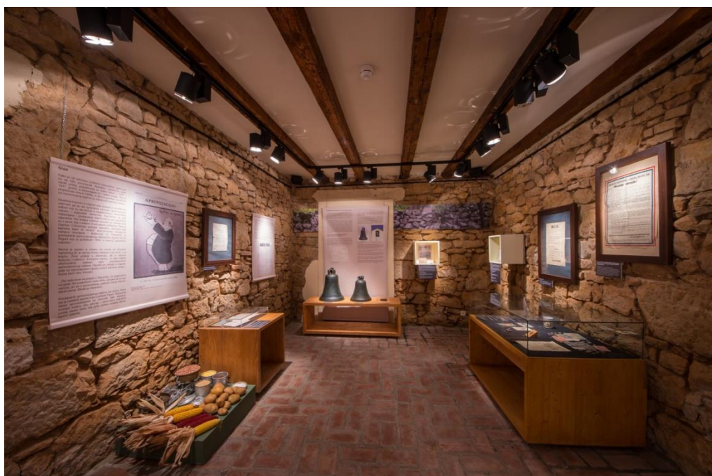
Sl. 29. Izložba „Zaboravljeni rat 1914.-1918.“