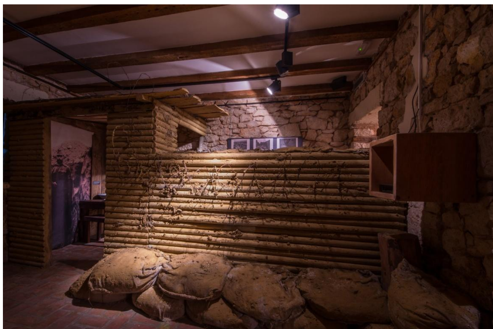
Sl. 28. Izložba „Zaboravljeni rat 1914.-1918.“