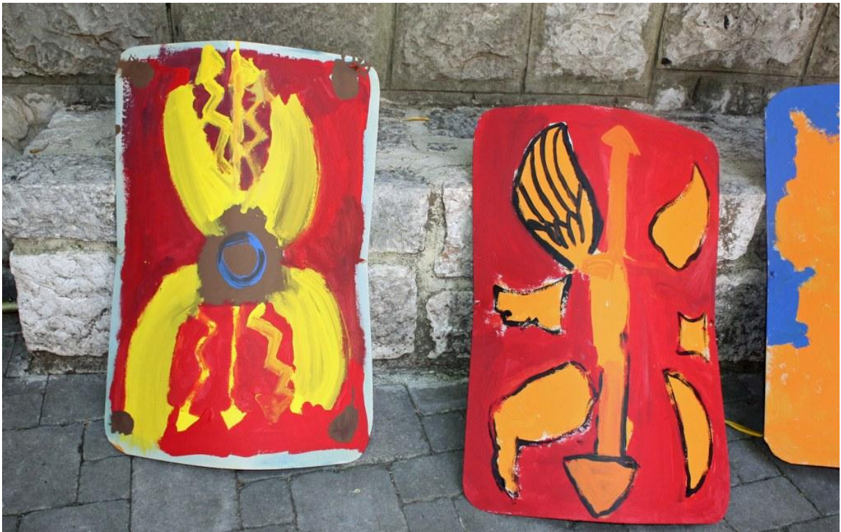
Sl. 22. Radionica povodom Dana Ad Turresa