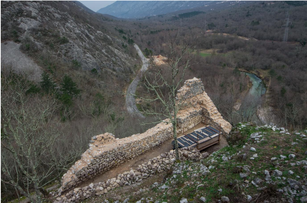
Sl. 34. Konzervatorski radovi na srednjovjekovnoj utvrđi Badanj pokraj Crikvenice