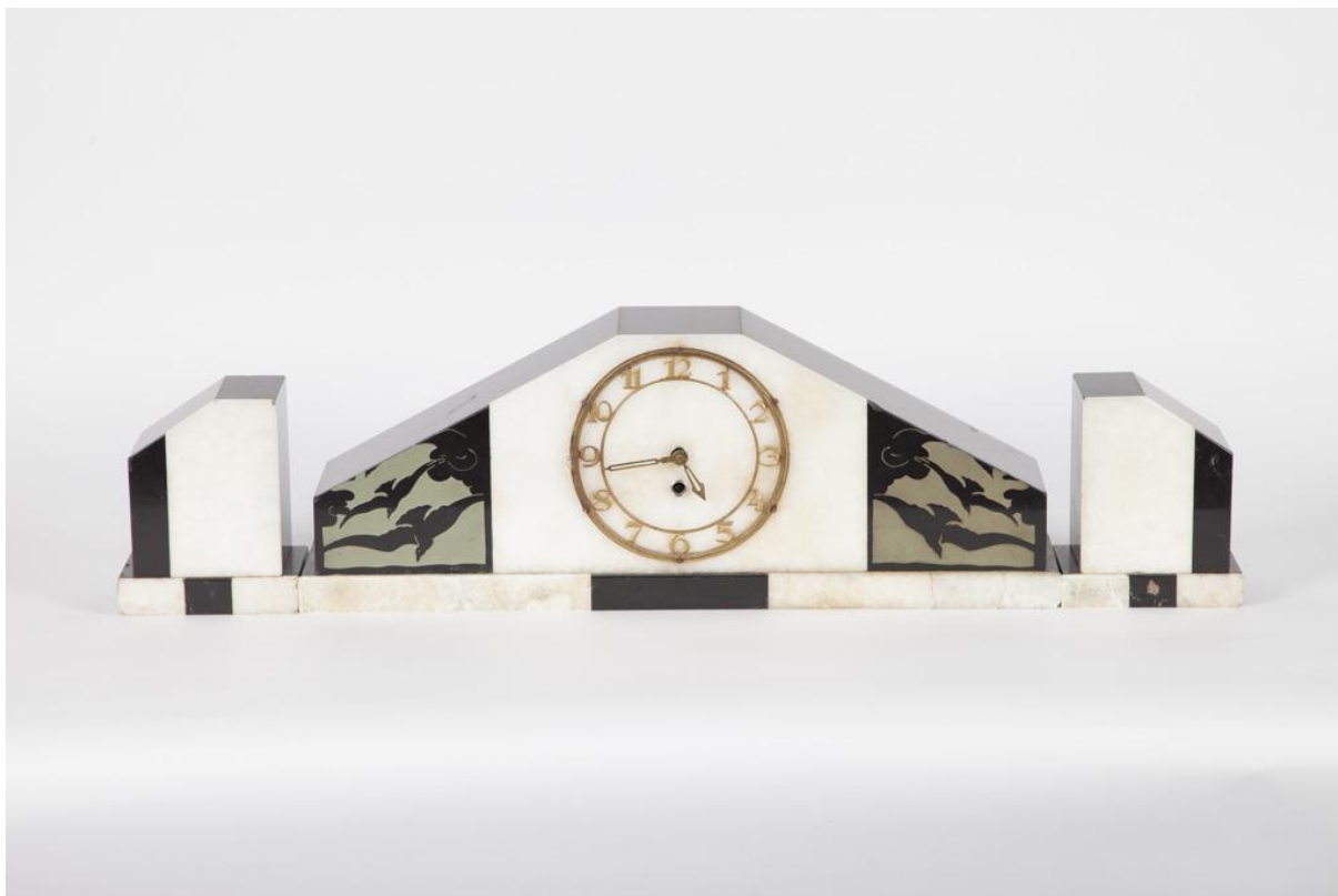
Sl. 1. Kaminska garnitura, Francuska, oko 1930., mramorni oniks, bakelit, mjed metalna legura, otkup