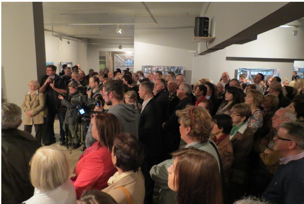
Sl. 5. Na otvorenju izložbe „RIP – Riječka industrijska priča“