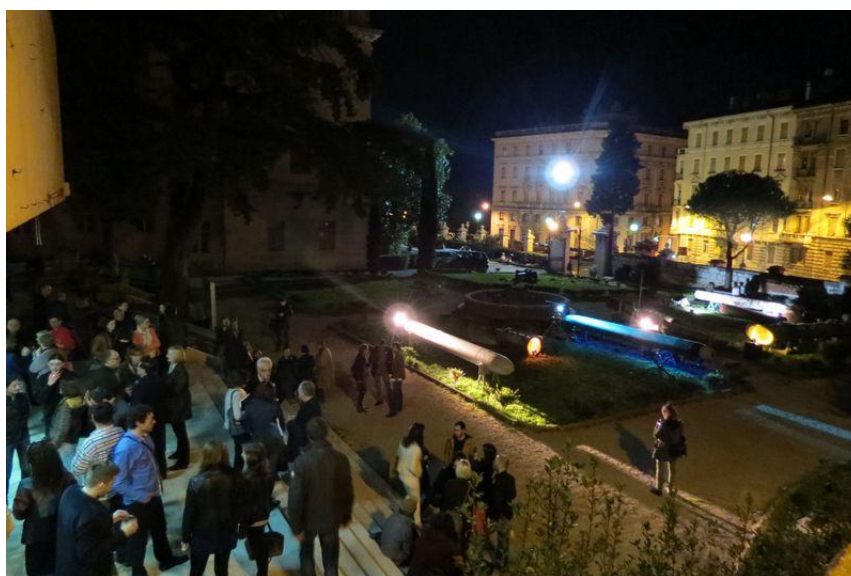
Sl. 6. Na otvorenju izložbe „RIP – Riječka industrijska priča“