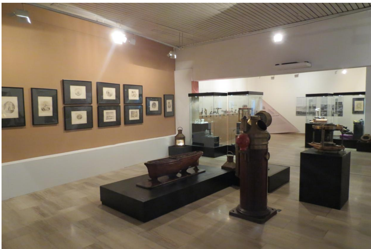
Sl. 4. Detalj postava izložbe „Mornarička akademija i pomorsko školstvo u Rijeci, Bakru i Malom Lošinj“