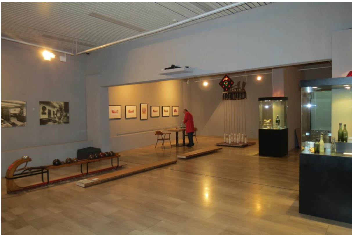
Sl. 10. Detalj postava izložbe „Neusser Altbier - Staro pivo iz Neussa“ – gostovanje Clemens-Sels Museuma iz Neussa