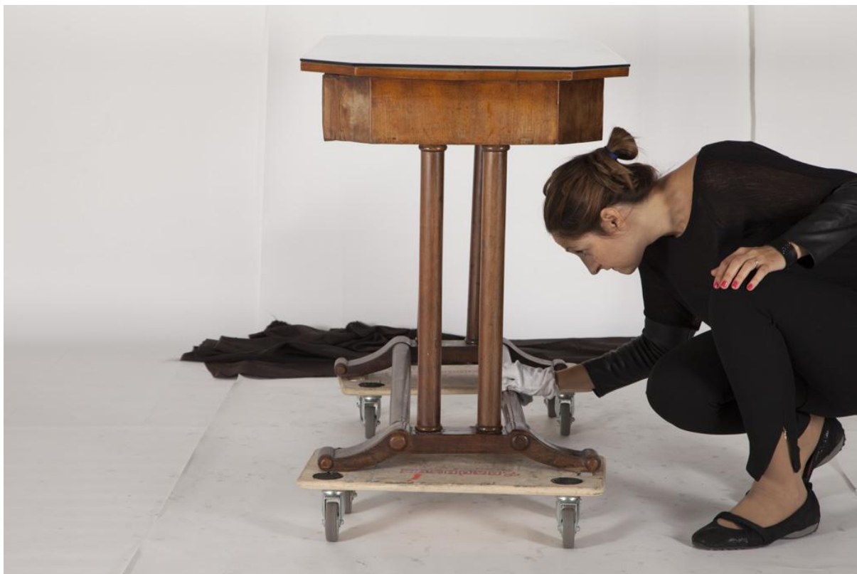
Sl. 3. Digitalizacija Zbirke umjetničkog obrta