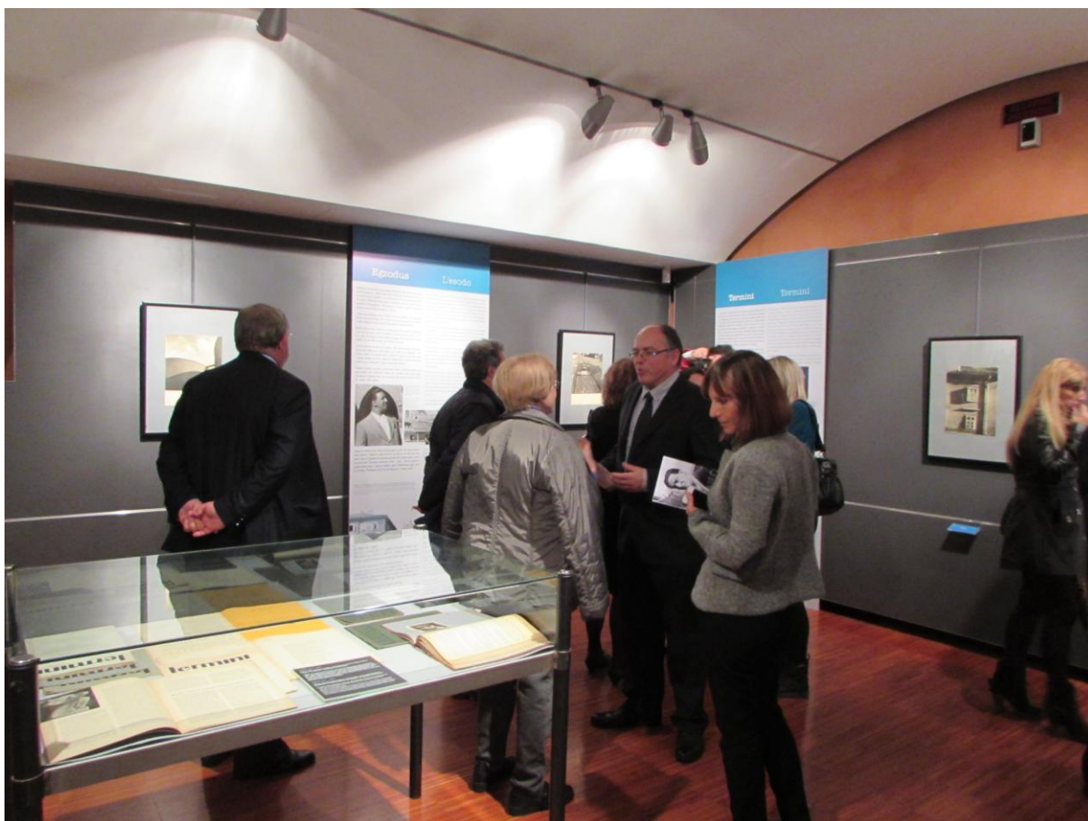
Sl. 8. Međunarodna suradnja, gostovanje Muzeja s izložbom „Francesco Drening, Talijansko-hrvatski kulturni dodiri 1900.–1950.“ u Palazzo Gopceovich u Trstu