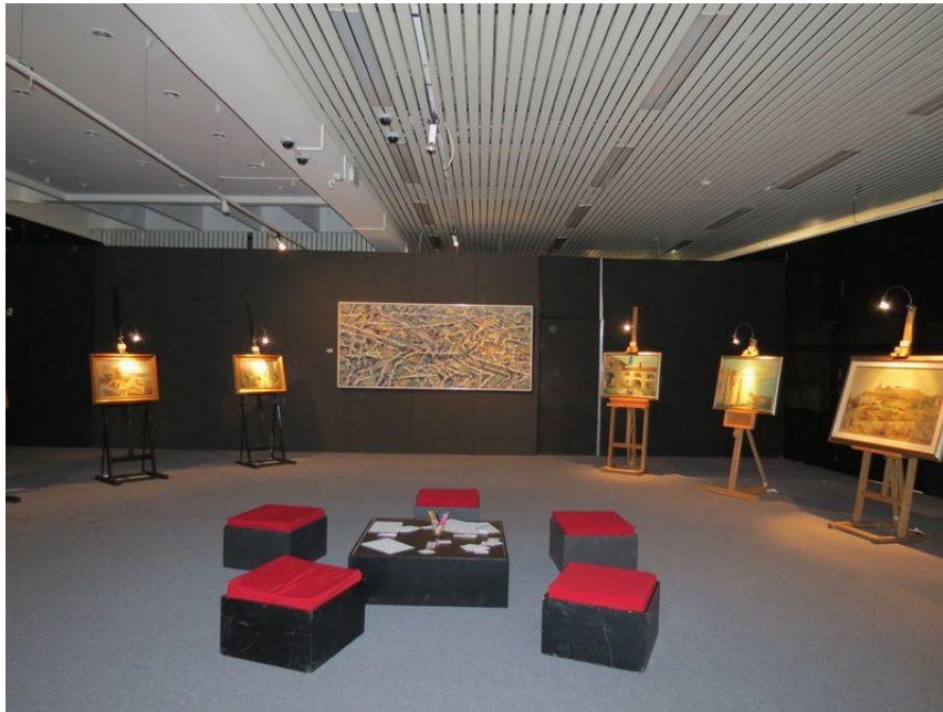
Sl. 9. Detalj postava izložbe iz fundusa „More, kamen, grad“, foto: Marija Lazanja Dušević