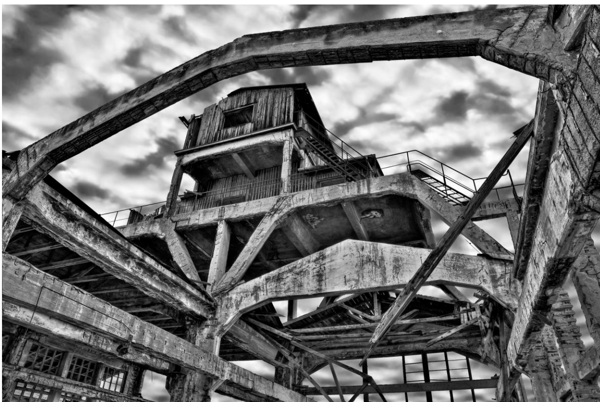
Sl. 2. Stanislav Belička, „Torpedo, Lansirna stanica“, 2010., HDR, c/b, 26,5 x 40 cm, dar autora